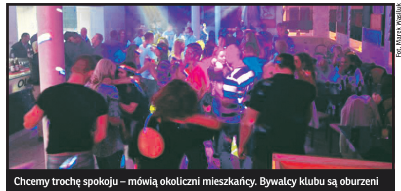
Chcemy trochę spokoju – mówią okoliczni mieszkańcy. Bywalcy klubu są oburzeni

Olimpia nie jest w Międzyrzecu pierwszym klubem, którego działalność budzi tyle negatywnych emocji. Od początku lat 90-tych powstało ich kilkanaście. Wszystkie prędkiej lub później