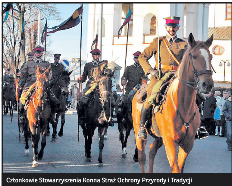
Członkowie Stowarzyszenia Konna Straż Ochrony Przyrody i Tradycji

cie umundurowaną. Wielu z nich doświadczenie zdobywało w Akademickich Klubach Jeździeckich, gdzie żywe były tradycje kawaleryjskie. Dlatego dążyli do wizji formacji konnej jednolite umundurowanej i wyszkolonej. Wyszukanie kawaleryjskie sprzyjało lepszej współpracy dużej ilości koni i jeźdźców, a umundurowanie sprawiło, że są bardziej zauważalni i rozpoznawalni. Współpracują z Nadleśniczymi, władzami miast i gmin, policją, strażą pożarną, organizacjami młodzieżowymi, kombatanckimi i ekologicznymi. Niedawno uczestniczyli w historycznej rekonstrukcji męczeństwa Unitów Drelowskich, gdzie wcielili się w oddział kozaków.