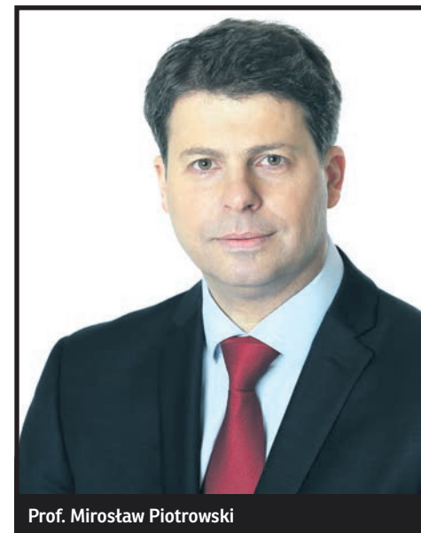
Prof. Mirosław Piotrowski

Polskę określa się mianem kraju postkolonialnego, tego określenia używają polscy publicyści. Nie możemy pozwolić, aby Polska była tak traktowana. Powinniśmy mieć takie same prawa, jak inne państwa europejskie. Obecnie tak nie jest. Istnieją regulacje unijne, zakazujące dotowania ze strony