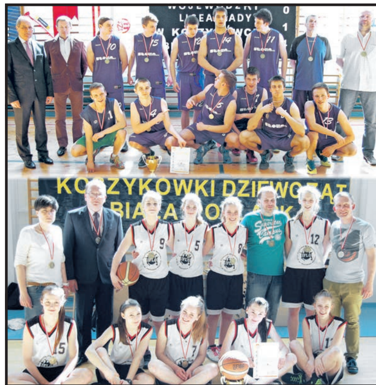
Mistrzowie województwa z białskiego „Kraszaka” i mistrzyni ze „Staszica”