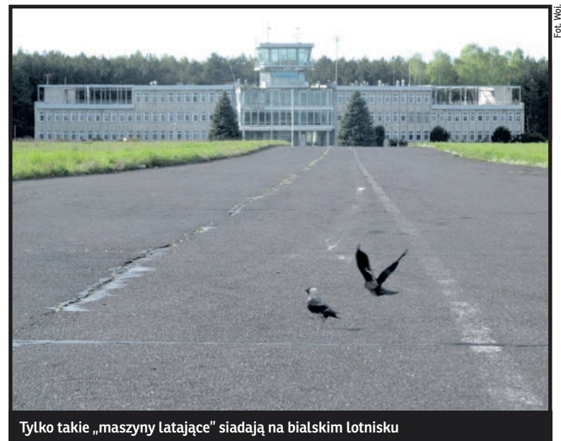
Tylko takie „maszyny latające” siadają na białskim lotnisku

Na razie po współpracy z Białą Airport, poza wzajemnym oskarżeniami, zostały też niezapłacone przez spółkę należności wobec miasta. Kwoty jeżą włos na głowie. Magistrat pobierał wprawdzie od spółki czynsz dzierżawny, ale odraczał jej podatek od nieruchomości. Przez takie działania do kasy miasta nie wpłynęła kwota aż 8,9 mln złotych. Powiększona o odsetki należność wynosi dziś aż 11,6 mln zł. Okazuje się także, że Biała Airport nie zapłaciła czynszu dzierżawnego za okres od stycznia do marca 2013 roku. Tu zaległość wynosi z odsetkami ponad 130 tysięcy złotych.