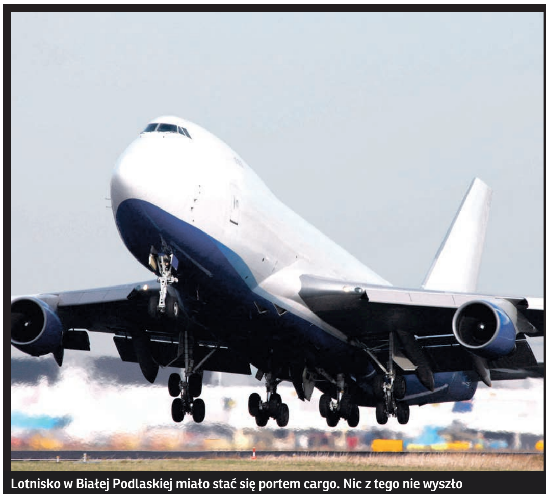
Lotnisko w Białej Podlaskiej miało stać się portem cargo. Nic z tego nie wyszło

Zamiast cywilnego lotniska i tysięcy nowych miejsc pracy była wielka klapa. Współpraca władz Białej Podlaskiej ze spółką Biała Airport zakończyła się nie tylko fiaskiem ale i gigantycznym mankiem w miejskiej kasie. Okazuje się, że prywatne przedsiębiorstwo wciąż zalega miastu z zapłatą blisko 12 milionów złotych z tytułu podatków i opłat dzierżawnych! Dzięki niedawnemu wyrokowi sądu w Lublinie magistrat może znów swobodnie dysponować terenem lotniska. Miejmy nadzieję, że tym razem urzędnicy zaproponują sensowne rozwiązania, na których zyskają mieszkańcy Białej Podlaskiej. Koniecznym jest też odzyskanie zaległego podatku. To niemal tyle, co roczny budżet miasta na inwestycje!