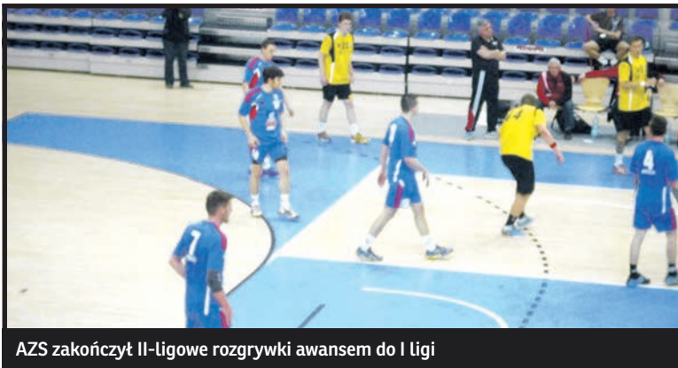
AZS zakończył II-ligowe rozgrywki awansem do I ligi