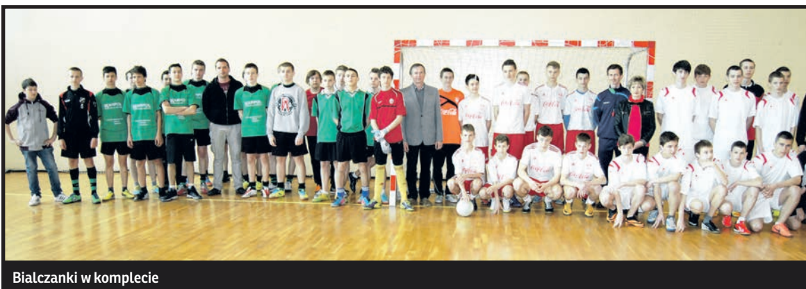
Białczanki w komplecie