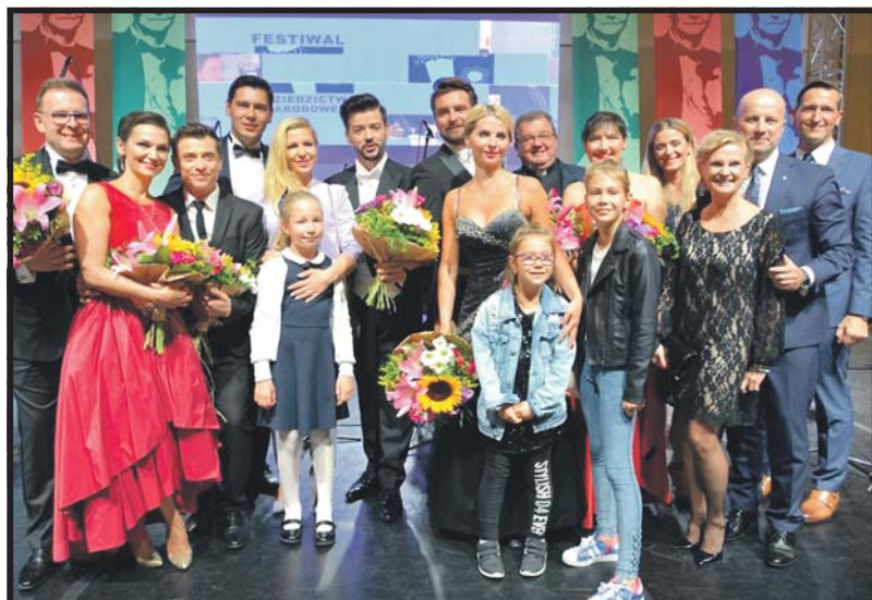
Gala „Zaszarowany Świat Bogusława Kaczyńskiego” była okazją do zaprezentowania nie tylko operetkowych przebojów, ale i sylwetki patrona festiwalu

Bogusław Kaczyński był niezwykłym człowiekiem. Jego pasje: muzyka kla-