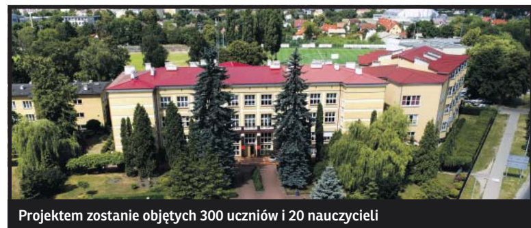
Projektem zostanie objętych 300 uczniów i 20 nauczycieli

sprzęt i materiały dydaktyczne, zorganizowane zostaną dodatkowe kursy i szkolenia dla uczniów i nauczycieli oraz 150 staży u pracodawców. Projektem zostanie objętych łącznie 300 uczniów, kształcących się w zawodach technik: logistyki, spedytora, geodety, handlowca, architektury krajobrazu, ekonomista oraz 20 nauczycieli. Realizacja projektu potrwa do końca sierpnia 2020 r.