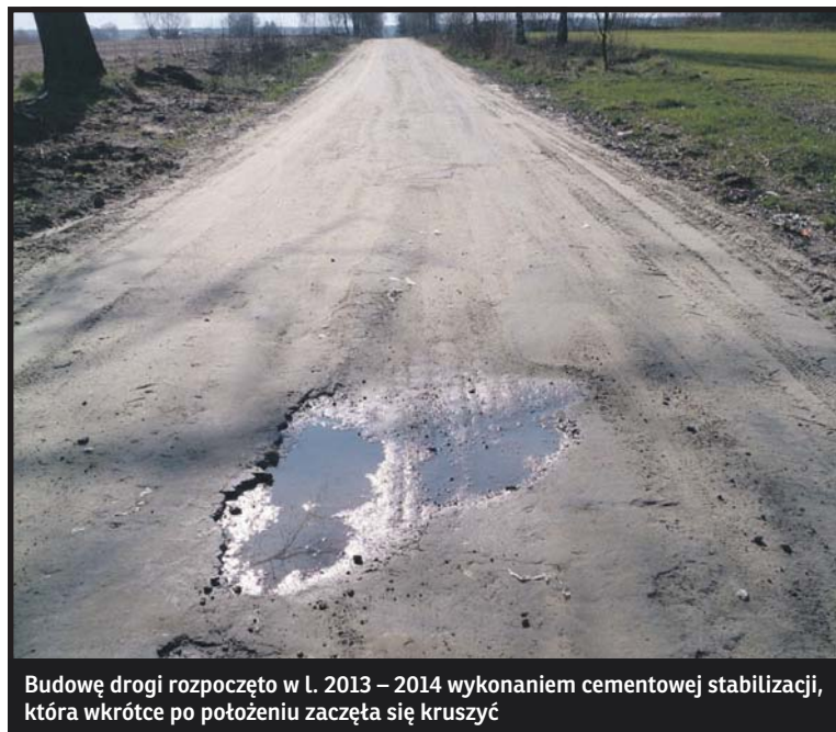
Budowę drogi rozpoczęto w l. 2013 – 2014 wykonaniem cementowej stabilizacji, która wkrótce po położeniu zaczęła się kruszyć

bilizowanej. Natomiast zgodnie z projektem drogi stabilizacja powinna mieć szerokość 5,80, co równa się 6.090,0 m 2 powierzchni stabilizacji. Wobec tego ilość zakupionego cementu powinna wynosić 158,34 t., a nie – 177,5 t. Ponadto odcinek drogi od km. 0+800 do km. 0+958 budowany był bez pozwolenia na budowę. Pozwolenie inwestor uzyskał dopiero w rok po zakończeniu tego etapu. W 2014 r. wykonano stabilizację na dalszym odcinku drogi 0,6 km. w systemie gospodarczym plus czyn społeczny. Także i tym razem zwięźziono szerokość stabilizacji z projektowanej 5,80 m. do 5,20 m. Jawi się pytanie: Co inwestor zrobił z nadmiarem zakupionego cementu? Z protokołu wynika, że projekt drogi został wykonany niezgodnie z przepisami, a pod potrzeby inwestora. Kosztorys inwestorski został zrobiony nierzetelnie.