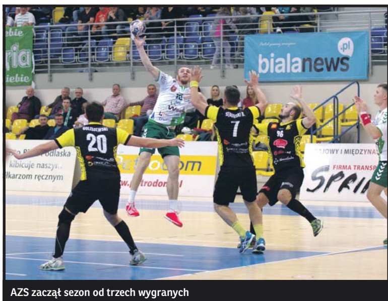
AZS zaczął sezon od trzech wygranych

Olimpia: Polak, Stroiński, Niedzielski – G. Olchwiruk 8, Szyszko 8, Tarasiuk 5, Kobyliński 3, Cielecki 3, Jaszczuk 2, Polok 2, Grochowski 1, Fic 1, Michalczuk, Winnicki