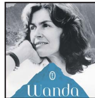
Wanda Rutkiewicz zginęła w 1992 r. na Kancenzondze, trzecim szczycie ziemi

To opowieść o pokonywaniu własnych demonów, przełamywaniu słabości i o wielkiej, życiowej pasji, która, dając niebywałą siłę, może również spalać. Wanda Rutkiewicz to trzecia kobieta i pierwsza Europejka na Mount Evereście. Pierwsza kobieta, która zdobyła szczyt K2. Od małego słynęła ze „żmudzkiego” uporu. Szybko musiała dorosnąć, by wesprzeć matkę w domowych obowiązkach. Ojcu chciała z kolei zastąpić pierworodnego syna, który zginął śmiercią tragiczną. Najpierw dźwigała ciężar niełatwej historii rodzinnej, później sprawy „na dole” zawsze pozostawiała na drugim planie. Żyła od wyprawy do wyprawy. Nigdy nie zdecydowała się na macierzyństwo. Rozpadły się jej dwa małżeństwa.