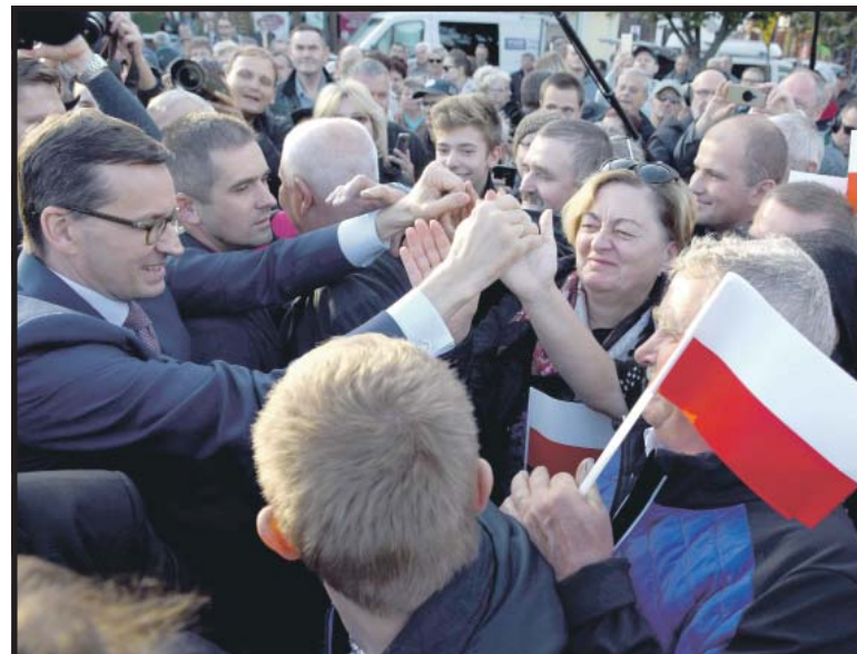
Mateusz Morawiecki: Dotrzymujemy słowa – tak działamy w rządzie i tak będziemy działać w samorządzie

– U schyłku swego życia powiedział tak: „W swoim życiu znałem tylko dwie partie: polską i antypolską”. My na pewno jesteśmy partią polską, nasz program jest tak zbudowany, żeby wszystkie sukcesy przekładać na los zwykłego człowieka. Czy chodzi o wymiar sprawiedliwości, który reformujemy, czy programy dla samorządów, a są to: termomoderni-