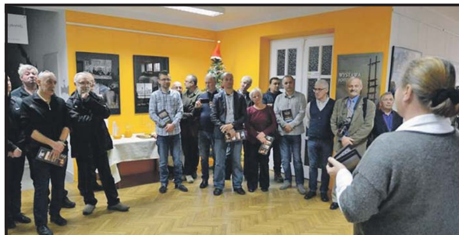
Członkowie Fotoklubu Podlaskiego spotykają się co miesiąc, rokrocznie jeżdżą na jesienne plenery, a od 10 lat prezentują w grudniu najcenniejsze zdjęcia, wykonane w kończącym się roku