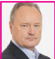
JANUSZ SZEWCZAK Posel PiS