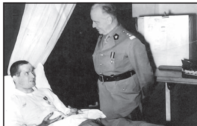
Gen. Władysław Sikorski udekorował rannego pilota Krzyżem Virtuti Militari