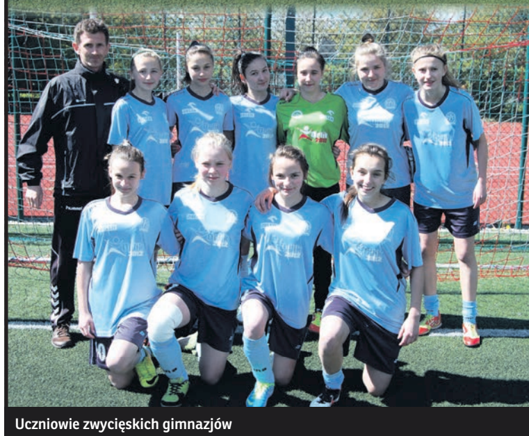
Uczniowie zwycięskich gimnazjów