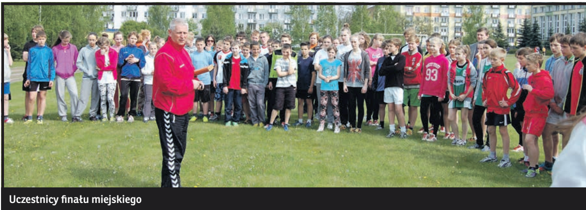
Uczestnicy finału miejskiego

Miejsce drugie wywalczyło PGM 1 Piszczac, a trzecie – Gm 2 Miedzyrzec Podlaski.