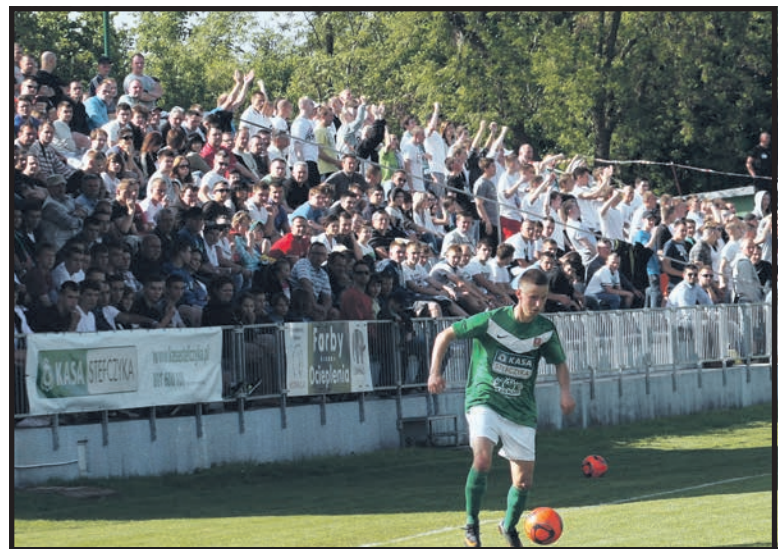
Jeszcze niedawno stadion Podlasia wypełniali kibice, obecnie przychodzi ich garstka