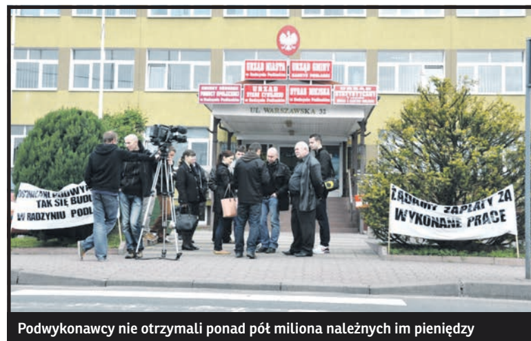
Podwykonawcy nie otrzymali ponad pół miliona należnych im pieniędzy

– Przyjechaliśmy tutaj w jednym celu, aby miasto wypłaciło nam pieniądze. Na budowie byli obecni przedstawiciele urzędu, a teraz twierdzą, że nas nie znają, coś tu jest chyba nie tak. Czujemy