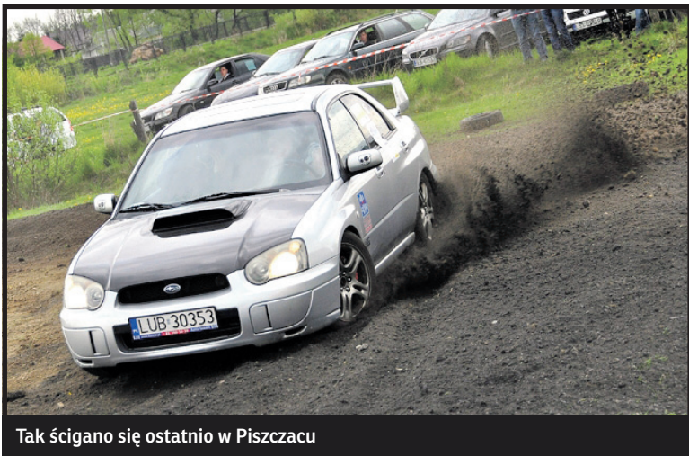
Tak ścigano się ostatnio w Piszczacu

W najbliższą niedzielę Automobilklub Podlaski organizuje rajd „Szwajcaria Podlaska 2014” w ramach Turystyczno-Nawigacyjnych Mistrzostw Okr. Lubelskiego PZM'2014. Zbiórka uczestników o godz. 10 w Białej Podlaskiej na Pl. Wolności. Rajd jest imprezą otwartą dla wszystkich chętnych, jednak punkty do klasyfikacji TNMOL zdobywają wyłącznie uczestnicy zrzeszeni w klubach okręgu lubelskiego PZM. Załogi stanowią kierowca i pilot, ewentualni pasażerowie są osobami towarzyszącymi, którzy nie mogą brać udziału w konkurencjach rajdowych. Podczas rozwiązywania testów i zadań konkursowych załogi nie mogą korzystać z pomocniczego sprzętu elektronicznego (cyfrowe aparaty fotograficzne, kamery, telefony komórkowe, nawigacje GPS itp.). Wpisowe – 25 zł od osoby. W jego ramach organizator zapewnia komplet materiałów rajdowych, nagrody oraz ciepły posiłek.