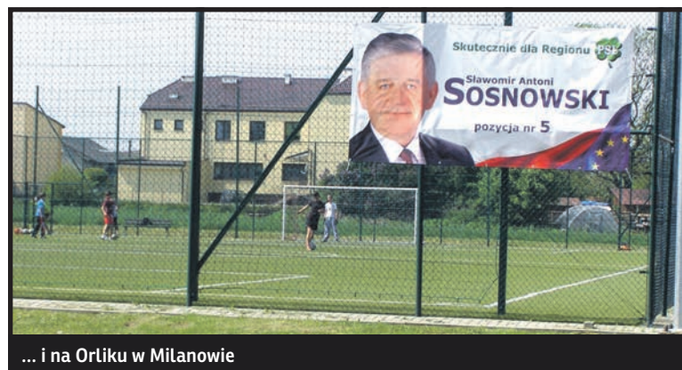
... i na Orliku w Milanowie

i hasel wyborczych na „ścianach budynków, przystankach komunikacji publicznej, tablicach i słupach ogłoszeniowych, ogrodzeniach, latarniach, urządzeniach energetycznych, telekomunikacyjnych i innych” za zgodą właściciela lub zarządcy nieruchomości bądź urzędnika. Odpowiedź to bardzo lakoniczna i w zasadzie nie odnosząca się do najważniejszych wątpliwości i kwestii etycznych.