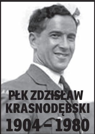
PŁK ZDZISŁAW KRASNODĘBSKI 1904 – 1980

Bohater spoczął w ojczystej ziemi. Prochy pułkownika pilota Zdzisława Krasnodębskiego, pochodzącego z Woli Osowińskiej pierwszego dowódcy legendarnego Dywizjonu 303 zostały złożone do grobu na warszawskich Powązkach. Rozpiera nas dumą, a gardło dławi wzruszenie. Chwała bohaterowi! Chwała wielkiemu synowi podlaskiej ziemi!