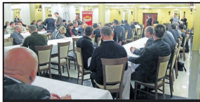
16 – 17 maja Akademia Nowego Samorządu wznowi zajęcia