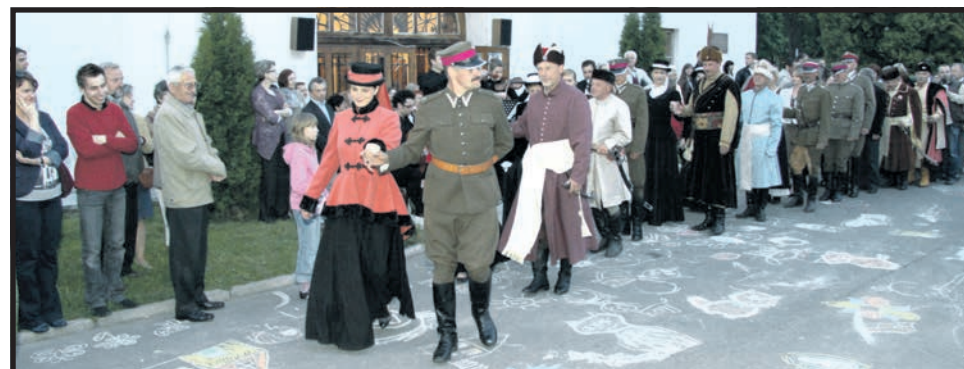
Tak bawiliśmy się w ubiegłych latach. Już w sobotę odbędzie się kolejna „Noc Muzeów”

dziło znaczną kolekcją malarstwa współczesnego. Posiada ponadto okazałe zbiory numizmatyczne i medalierskie. Systematycznie powiększa zbiory historyczne, gromadząc dokumenty, archiwalia, przedmioty związane z przeszłością miasta i re-