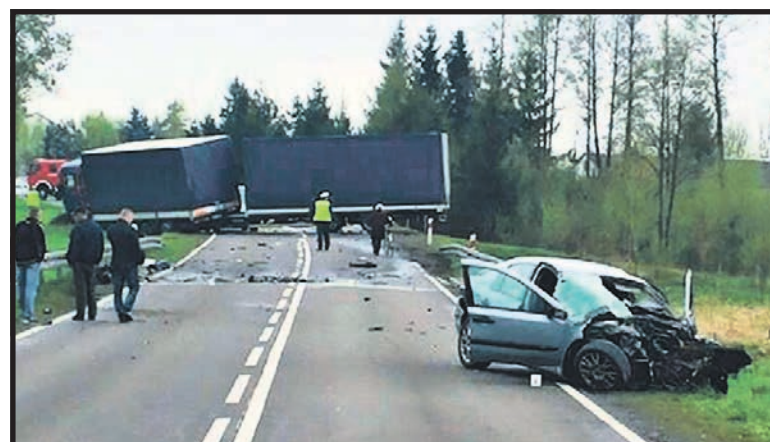
Budowa dwupasmowej drogi ekspresowej przyczyniłaby się również do zwiększenia bezpieczeństwa na odcinku dziewiętnastki przebiegającym przez powiat radzyński. Na ruchliwej trasie dochodzi do wielu groźnych wypadków

– Jej powstanie ma ogromne znaczenie dla aktywizacji gospodarczej całej wschodniej części kraju – podkreślił prezes Prawa i Sprawiedliwości. Niestety, po przejęciu władzy przez koalicję PO-PSL nowy rząd nie potrafił wywalczyć dla S19 miejsca wśród priorytetów europejskich. Do 2015 roku nie uda się nawet wybudować odcinka tej