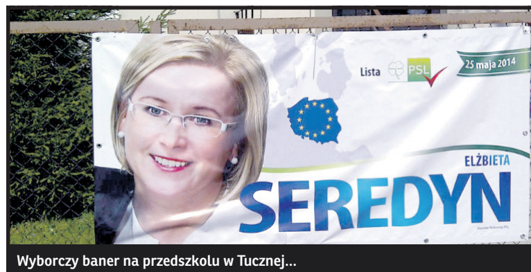
Wyborczy baner na przedszkolu w Tucznjej...