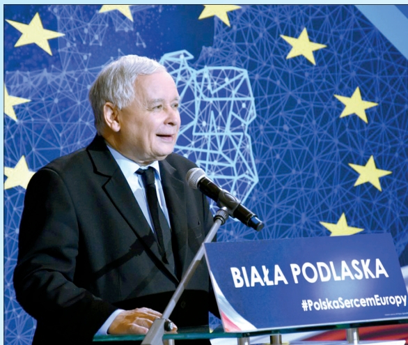
Jarosław Kaczyński mobilizował wyborców

– Chodzi o to, żeby ci, którzy chcą Polskę cofnąć do czasu przeszłego, ci którzy chcą, żeby było jak było, żeby ci nie mieli satysfakcji i nadziei na to, że zwyciężą – podkreślał Jarosław Kaczyński, zachęcając do głosowania na kandydatów z listy PiS.