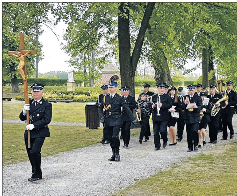
Strażacy jak co roku świętowali swój dzień w kodeńskim Sanktuarium

To była już dwudziesta Pielgrzymka Strażaków Powiatu Białskiego, którzy tradycyjnie zbrali się w dniu swego święta w Sanktuarium Matki Bożej Kodeńskiej Królowej Podlasia w Kodniu.