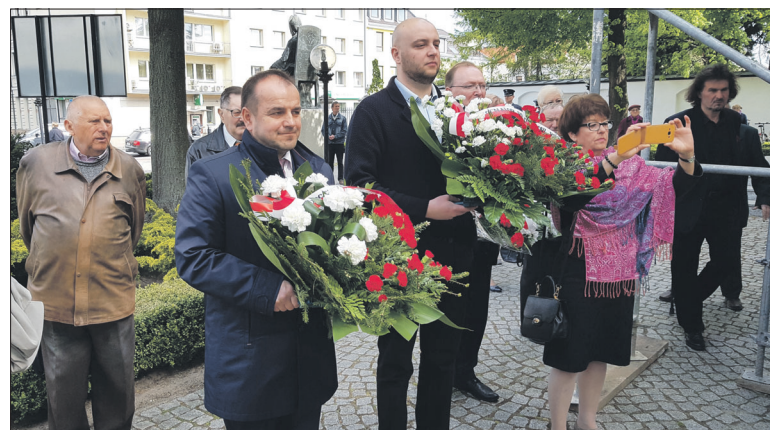
Uczestnicy uroczystości złożyli kwiaty pod pamiątkową tablicą