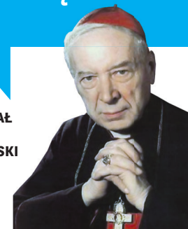
KARDYNAŁ STEFAN WYSZYŃSKI

Wrogów naszego Narodu poznajemy po tym, jak się odnoszą do Boga i do moralności chrześcijańskiej (...). Wiedzą, że jest ona siłą i mocą Narodu, że najlepiej służy jego bytowi, całości i jedności. I dlatego chcą zniszczyć Naród, niszczą jego wiarę i moralność chrześcijańską.