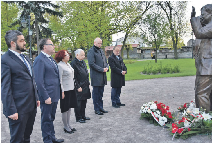
Zaduma przy białskim pomniku śp. Lecha i Marii Kaczyńskich