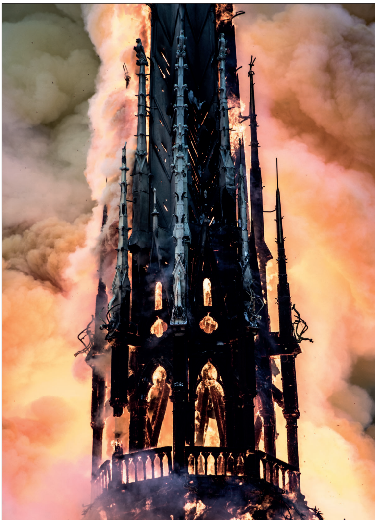
Płonąca katedra Notre Dame to swego rodzaju symbol. Czy Kościół we Francji i zachodniej Europie się odrodzi?

Nie można patrzeć na pożar katedry, nie uwzględniając pełnego kontekstu. Zaledwie miesiąc temu wybuchł pożar w kościele Saint-Sulpice (drugiej największej świątyni katolickiej w Paryżu).