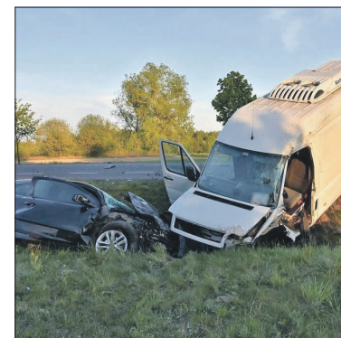
W wypadku zginął 34-latek

bówką kierował 22-letni mieszkaniec Łodzi. Był trzeźwy. Busem podróżowały dwie osoby. Funkcjonariusze ustalają, który z mężczyzn siedział za kierownicą auta. Zarówno kierowca jak i pasażer w chwili zdarzenia wypadli z samochodu. W wyniku odniesionych obrażeń 34-letni mieszkaniec Białej Podlaskiej poniósł śmierć na miejscu. Do szpitala przewiezieni zostali 4 uczestnicy zdarzenia. Policjanci ustalają wszystkie okoliczności wypadku oraz apelują o rozwagę i bezpieczeństwo na drodze.