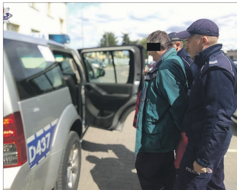
Policjanci zatrzymali mężczyznę, który odpowie za zastrzelenie psa

Zebrany w sprawie materiał dowodowy pozwolił na przedstawienie mężczyźnie zarzutów. Podczas przesłuchania