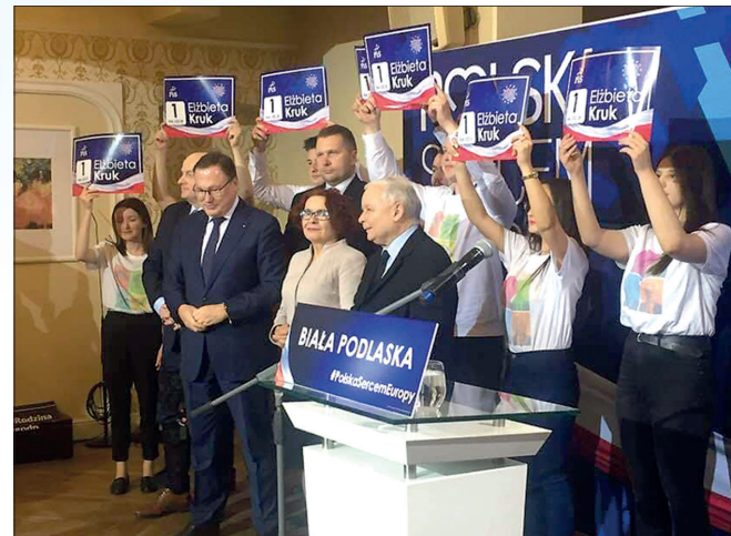
– Czeką nas trudna walka – mówili politycy PiS