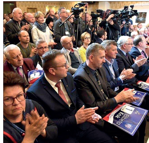
Lidera PiS oklaskiwały setki mieszkańców