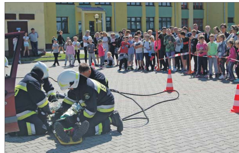
Jedną z atrakcji konstantynowskiego Dnia Dziecka był pokaz umiejętności strażackich