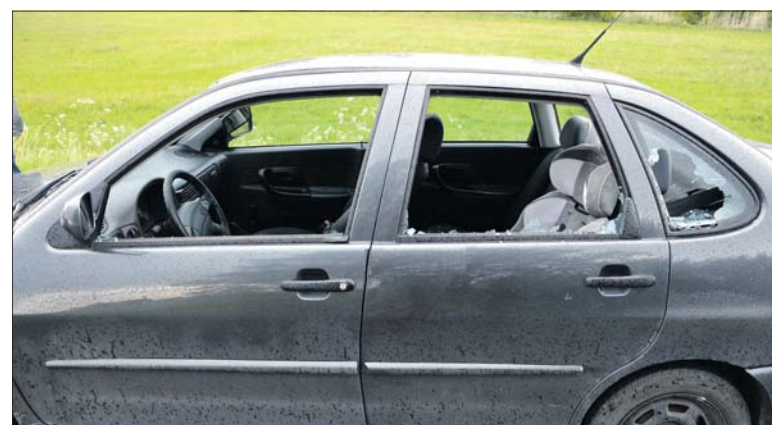
Tak wyglądało auto po ataku byłego partnera właścicielki