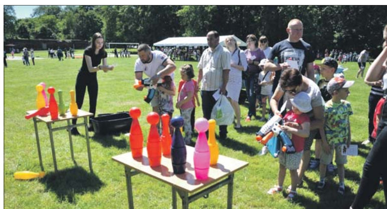
Olimpiada Przedszkolaka odbyła się już po raz szesnasty