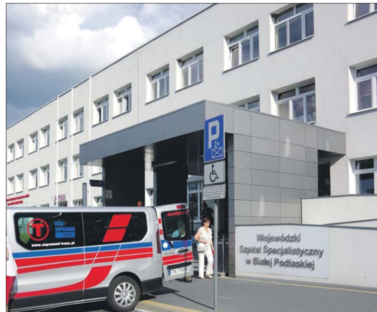
fol. materiały własne

– Zresztą on pracuje nie tylko w Białej. W czasie jego wolnym od pracy w szpitalu pracuje prywatnie w Międzyrzeczu. I tam pracuje z dziećmi w wieku już dorosłym, wie pan, nastolatki, nastolatki. Gdyby cokolwiek było w jego zachowaniu, to z tamtej strony pewnie