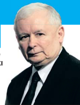
JAROSŁAW KACZYŃSKI Prezes PiS

Konfederacja to organizacja prorosyjska i po prostu szkodliwa. PiS jest gwarancją, że Polska nie będzie płaciła za niemieckie zbrodnie II wojny światowej.