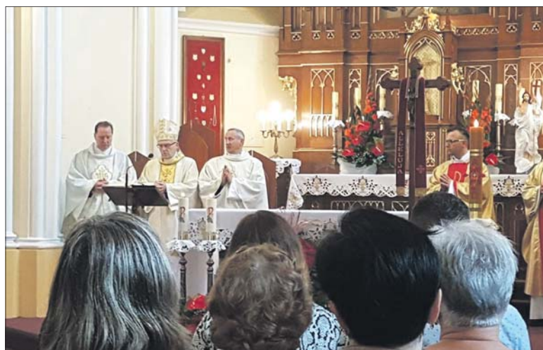
Uroczystej Mszy Świętej przewodniczył biskup siedlecki Kazimierz Gurda