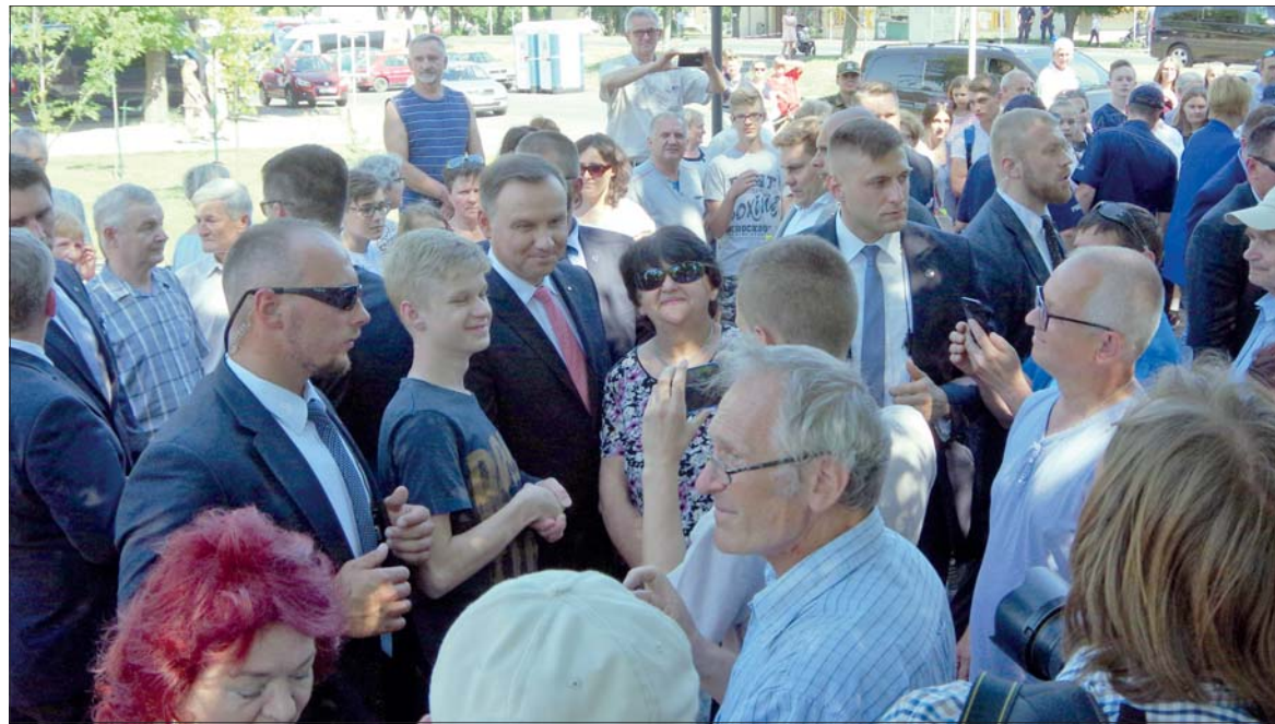
Prezydent Andrzej Duda stawia na spotkania z Polakami. Był już m.in. w Białej Podlaskiej, Parczewie i Radzynie Podlaskim

Prezydent Duda po raz kolejny podkreślił, jak ważne są dla niego spotkania