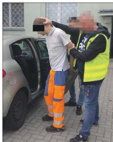
36-latek został schwytany przez policję

Do zdarzenia doszło w niedzielę 1 września. Około południa dyżurny bialskiej komendy powiadomiony został przez mieszkankę miasta, że jej sąsiad sucha muzyki zbyt głośno. Po przeprowadzonej interwencji funkcjonariusze otrzymali z tego samego adresu kolejne zgłoszenie. Tym razem zgłaszająca oświadczyła, że sąsiad groził jej pozabawieniem życia. W czasie całego zdarzenia trzymał w rękach siekierę. Na miejsce natychmiast skierowany został patrol policji. Funkcjonariusze zatrzymali 36-latkę, który w chwili zdarzenia znajdował się pod wpływem alkoholu. Za-