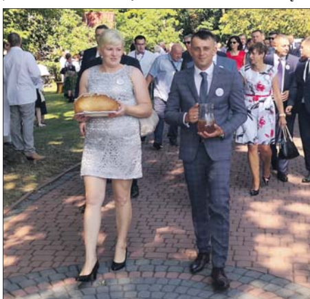
Korowód prowadzili Starościna i Starosta dożynek w Woli Osowińskiej