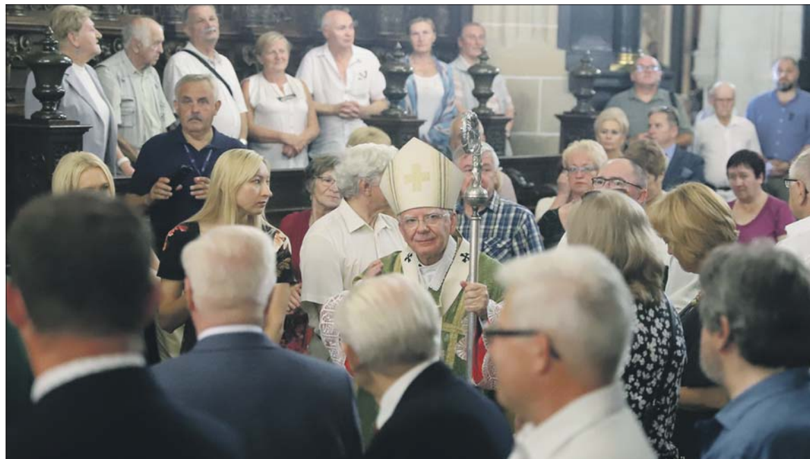
Abp Marek Jędraszewski jest wspierany przez wiernych i atakowany przez lewicę

Polska była jedynym z krajów opanowanych przez Sowietów, ale nie dała się