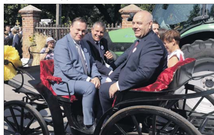
Dożynki w Woli Osowińskiej uświetnili obecnością m.in. wicepremier Jacek Sasin i senator Grzegorz Bierecki