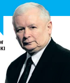
JAROSŁAW KACZYŃSKI Prezes PiS

13 października okaże się, czy Dobra Zmiana będzie kontynuowana. Mamy patriotyczny obowiązek zrobić wszystko, aby tego dnia zwyciężyć. To kwestia wielkiego wysiłku.