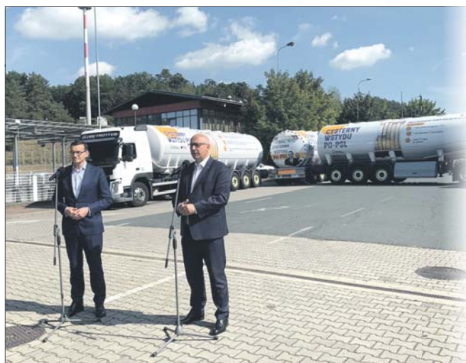
„Cysterny wstydu” to akcja PiS mająca przypomnieć, ile zarabiali przestępcy w czasach koalicji PO-PSL

Szef rządu mówił o konkretnych przykładach nadużyć. Podawał liczny. – Złodziejstwo przekraczało wszel-