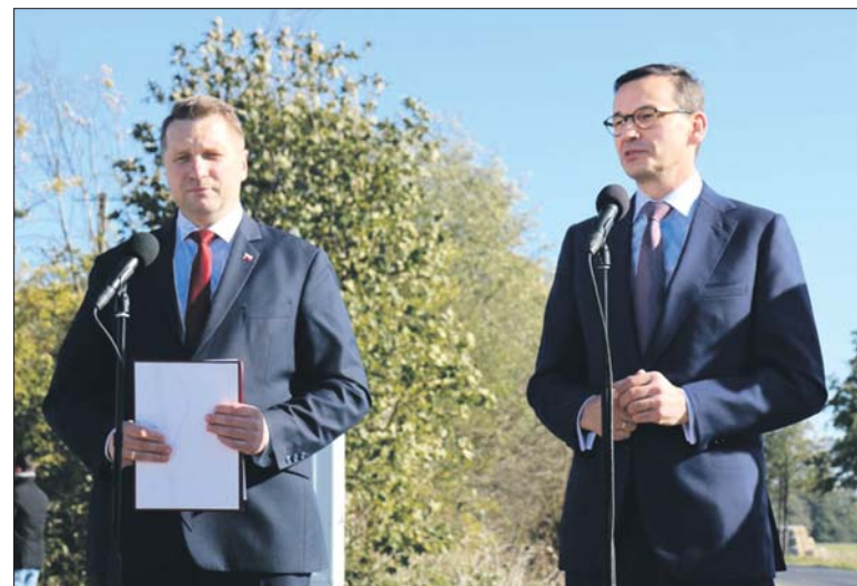
Premier Mateusz Morawiecki zatwierdził plany wydatków z Funduszu Dróg Samorządowych

Jak poinformował Andrzej Bittel, wiceminister infrastruktury i rozwoju, premier wprowadził na listach zmiany polegające na zwiększeniu dofinansowania, przeniesieniu zadań z list rezerwowych na podstawowe lub dodaniu nowych zadań. Żadne z zadań, znajdujących się na listach przekazanych przez wojewodów, nie zostało usunięte, ani nie była zmniejszona kwota dofinansowania. – Pracujemy intensywnie nad tym, aby jak najszybciej przekazać samorządom pierwsze umowy – mówi wojewoda lubelski Przemysław Czarnek. Województwo lubelskie dostało w tym roku ze środków FDS rekordową kwotę, bo aż 531,2 mln zł. Po podpisaniu umów z wojewodą samorzady będą mogły formalnie realizować zaplanowane inwestycje drogowe. Lista zadań