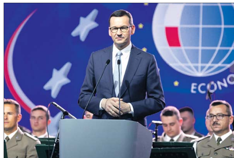
Mateusz Morawiecki przekonuje, że tylko PiS może zapewnić sprawne działanie państwa