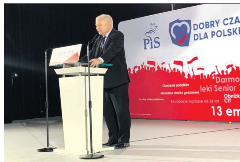
Jarosław Kaczyński prosi Polaków o wyborczą mobilizację