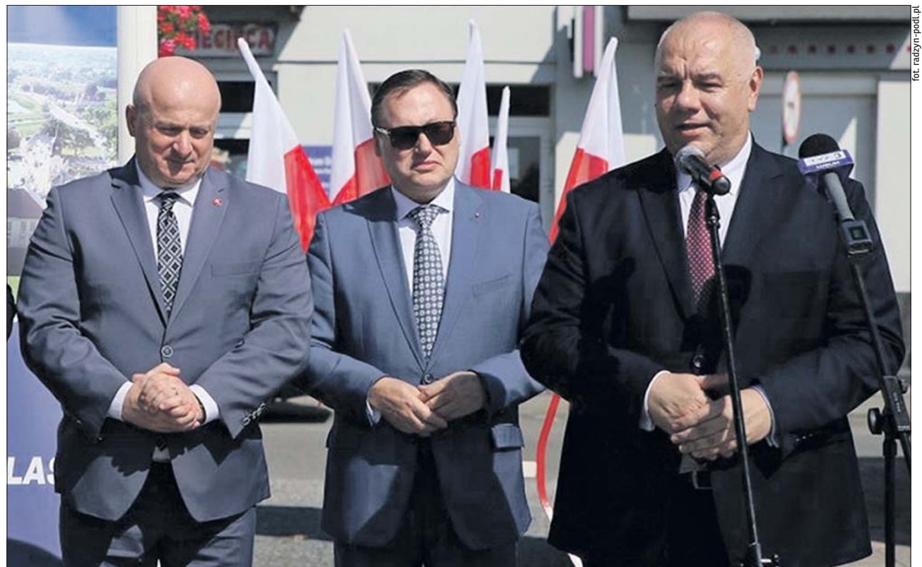
...Wpierali go w tej walce przyjaciele Radzyna Podlaskiego – politycy PiS