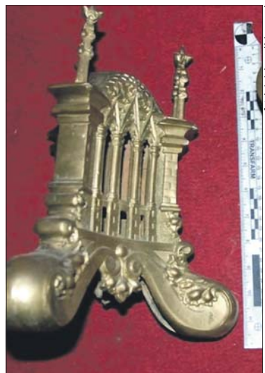
Policjanci odzyskali skradzione rzeczy

i rozpoczęli ich poszukiwania. Po kilkunastu minutach winni byli już w rękach policjantów. Obaj (32 i 62-latek) zostali zatrzymani i trafili do policyjnej celi.