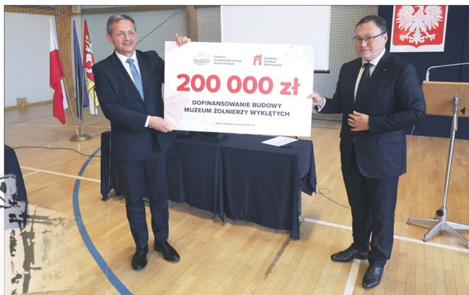
...powstanie m.in. dzięki wsparciu Fundacji Grzegorza Biereckiego „Kocham Podlasie”