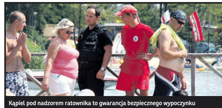
Kąpiel pod nadzorem ratownika to gwarancja bezpiecznego wypoczynku

Do szczególnie niebezpiecznych miejsc zaliczają się pokaźne „oczka” wodne, które powstały w wyrobiskach kopalni żwiru. Takich mniejszych i większych śmiertelnie niebezpiecznych zbiorników wodnych znajduje się bardzo dużo