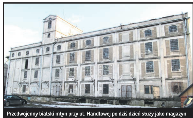
Przedwojenny białski młyn przy ul. Handlowej po dziś dzień służy jako magazyn

Odmienna sytuacja panowała w sąsiednich powiatach: radzyńskim i konstantynowskim. Tu wielka własność ziemiska miała odpowiednio 28% i 27% gruntów. Liczba majątków powyżej 1000 hektarów wynosiła w obu powiatach po 11. Tu przemysł był bardziej