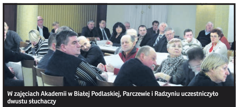
W zajęciach Akademii w Białej Podlaskiej, Parczewie i Radzynie uczestniczyło dwustu słuchaczy