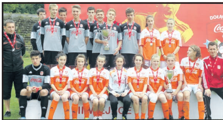
Wicemistrzowie województwa z Łomaz i Białej Podlaskiej

porażce z ZS Stanin 0:2, białczanie natomiast dotarli do finału, gdzie po rzutach karnych musieli uznać wyższość PGM 16 Lublin. Wśród dziewcząt z grupy nie udało się wyjść PGM 4 Biała Podlaska, ale ich koleżanki z PGM Łomazy dotarły do finału, gdzie minimalnie uległy PGM 16 Lublin 1:3.