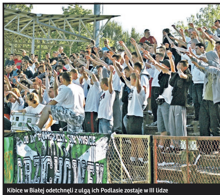
Kibice w Białej odetchnęli z ulgą: ich Podlasie zostaje w III lidze

lejce. Jeżeli wygra wszystkie spotkania do końca sezonu (trzy mecze) i zdoła wyprzedzić Spartę (sześć punktów przewagi) i Janowiankę (dziewięć punktów).