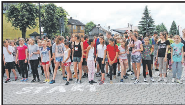
Uczestnicy biegu na starcie