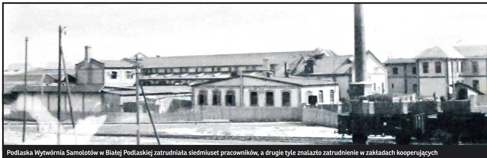
Podlaska Wytwórnia Samolotów w Białej Podlaskiej zatrudniała siedmiuset pracowników, a drugie tyle znalazło zatrudnienie w zakładach kooperujących

Położenie naszych ziem w okresie II Rzeczypospolitej wydawało się bardzo korzystne tak ze względów gospodarczych, jak i politycznych. Nasz region znajdował się wówczas w centrum państwa polskiego. Poprawiła się komunikacja. Ze stolicą województwa Lublinem była ona co prawda – tak jak dzisiaj – stosunkowo słaba, znacznie lepsza za to – z innymi regionami. Węzłem komunikacyjnym był Brześć. Obok kluczowej linii kolejowej wschód zachód – istniała linia północ – południe, łącząca Chełm i Włodawę przez Brześć do Czeremchy i Białegostoku. Obecnie linia ta za Włodawą kończy się na przejściu granicznym z Białorusią. Połączenia te uzupełniała linia kolejowa Lublin – Parczew – Radzyń – Łuków. Rozbudowano również li-