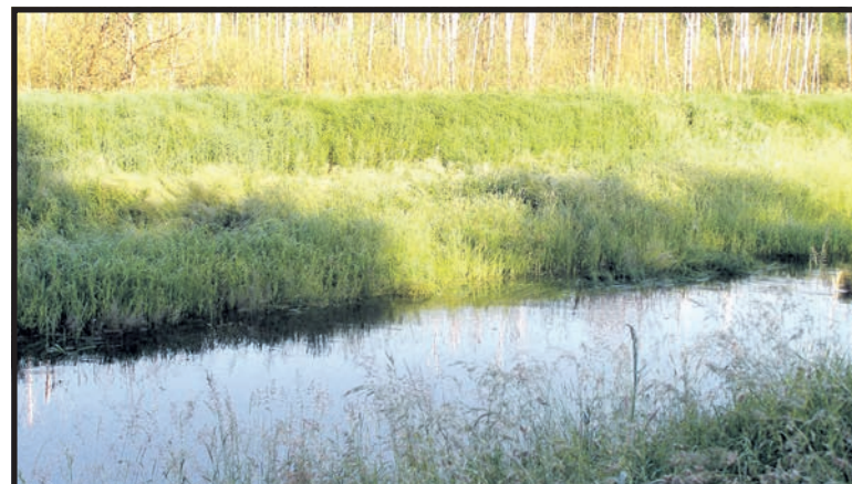
Władze wojewódzkie zamiast rewitalizować zaniedbany kanał Wieprz – Krzna zamierzają budować nowy kanał

Nie wiadomo jednak czy władze województwa znajdą czas na zajęcie się rewitalizacją kanału Wieprz-Krzna, po-