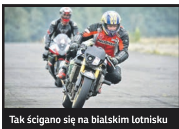
Tak ścigano się na białskim lotnisku