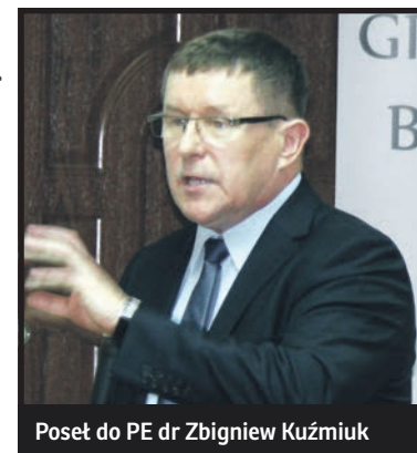
Poset do PE dr Zbigniew Kuźmiuk