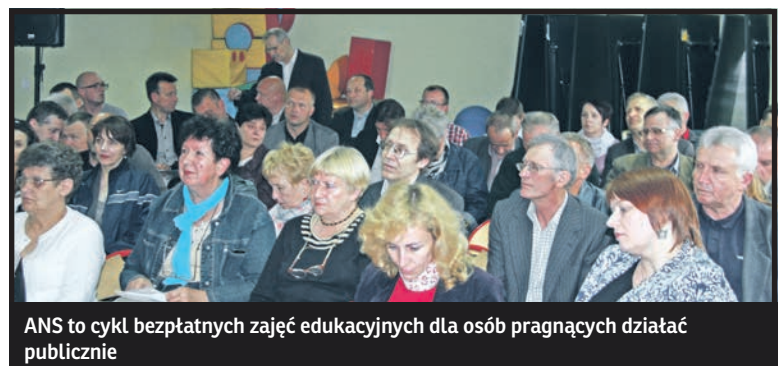
ANS to cykl bezpłatnych zajęć edukacyjnych dla osób pragnących działać publicznie