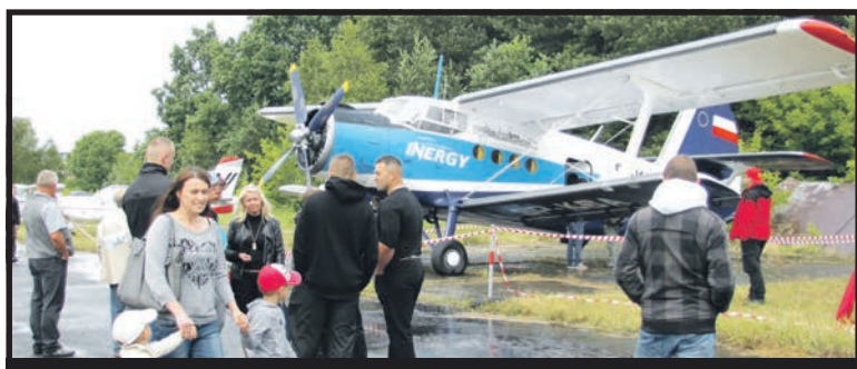
Jak przed rokiem białczanie tłumnie odwiedzili płytę lotniska