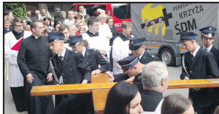
Wniesienie krzyża do Bazyliki Mniejszej w Parczewie