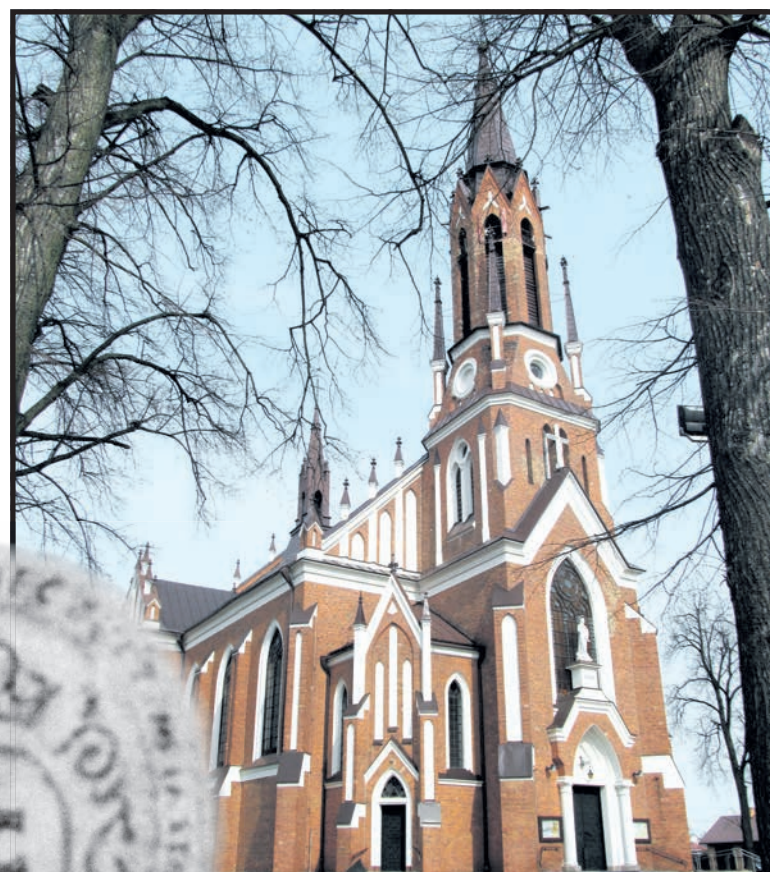
Kościół pw. św. Piotra i Pawła z początku XX wieku

że koegzystowało ze sobą wiele religii. Początki kościoła sięgają 1451 roku. Pierwotna budowla, podobnie jak inne budynki miasta, była zbudowana z drewna. Nie miała szczęścia parafia do swoich kościołów. W 1657 w czasie potopu szwedzkiego kościół spłonął, ponownie w 1783 i 1795 roku. W latach 1906 – 1911 powstał obecnie istniejący kościół murowany. Cechą miast było też istnienie w nich dużej społeczności żydowskiej, mających swoje synagogi-bożnice. Nie inaczej było w Łomazach. Społeczność prawosławna posiadała cerkiew. Po unii brzeskiej prawosławni przeszli do kościoła grekokatolickiego (unickiego). Z biegiem czasu Kościół Unicki zaczął się latynizować i przypominać kościół rzymskokatolicki, z drugiej strony zaś cerkiew po reformach Piotra I znacznie oddaliła się od pierwotnego prawosławia. To koegzystowanie religii przetrwało do roku 1875, gdy zlikwidowano ogólnie kościół unicki i nakazano przejście wiernych na prawosławie. Spotkało się to z oporem unitów. Ludność tego obszaru poddana została represjom, które znamy nie tylko z Pratulina czy Drelowa, ale i innych miejsc Podlasia. Szykany trwały ponad 40 lat. Nie pomogło władzy carskiej zbudowanie nowej murowanej cerkwi na rynku w 1903 roku (rozebrano ją w czasach II