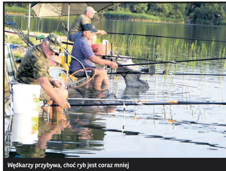
Wędkarzy przybywa, choć ryb jest coraz mniej

– Skierujemy pismo do komisji rewizyjnej zarządu głównego Polskiego Związku Wędkarskiego, aby jak naj-