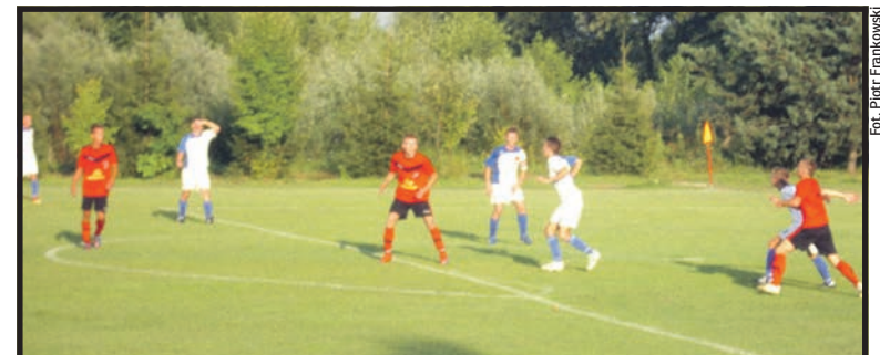
W przyszłym sezonie Lutnię Piszczac zobaczymy w klasie okręgowej

Z III ligi spadają: Hetman Zamość i Omega Stary Zamość, a z klas okręgowych awansują: Grom Kąkolewnica, Włodawianka, Czarni Dęblin i Krysz-