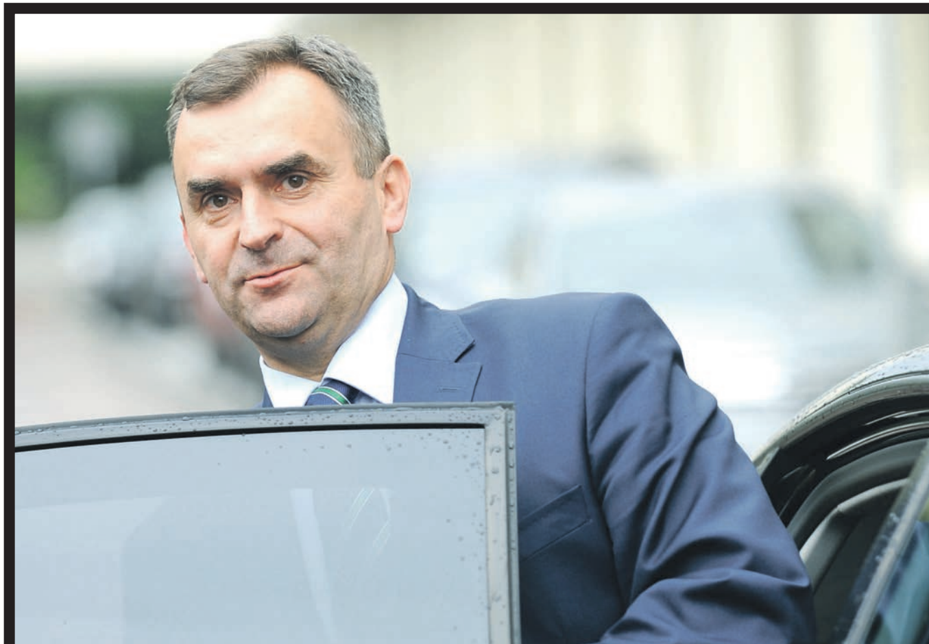
Lubelski baron PO - minister skarbu Włodzimierz Karpiński

„Ch... tam z tą Polską wschodnią” – stwierdził lubelski baron Platformy Obywatelskiej, minister skarbu Włodzimierz Karpiński. Tę i wiele innych skandalicznych wypowiedzi polityków tworzących obóz władzy ujawnił tygodnik „Wprost”. Słowa Karpińskiego, w ryszokowy sposób wyrażające pogardę dla miejsca, z którego pochodzi, mogą doprowadzić do jeszcze większego zamieszania w strukturach PO w województwie lubelskim i całkowitej marginalizacji tej partii w regionie. PODLASIE | 3