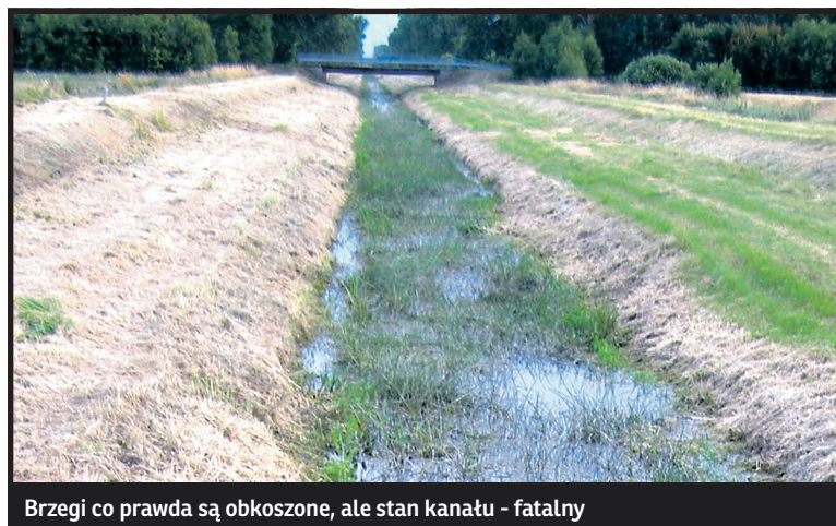
Brzegi co prawda są obkaszane, ale stan kanału - fatalny

Cóż z tego, że kanał w strategii rozwoju województwa lubelskiego uznany został „obszarem strategicznej interwencji”? Wciąż nie ma pieniędzy na jego rewitalizację, która powinna zacząć się dawno temu, bo o tym, że kanał w obecnym stanie po prostu szkodzi, wiadomo od lat. Może uda się pozyskać unijne środki, ale stanie się to już celem starań nowego samorządu. W tej