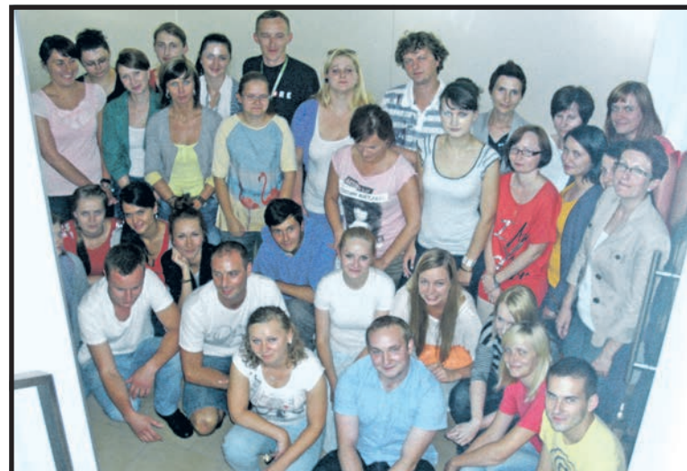
Pierwsi pracownicy Contact Center, którzy podjęli pracę w lipcu 2013 roku

Białskie Contact Center stało się jednym z ważniejszych pracodawców regionu. Do dziś zatrudnienie znalazło tam blisko 100 osób, a Biała Podlaska zyskała inwestora stawiającego na rozwój najnowocześniejszych technologii. Zaangażowanie Towarzystwa Finansowego SKOK na Południowym Podlasiu, obejmuje również sekcję programistyczną zajmującą się rozwojem oprogramowania oraz wsparciem IT. 3 lipca w siedzibie oddziału przy ul. Reformackiej 10 w Białej Podlaskiej odbędą się urodziny placówki. W ważnym dla regionu wydarzeniu wezmą udział zaproszeni goście, m.in. władze samorządowe, dostojnicy kościoła oraz lokalni przedsiębiorcy. Na pierwszych urodzinach nie zabraknie również przedstawicieli Fundacji senatora