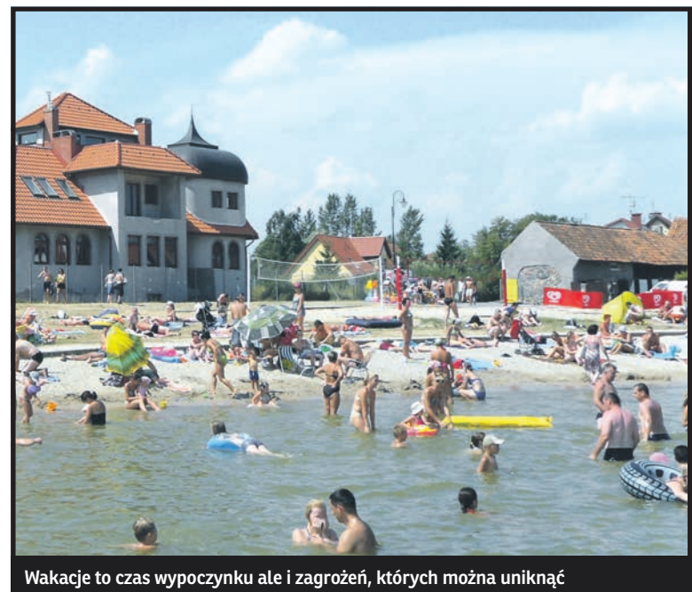
Wakacje to czas wypoczynku ale i zagrożeń, których można uniknąć

Wielu z nas wybierając się w wymarzoną podróż za granicę korzysta z własnego samochodu. W większości