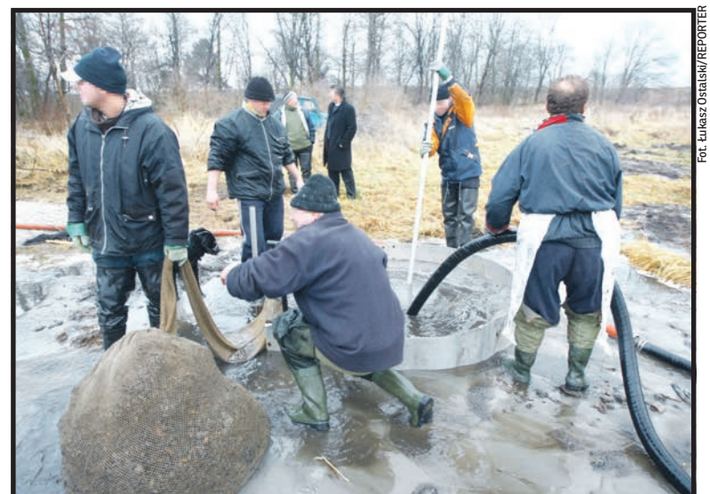
Płytko zlokalizowane złoża bursztynu eksploatują nie tylko koncesjonowani poszukiwacze

głębokościach uniemożliwiających konwencjonalną i najtańszą ich eksploatację: metodą odkrywkową bądź wypłukiwania.