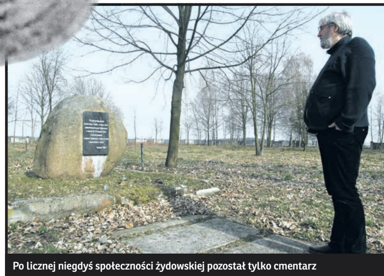
Po licznej niegdys społeczności żydowskiej pozostał tylko cmentarz

Rzeczypospolitej). W roku 1905 na mocy aktu tolerancyjnego pozwolono unitom wybierać pomiędzy prawosławiem a rzymskim katolicyzmem, ponieważ kościół unicki oficjalnie nie istniał w Rosji. Prawie wszyscy wybrali drugą opcję i stali się katolikami.