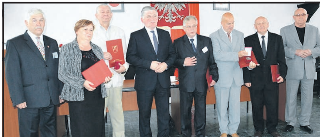
Lista odznaczonych wzbudziła konsternację opozycji