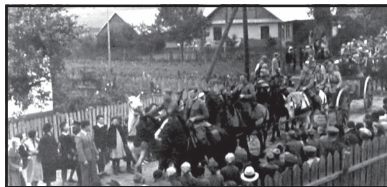
Mieszkańcy Janowa Podlaskiego pozdrawiają oddziały wracające z poligonu zza Buga

wyjawszy sytuacje oficjalne, zwykle zwracał się do podległych sobie oficerów po imieniu. Szczególna była dbałość o konie. Koń – weteran, który odbył kampanię 1920 roku i w okresie powojennym nie był już zdolny do służby, miał specjalne prawa: mógł chodzić samopas po terenie jednostki, nawet po trawnikach i rabatach kwiatowych.