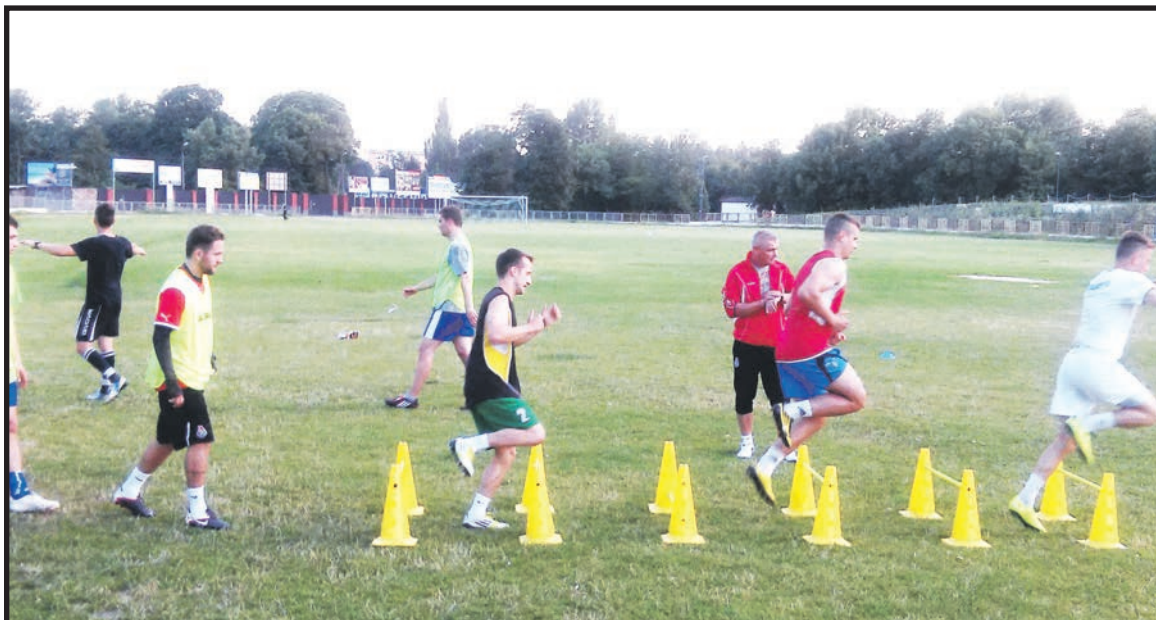
Podlasie wznowiło treningi