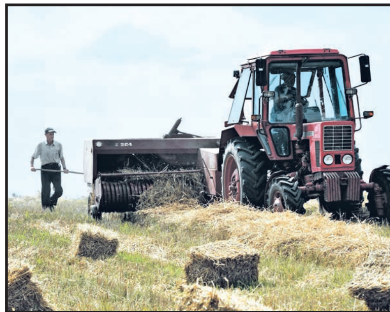
Tegoroczne żniwa zapowiadają się rekordowo. Rolnicy boją się niskich cen w skupach