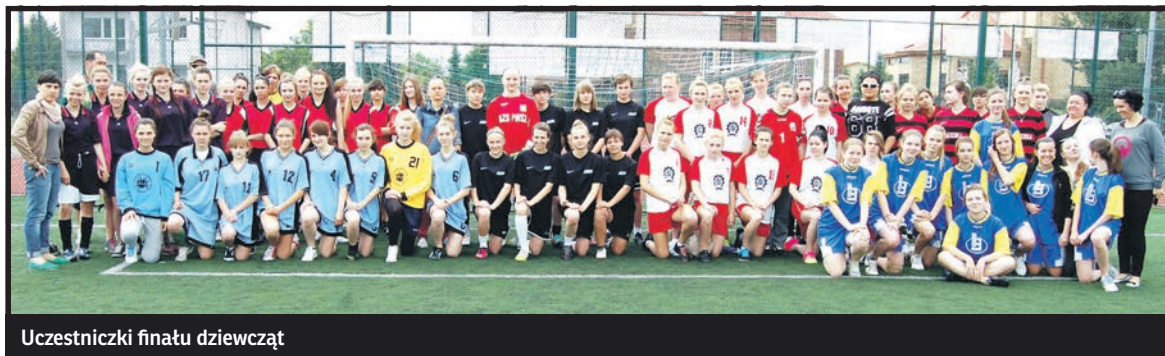
Uczestniczki finału dziewcząt