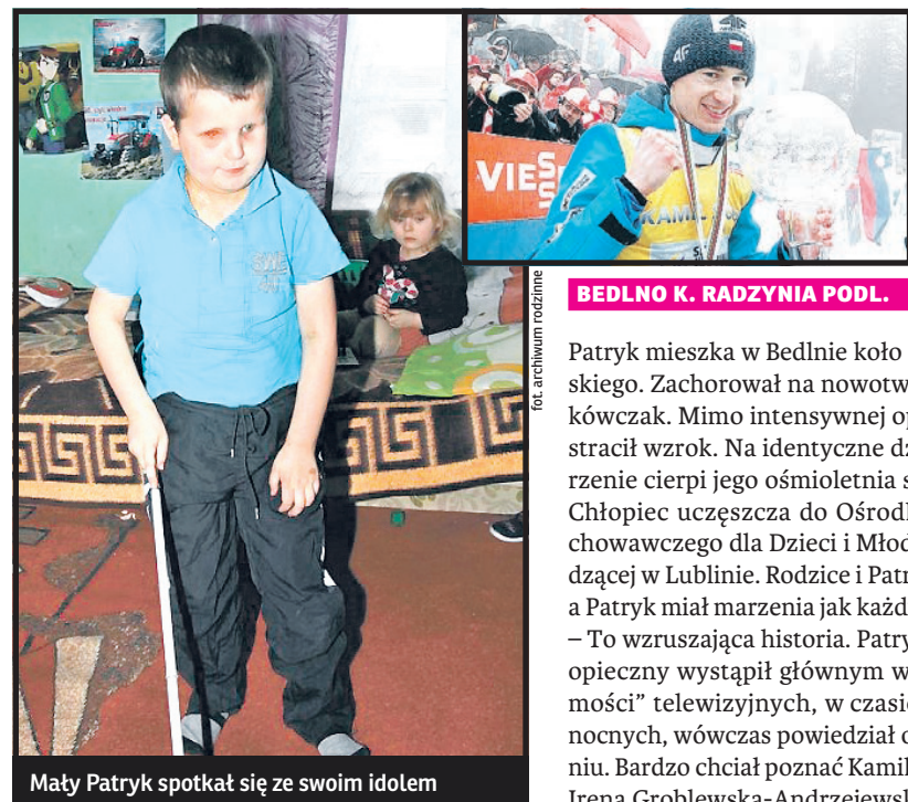
Mały Patryk spotkał się ze swoim idolem

Obecny rząd, mimo, iż resortem rolnictwa zarządzają ludzie z rzekomo „chłopskiego” PSL, wielokrotnie dawał przykłady kompletnego braku zainteresowania sprawami wsi. Niestety, ta fatalna postawa rządzących odbija się negatywnie na sytuacji dziesiątek tysięcy polskich rodzin. Problem jest szczególnie dotkliwy w regionach rolniczych, a takim jest nasze Południowe Podlasie. Zagrożenie związane z klęską urodzaju i importem zboża ze Wschodu jest kolejną sytuacją, gdzie niezbędne są szybkie reakcje i – przede wszystkim – odpowiednie zaplanowanie działań ze strony państwa. Tego nie widać, stąd moja interwencja. Będziemy naciskali na rząd, by przynajmniej tym razem stanął na wysokości zadania.