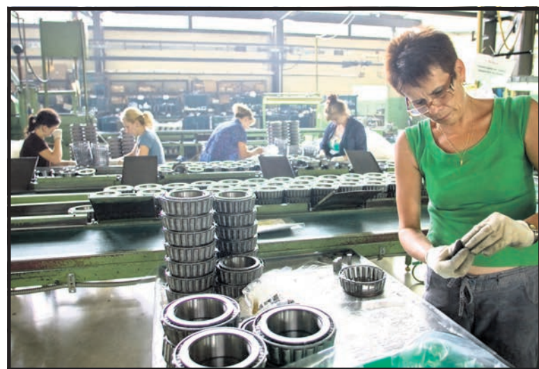
Nikt nie wie ile Chińczycy zapłacili za Fabrykę Łóżysk Tocznych w Kraśniku