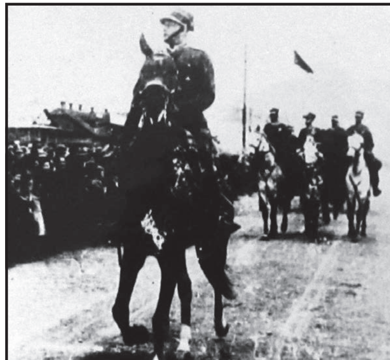
...oraz oddział konny 3 dywizjonu 9 PAL w Białej Podlaskiej

Żołnierze zawsze wychodzili do miasta w wyjściowych mundurach. Oficerowie byli wysportowani, a ci w starszym wieku i znaczniejszej tuszy – ukrywali ją nosząc gorset. Nie do pomyslenia był często spotykany po drugiej wojnie widok brzuchatego oficera z siatkami w rękach. Armia była symbolem nie tylko niepodległości, ale również elegancji oraz dobrych manier. Stąd wzięto się powiedzenie „za mundurem panny sznurem”. Często stosowana była niepisana zasada najlepszego kawalerzysty II Rzeczypospolitej, Bolesława Wieniawy Długoszowskiego, że wyższy stopniem salutuje żołnierzowi idącemu z kobietą pod rękę. Dowódca,