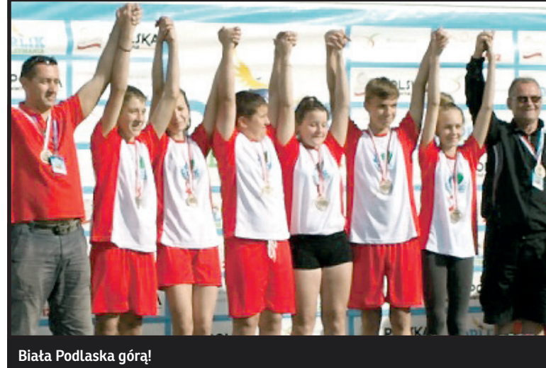
Biała Podlaska górami!

Cieszy mnie bardzo, że tak liczne grono Czytelników zauważyło brak mojego felietonu w dwóch ostatnich numerach Tygodnika Podlaskiego. Nie sposób poruszyć wszystkich tematów, których propozycje przesyłałicie mi Państwo w tym czasie. Dominuje wśród nich piłka nożna, o dziwo – z innej konstelacji