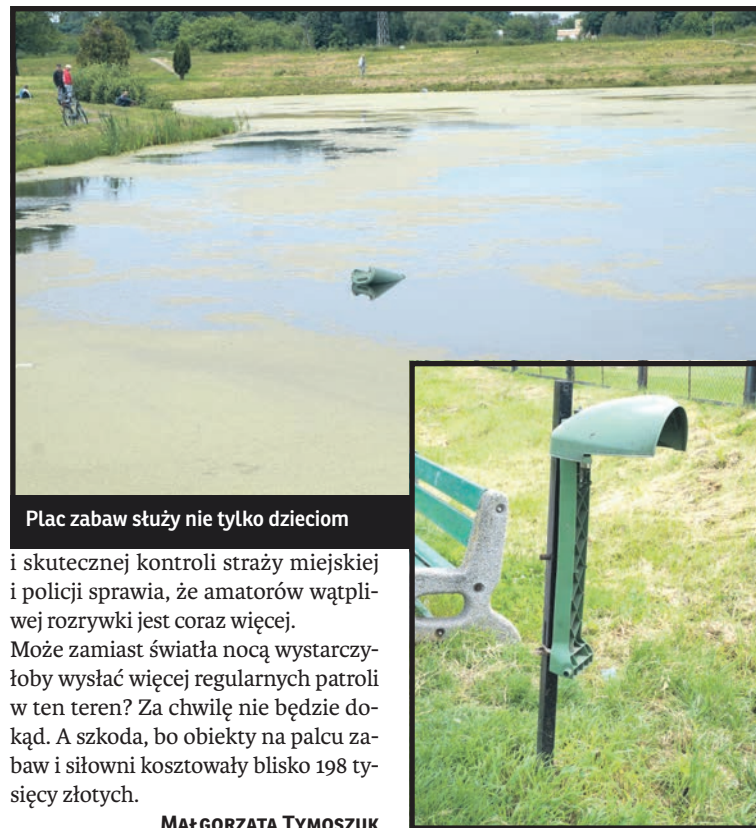
Plac zabaw służy nie tylko dzieciom

Istniejący od blisko roku plac zabaw i miejsce do ćwiczeń tuż przy targowisku miejskim przy Al. Tysiąclecia cieszy się ogromnym powodzeniem. Niestety, oprócz dzieci, które spędzają tu czas i uprawiających sport seniorów, bawią się tu świetnie również wandale. Nie przeszkadza im do tej pory brak oświetlenia. Po godz. 20.00 tylko co druga latarnia była włączona. Na sesji Rady Miasta wprowadzono poprawkę do budżetu miasta i w efekcie plac będzie oświetlony również nocą. Miasto postanowiło wydać na ten cel 35 tysięcy złotych. Kto korzysta nocą z siłowni? Lepsza widoczność przyda się z pewnością imprezowiczom, którzy nawet w ciągu dnia zajmują dogodne miejsce pod zadaszeniem, tuż przy placu zabaw dla dzieci i doskonale się bawią. Dowodem są akty wandalizmu i porzucane butelki po alkoholu, plastikowe kubki i opakowania po przekąskach. Zniszczone są kosze na śmieci, a stan pobliskiego stawu, do którego wrzucane jest wszystko co pod ręką, pogarsza się z dnia na dzień. Brak systematycznej