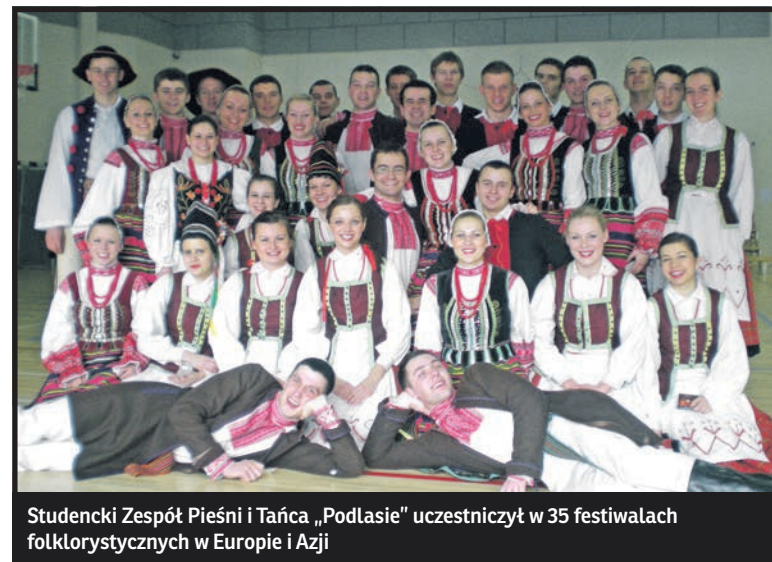
Studencki Zespół Pieśni i Tańca „Podlasie” uczestniczył w 35 festiwalach folklorystycznych w Europie i Azji

Choć zespół posiada imponujący dorobek artystyczny wciąż opracowuje nowe układy choreograficzne i posze-