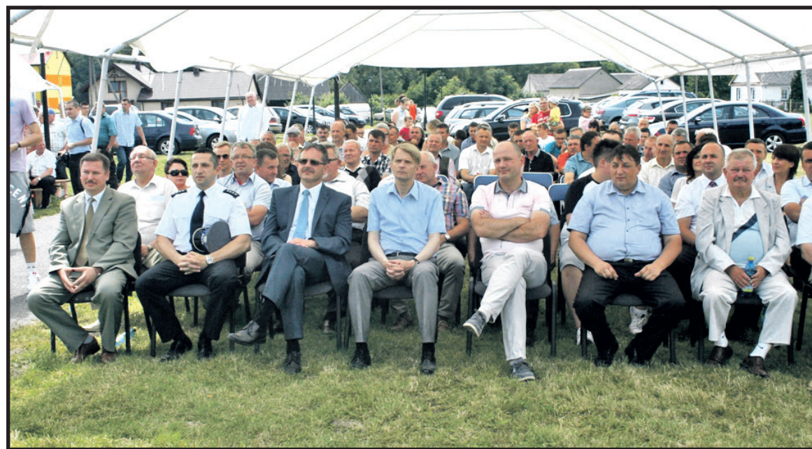
Uczestnicy V Gali BOZPN