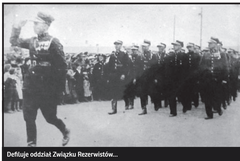
Defluje oddział Związku Rezerwistów...

Orkiestra wojskowa nie tylko uczestniczyła w procesjach Bożego Ciała, ale i występowała z koncertami mu-