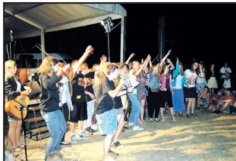
W ubiegłym roku Misjonarze Oblaci gościli 550 młodych ludzi

ników Festiwalu – w poniedziałek 21 lipca w Kodniu od godz. 9.00. Więcej informacji można znaleźć na stronie: www.festiwalzycia.pl