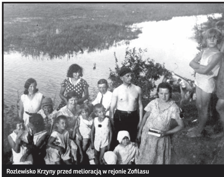
Rozlewisko Krzny przed melioracją w rejonie Zofilasu