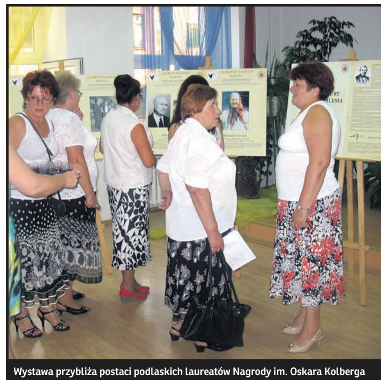
Wystawa przybliża postaci podlaskich laureatów Nagrody im. Oskara Kolberga