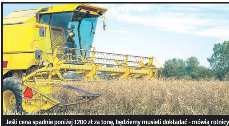
Jeśli cena spadnie poniżej 1200 zł za tonę, będziemy musieli dokładać – mówią rolnicy

O spowodowanym „kłęską urodzaju” i bezcłowymi kontyngentami problemie spodziewanych niskich cen zbóż pisaliśmy już tydzień temu. Senator Grzegorz Bierecki wydał w tej sprawie oświadczenie skierowane do ministra rolnictwa Marka Sawickiego. Pytał w nim, czy Polska jest przygotowana do skupu płodów rolnych w tak niesprzyjających warunkach, chciał się też dowiedzieć, jak na ceny skupu wpłynie import zbóż ze Wschodu oraz co zrobi rząd, by ceny te ustabilizować. Potrzebne są na-