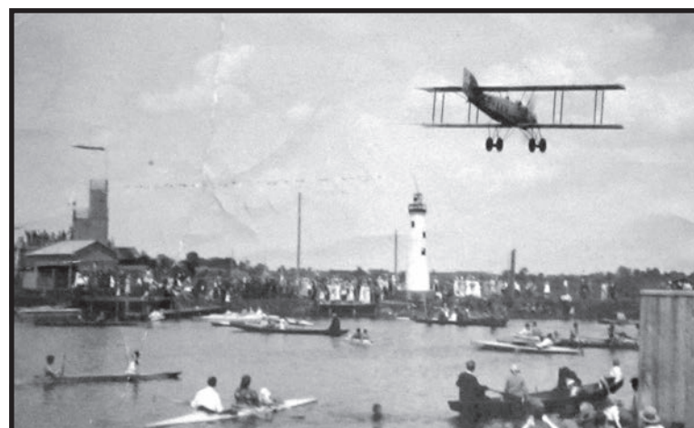
Od 1937 roku nie widziano na Krznie tylu łodzi i kajaków