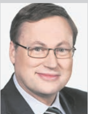
Senator Grzegorz Bierecki

Zadłużanie się za granicą, niezależnie od formy, niesie ze sobą wielkie ryzyko. Jeśli polskie państwo jest dłużnikiem, zagraniczny wierzyciel ma potężne narzędzie wpływu na decyzje podejmowane przez rządzących. Powiększanie tego długu prowadzi do ograniczenia niezależności naszej Ojczyzny. Moim zdaniem powinniśmy iść w zupełnie innym kierunku. Obligacje mogą przecież być nabywane przez polskie podmioty a odsetki od nich – wypłacane Polakom. Dzięki temu nie tylko państwo będzie bezpieczniejsze, ale też pobudzimy rodzimą gospodarkę, stworzymy nowe miejsca pracy. Na tym właśnie polega patriotyzm gospodarczy, którego tak bardzo potrzebujemy. Szkoda, że obecny rząd tego nie rozumie.