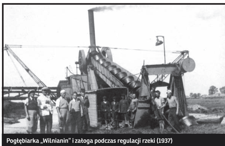
Pogłębiarka „Wilnianin” i załoga podczas regulacji rzeki (1937)