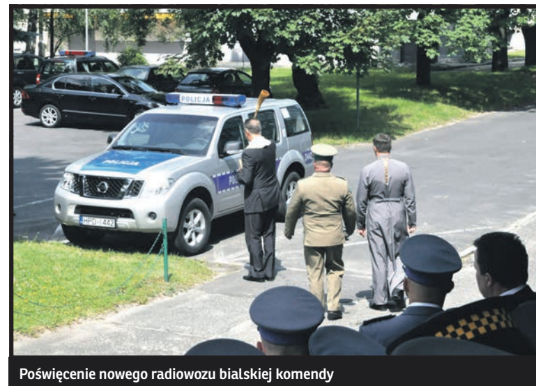
Poświęcenie nowego radiowozu białskiej komendy