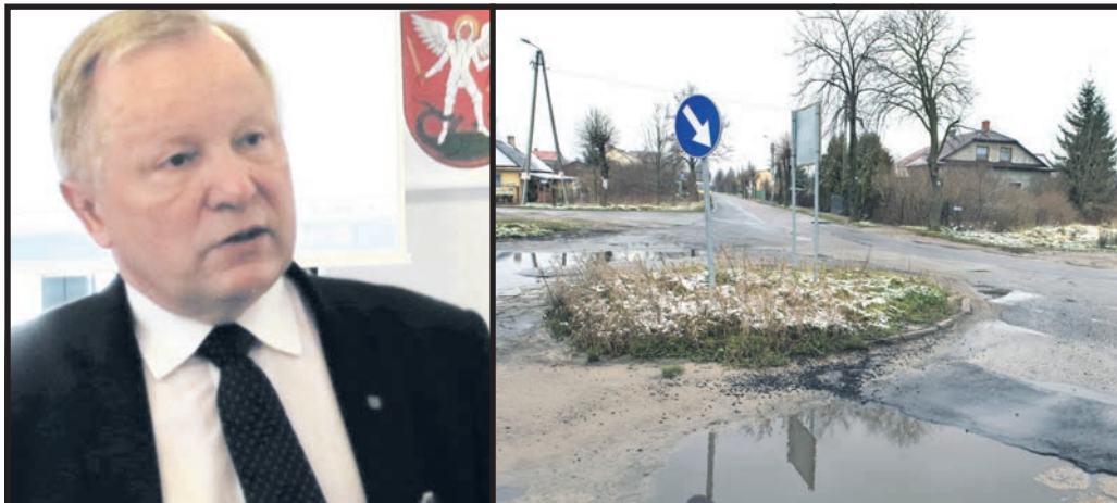
Zdaniem prezydenta Czapskiego celowe jest przekierowanie części środków przeznaczonych np. na drogi na polepszenie jakości życia mieszkańców Białej Podlaskiej „w wymiarze emocjonalnym”

Czy rzeczywistość Białej Podlaskiej można rzeczywiście kreślić w tak różowych barwach? Czy jedynym problemem miasta jest dziś brak miejsc do spacerów?