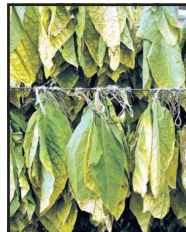
Polska jest drugim co do wielkości producentem tytoniu

Rząd PO-PSL zamierza skarżyć więc dyrektywę do Europejskiego Trybunału Sprawiedliwości. Problem w tym, że podczas lutowego głosowania w PE cała delegacja posłów Platformy i PSL-u głosowała za szkodliwą dyrektywą. Jedynym,