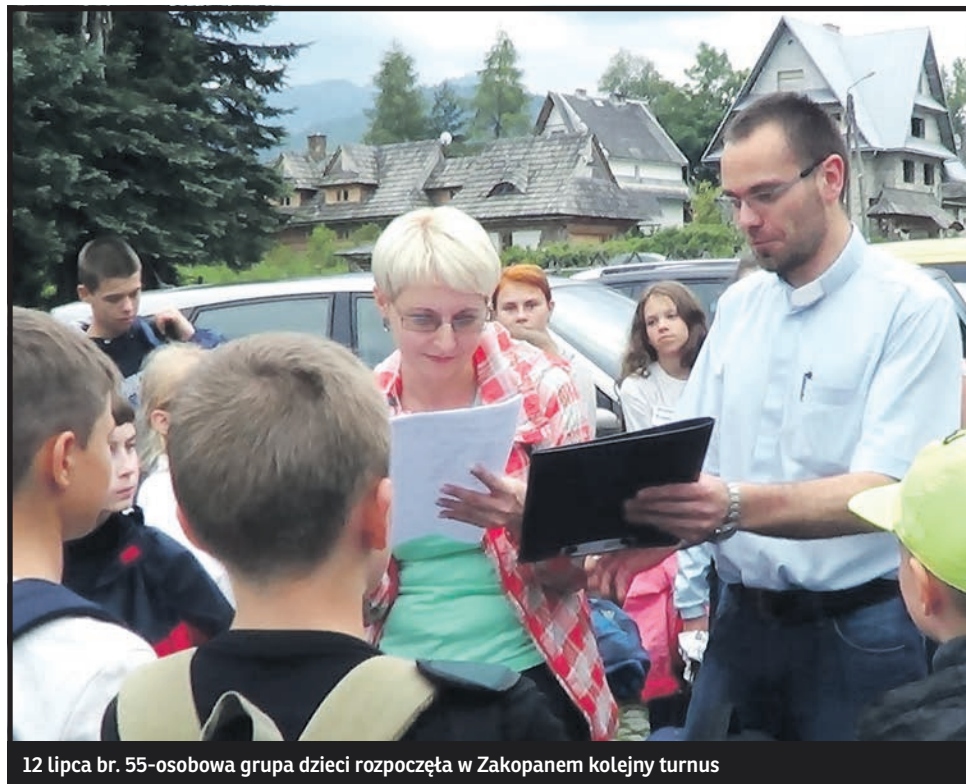
12 lipca br. 55-osobowa grupa dzieci rozpoczęła w Zakopanem kolejny turnus