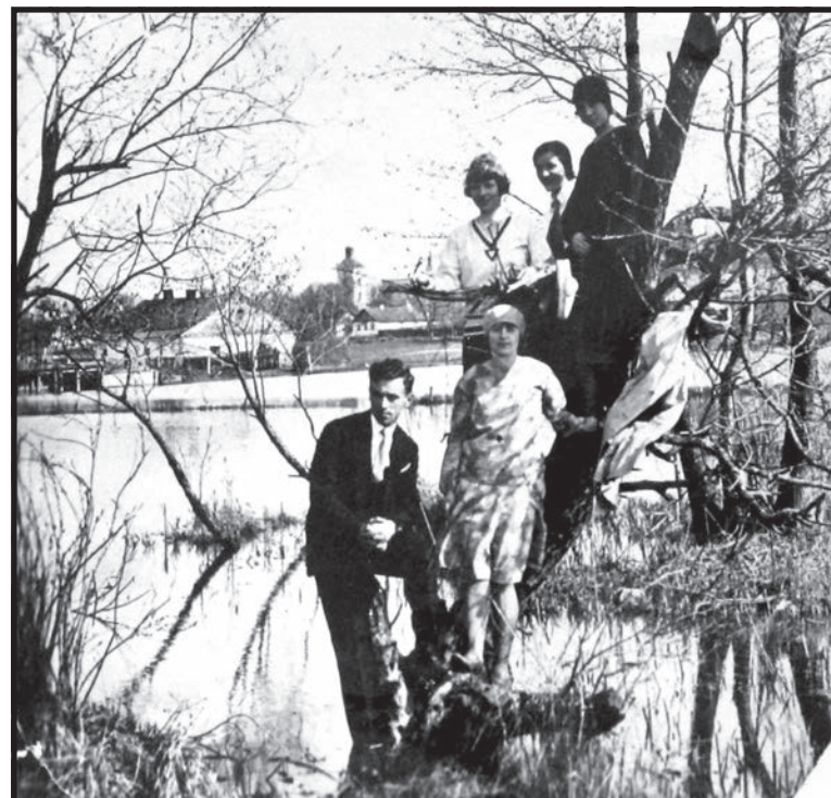
Rozlewisko Krzny przed regulacją; widok na wieżę zamkową z dzielnicy Wola