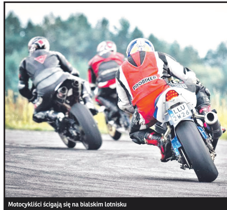
Motocykliści ścigają się na białskim lotnisku

szym patronatem. Wszystkich fanów wyścigów motorów zapraszamy o godz. 16 na białskie lotnisko.