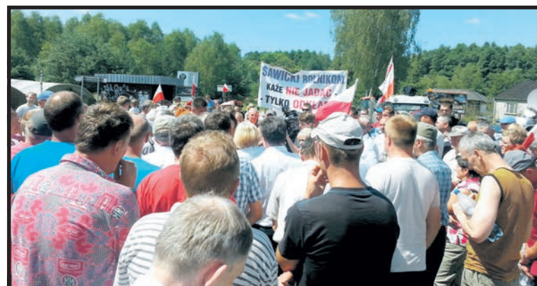
Rolnicy protestują przeciwko niskim cenom produktów rolnych