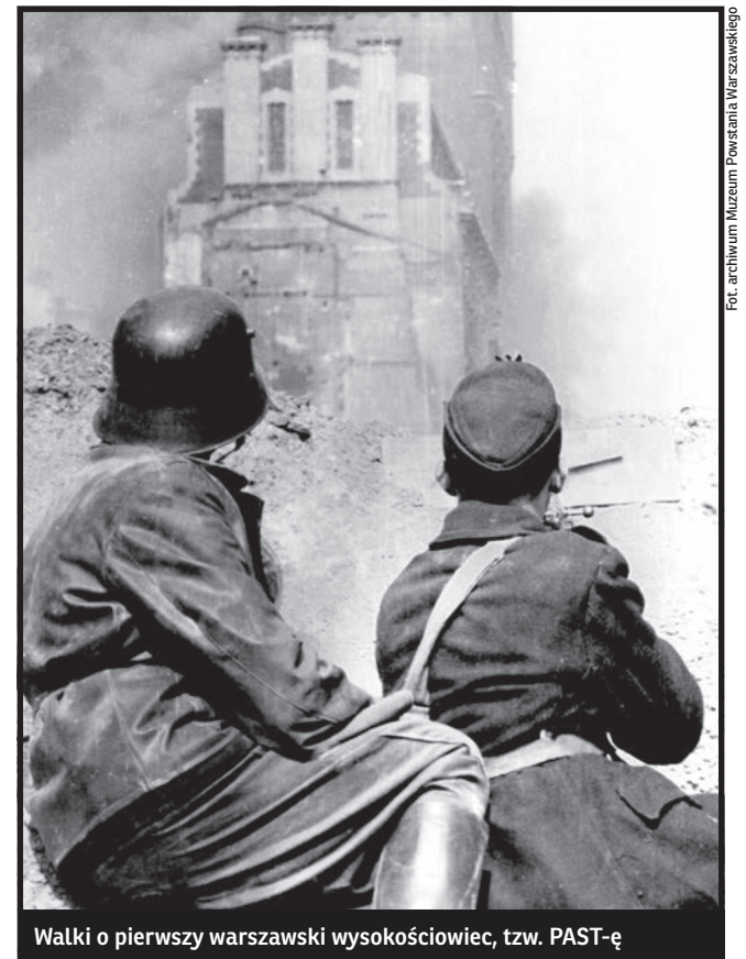
Walki o pierwszy warszawski wysokościowiec, tzw. PAST-ę

Co roku w przeddzień rocznicy Powstania Warszawskiego rozpoczynamy dyskusję o jego celowości. Według mnie – niezależnie od końcowej oceny – powstańcom należy się nasz szacunek. Choć obecnie nie robimy tego zbyt często, w tym przypadku powinniśmy brać pod uwagę intencje, a nie tylko efekty jakie osiągnęło powstanie. Klęska powstania w niczym nie umniejsza odwagi i poświęcenia jego uczestników.