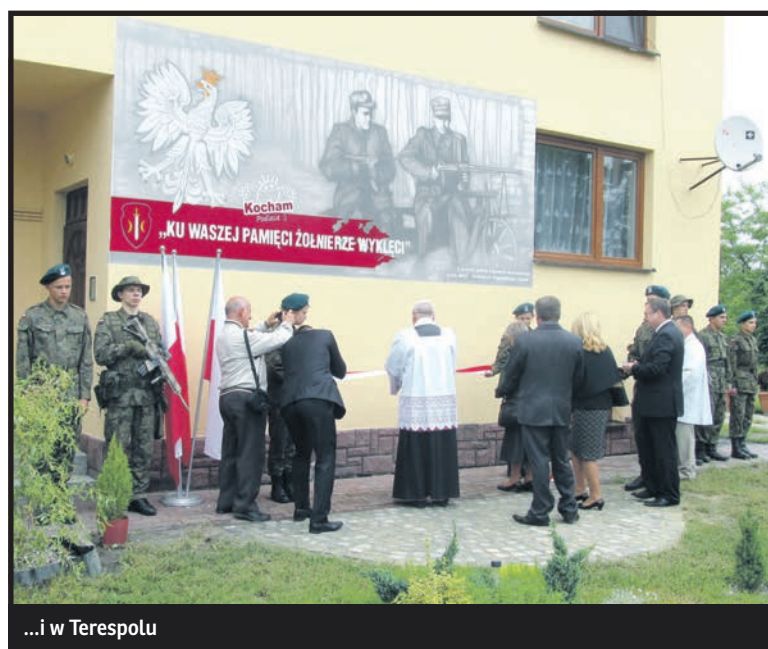
...i w Terespolu