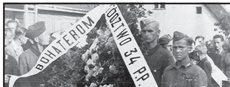
Uroczystości pogrzebowe zamordowanych przez gestapo. Biała Podlaska, początek sierpnia 1944 rok