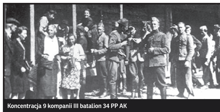
Koncentracja 9 kompanii III batalion 34 PP AK

opatrzenie głównych sił niemieckich. Okręg zmobilizował około 12 tysięcy ludzi. Jednocześnie gotowość osiągnęły szeroko rozbudowane struktury przysługowej administracji Delegatury Rządu. O skali przedsięwzięcia najlepiej świadczy fakt, że Armia Krajowa na Lubelszczyźnie samodzielnie wyzwoliła m.in. Bełżec, Lubartów, Kock, Firlej, Krasnystaw, Urzędów i Poniatową. Wspólnie z jednostkami sowieckimi wyzwolono: Tomaszów Lubelski, Puławy, Chełm, Radzyń, Międzyrzec, Zamość i Białą Podlaską.