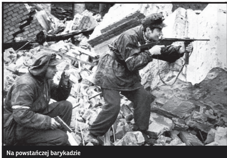
Na powstańczej barykadzie

niemieckich magazynów wojskowych na Stawkach pełnych mundurów i żywności. Do walki wkraczają oddziały składające się z kryminalistów i bandytów (brygada SS Dirlewangera) oraz kolabo-