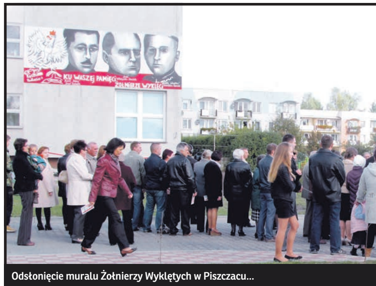
Odstonięcie muralu Żołnierzy Wyklętych w Piszczacu...