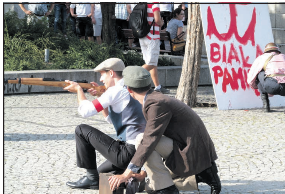
2013 - obchody 69 rocznicy Powstania Warszawskiego na białym Placu Wolności