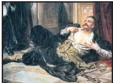
Tadeusz Reytan popełnił samobójstwo, a Samuel Korsak – zginął w czasie Insurekcji Kościuszkowej.

W rok po I rozbiorze przedstawiciele zaborców zwołali do Grodna Sejm Rozbiorowy, którego rolą było wyrażenie przez posłów i senatorów Rzeczypospolitej zgody na rozbiór ojczyzny. Zdecydowana większość – przekupiona przez zaborców – zaakceptowała wszystkie postanowienia, napisane z góry w Moskwie, Wiedniu i Berlinie. Raptem kilkunastu było przeciw. A jakie były późniejsze losy patriotów i jurgielników? Symbolizują je dzieje trzech z nich. Stojący na czele opozycji