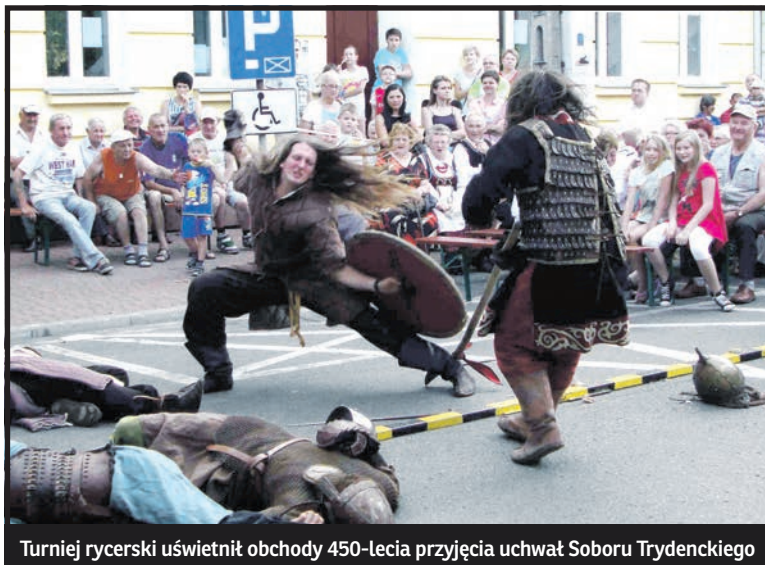
Turniej rycerski uświetnił obchody 450-lecia przyjęcia uchwał Soboru Trydenckiego

Na Placu Wolności odbył się festyn historyczny „Parczew – historia i tradycja” połączony z Jarmarkiem Jagiellońskim. Ponad dwudziestu wystawców w królewskim mieście prezentowało swoje wyroby m.in. tkackie, garncarskie i wikliniarskie. Każdy mógł spróbować swoich sił w strzelaniu z łuku bądź wybić wła-