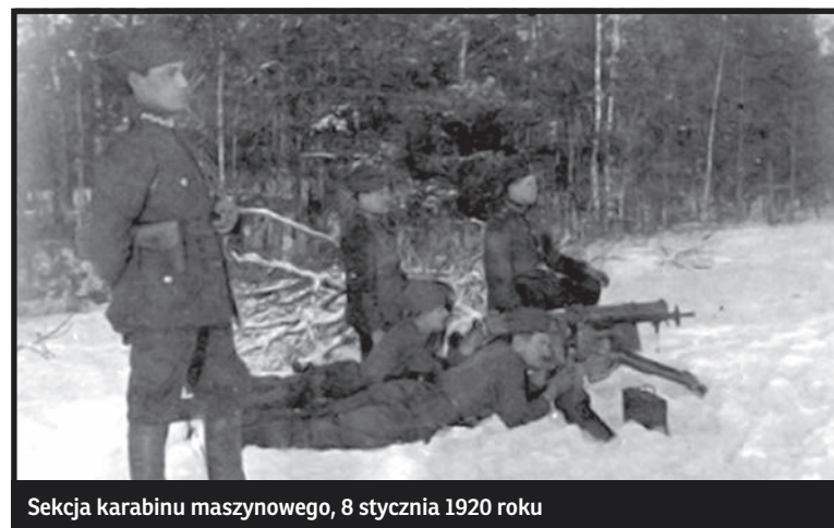
Sekcja karabinu maszynowego, 8 stycznia 1920 roku

W kraju wobec realnego zagrożenia powołano Radę Obrony Państwa, Rząd Obrony Narodowej i Armię Ochotniczą.