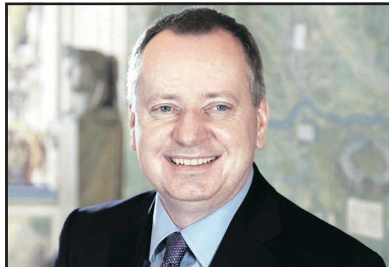
Przemysław Häuser – reżyser, scenarzysta, producent filmowy

cone będą jesienią w pokrzyżackim zamku w Gniewie nad Wisłą – niestety, zamek sapieżyński nie dotrwał do naszych czasów. Jeszcze nie wiadomo, kto wystąpi w głównych rolach.