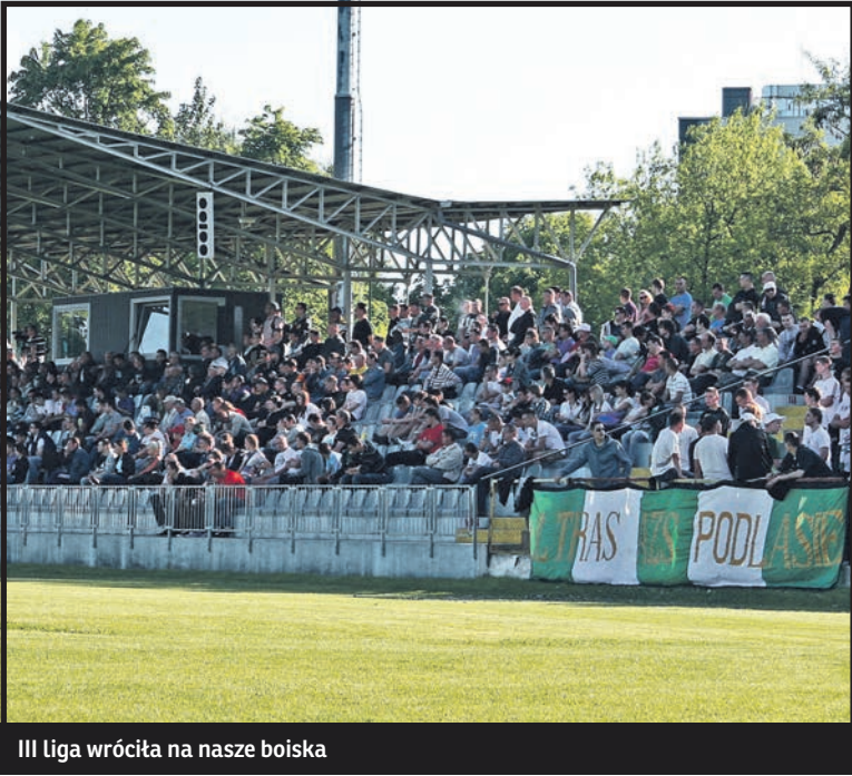
III liga wróciła na nasze boiska