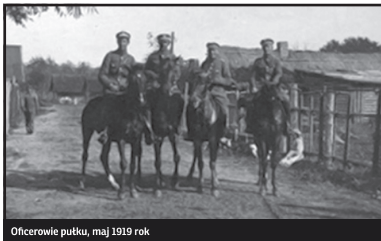
Oficerowie pułku, maj 1919 rok