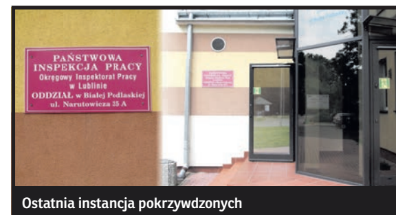
Ostatnia instancja pokrzywdzonych

Grzegorz Domański po 5 tygodniach od zgłoszenia się in-