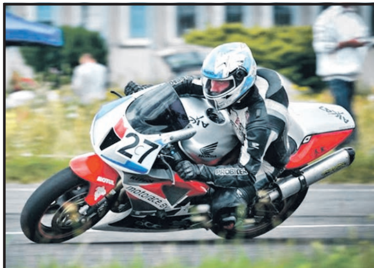
17 sierpnia odbędzie się kolejna runda Pucharu Superbike

natem. Wszystkich fanów wyścigów motorów zapraszamy w niedzielne popołudnie na białskie lotnisko.