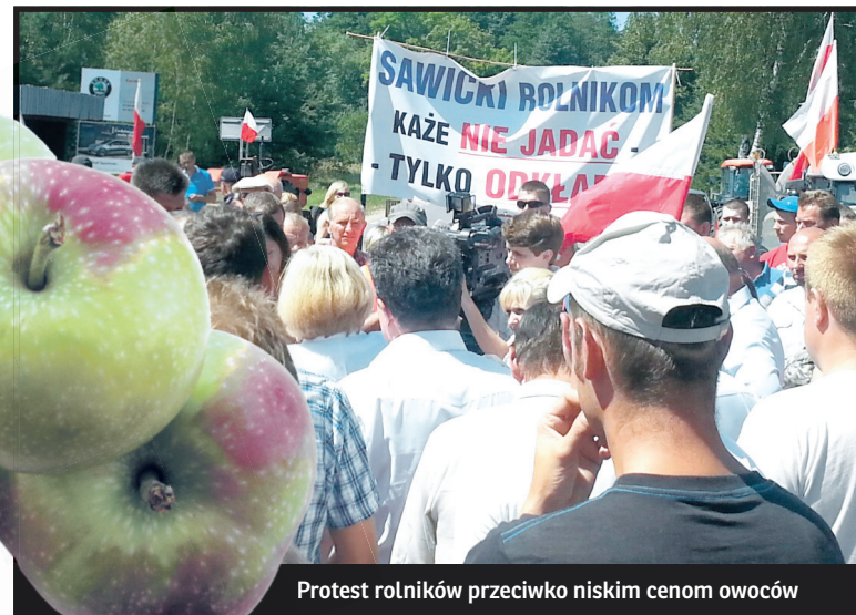
Protest rolników przeciwko niskim cenom owoców

pl podlaski senator Prawa i Sprawiedliwości Grzegorz Bierecki. Nasz parlamentarzysta przedstawił pomysł, dzięki któremu widmo natychmiastowej spłaty zaciągniętych zobowiązań przestałoby spędzać sen z powiek rolnikom pozostawionym bez pieniędzy przez rosyjskie embargo. Skorzystaliby z niego także przedsiębiorcy związani z branżą, na przykład właściciele firm transportowych, którzy ponoszą teraz ogromne straty. Grzegorz Bierecki odwołał się do sposobu myślenia zawartego w ustawie o powszechnym obowiązku obronnym. Żołnierz powołany do służby czynnej nie musi w tym czasie spłacać zaciągniętych kredytów,