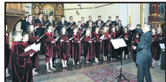
Udział w dwóch festiwalach to lipcowy plon chóru SCMC

Ta niezwykła liczba utworów przygotowanych do zaśpiewania w każdej chwili, wzbudziła ogromny podziw organizatorów i publiczności. No i przede wszystkim jakość wykonania! Idealnie czysta intonacja, różnicowanie barw w zależności od