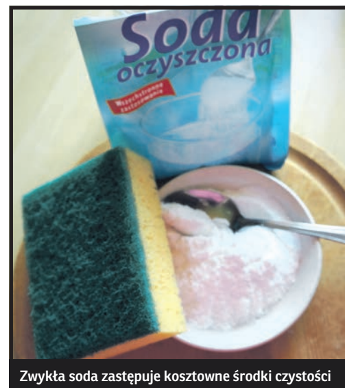
Zwykła soda zastępuje kosztowne środki czystości