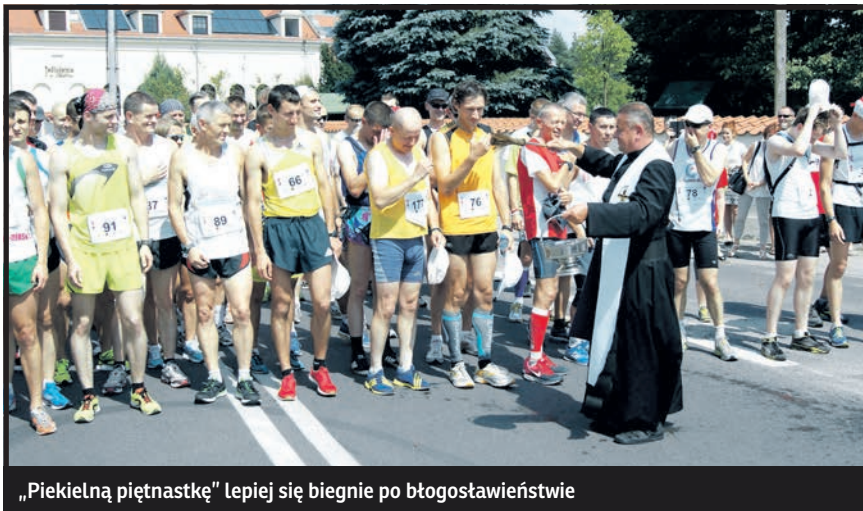
„Piekielną piętnastkę” lepiej się biegnie po błogostawieństwie

„Piekielna piętnastka” – taki nieoficjalny przydomek ma kodoński bieg – służy również popularyzacji czynnego wypoczynku wśród dzieci i dorosłych, połączonego z poznawaniem bogatej kultury regionu pogranicza, wspaniałych zabytków, a nade wszystko – nieskażonej nadbużańskiej przyrody. W przyszłym roku na pewno spotkamy się po raz szesnasty, bo w Kodniu już szykują kolejną edycję tych zawodów.