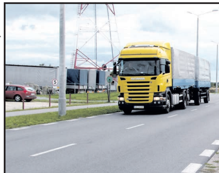
Do przebudowy Al. Solidarności podatnicy z Białej Podlaskiej będą musieli dopłacić 350 tys. zł