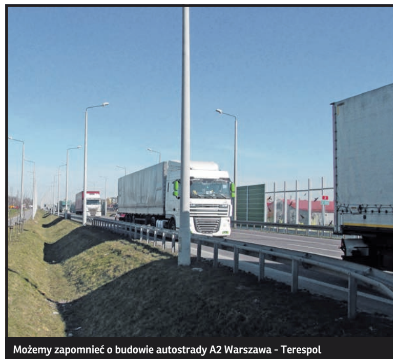
Możemy zapomnieć o budowie autostrady A2 Warszawa - Terespol

Zapowiedź posła PO wybudowania do 2017 roku niespełna dwudziestokilometrowego łącznika autostradowego A2 uruchomionej w 2012 roku obwodnicy Mińska Mazowieckiego z trasą S2 – południową obwodnicą Warszawy to kolejny w ostatnich miesiącach sygnał w spra-