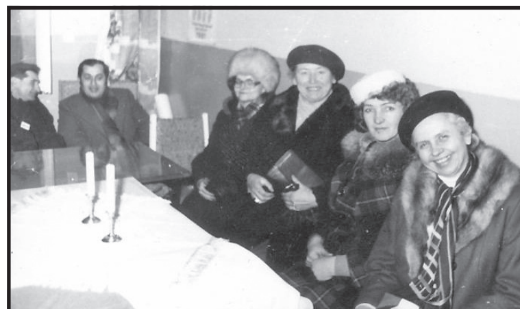
Poświęcenie pierwszego lokalu NSZZ Solidarność w Międzyrzec Podlaskim.

ponownie uaktywniły się na przełomie sierpnia i września, gdy oczy całej Polski skierowane były na Stocznę Gdańską.