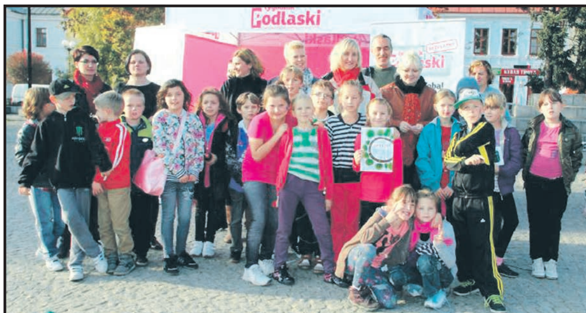
W 2013 roku, podobnie jak rok wcześniej, zwyciężyła klasa III a z SP nr 4 (3212 kg zgromadzonej makulatury)