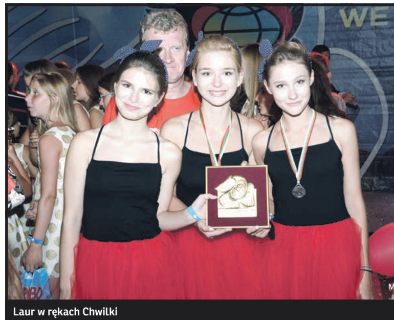
Laur w rękach Chwilki

ograficzną odpowiadała Anna Bajak. – Czyste głosy, umiejętnie dobrany repertuar, wspaniałe kreacje i sposób poruszania się na scenie: wszystkie te elementy stanowiły idealną całość. Za-