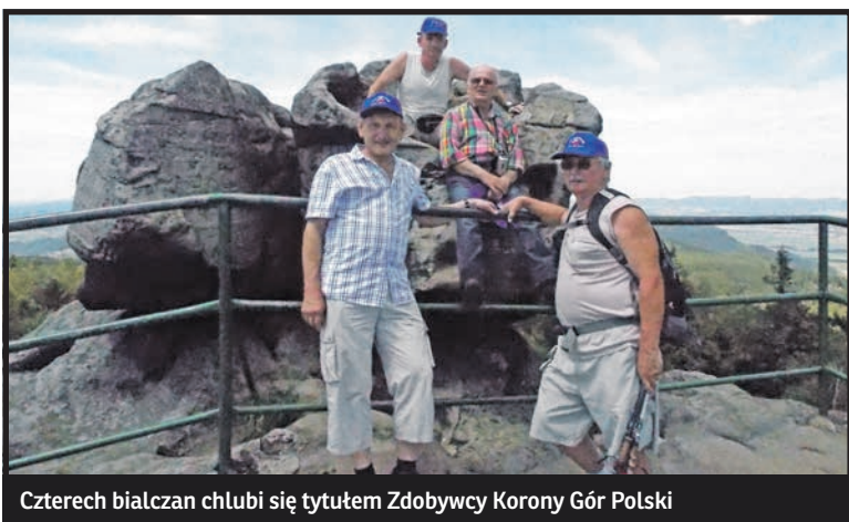
Czterech bialczan chlubi się tytułem Zdobywcy Korony Gór Polski