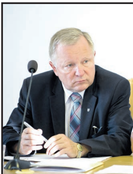
Niewesoła mina prezydenta Andrzeja Czapskiego

Oficjalnie pieniądze zostaną potrącone z kwoty przeznaczonej na realizację projektu „Przebudowa Alei Solidarności wraz z budową mostu i łącznika do ul. Sidorskiej w Białej Podlaskiej”. Oznacza to, że inwestycja ta będzie droższa właśnie o 350 tysięcy złotych.