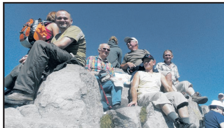
Sposób na emeryturę – wycieczki po najciekawszych zakątkach polskich gór

– Każdą wyprawę starannie planujemy, omawiamy każdy jej szczegół – mówi