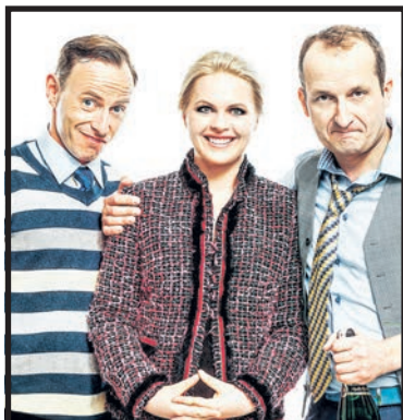
Rafał Zbieć, Magdalena Strużyńska-Brauer i Robert Górski

Kabaret Moralnego Niepokoju, Kabaret Skeczów Męczących oraz Kabaret Nowaki będą bawić białczan w niedzielę 21 września od godz. 16 w białskim amfiteatrze (ul. Warszawska 11). Czy przebiją Jana Pietrzaka, który wraz z Kabaretem Pod Egidą oraz Kabaretem KaŁa-Masz wystąpił na białskiej scenie przed rokiem? Organizatorami tegorocznego wydarzenia są jak w ubiegłym roku: Fundacja „Kocham Podlasie”, Kasa Stefczyka oraz Apella S.A. Impreza odbędzie się pod patronatem honorowym senatora Grzegorza Biereckiego. Patronat medialny objęły Katolickie Radio Podlasie oraz Tygodnik Podlaski. Bilety na biański „Kabareton” (w cenie