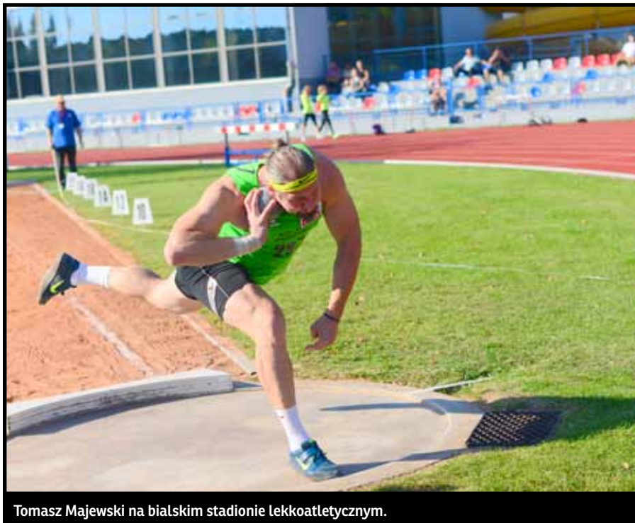
Tomasz Majewski na białskim stadionie lekkoatletycznym.