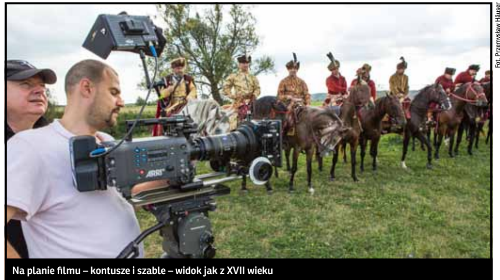
Na planie filmu – kontusze i szable – widok jak z XVII wieku