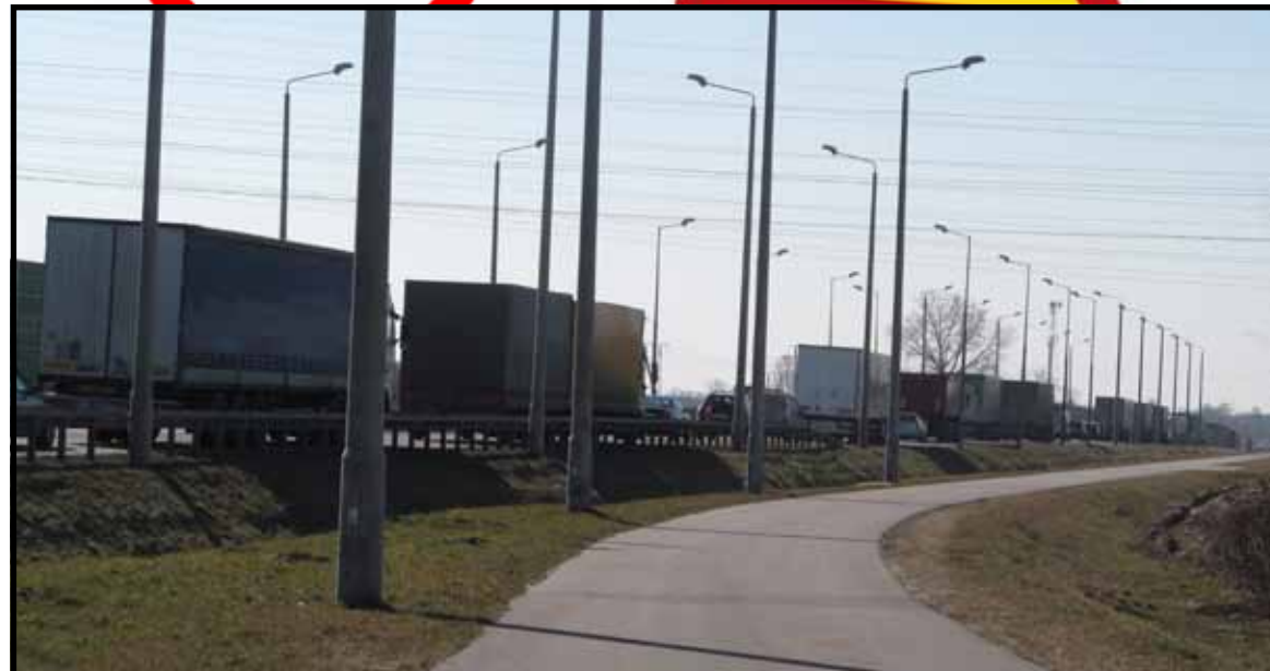
Zdaniem rządu intensywność ruchu na trasie nr 2 jest za mała, by budować autostradę przechodzącą przez Białą Podlaską