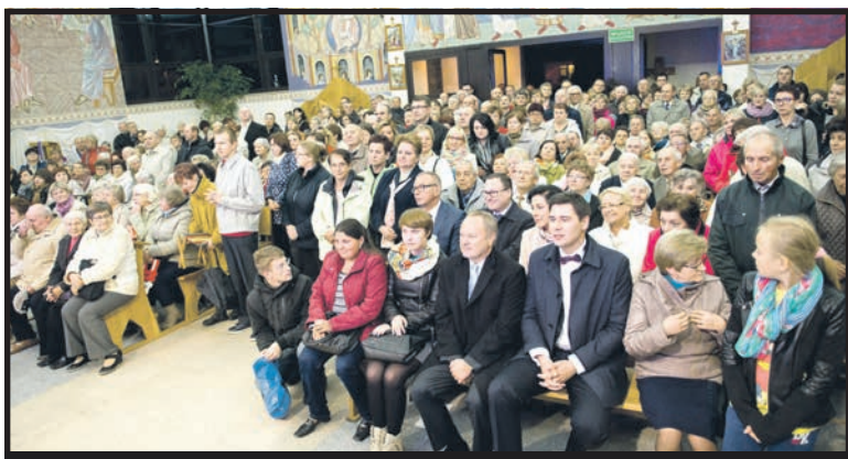
Pierwszy publiczny pokaz filmu miał miejsce tuż po premierze, w białkim kościele pw. św. Michała Archanioła