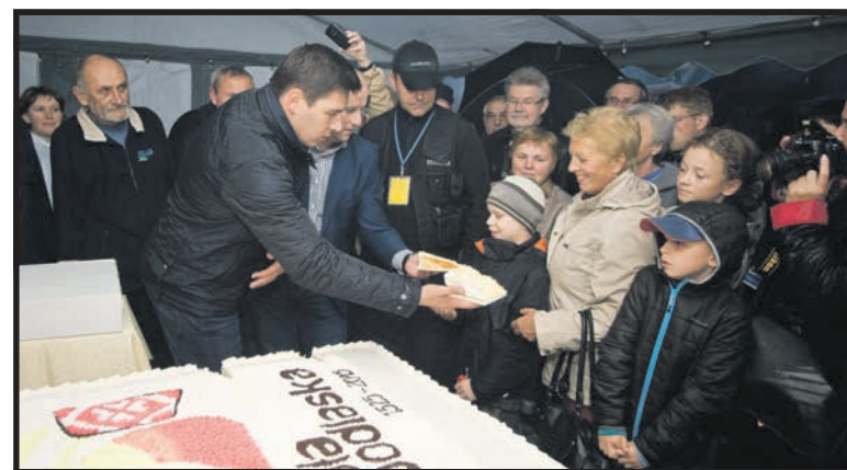
Białczanie, którzy nie przestraszyli się ulewnego deszczu, doczekali się wieczorem podwójnej nagrody. Najpierw pojawił się olbrzymi, urodzinowy tort, a potem rozeszły się ciemne chmury i przestało padać

Wileńskiej Brygady AK, zamordowanej przez UB). Białczanie, którzy mimo ulewnego deszczu stawili się na koncert mieli podwójną nagrodę. Koncert był znakomity, a w jego trakcie – przestało padać. Temperamentem estradowym impono-