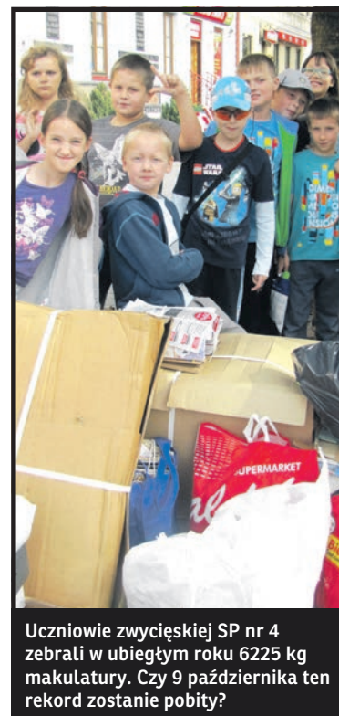
Uczniowie zwycięskiej SP nr 4 zebrali w ubiegłym roku 6225 kg makulatury. Czy 9 października ten rekord zostanie pobity?

Drobną formą rekompensaty najmłodszym za poniesiony trud będzie – jak zwykle – plac zabaw. Nie zabraknie dmuchanego zamku i zjeżdżalni, przejazdów bryczką oraz konkursów i zabaw z Wrózką. Dla przedszkoli i szkół, które makulatury dostarczą najwięcej, przewidzieliśmy wartościowe nagrody. Do zobaczenia 9 października na Placu Wolności!