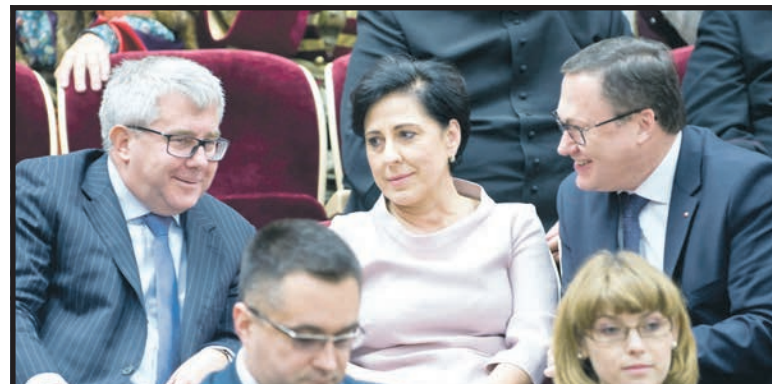
Ryszard Czarnecki po premierowym pokazie „Błogostawionej winy”: „Powstał ważny, potrzebny, a co najważniejsze dobry film o tematyce religijnej”

– Jako historyk muszę przypomnieć, że Polska podobnie jak kraje bałtyckie i kraje Grupy Wyszehradzkiej nigdy nie miała żadnych kolonii. Tymczasem państwa, które dzisiaj nas szantażują przez wieki budowały swoją potęgę ekonomiczną na wyzysku kolonialnym. Jeżeli dzisiaj historia każe im płacić odsetki od tych zysków, to jest to problem tych państw, a nie Polski. Tu objawia się hipokryzja Zachodu a także potworna słabość naszej władzy, która godzi się na wszystko, co jest zgodne z interesem