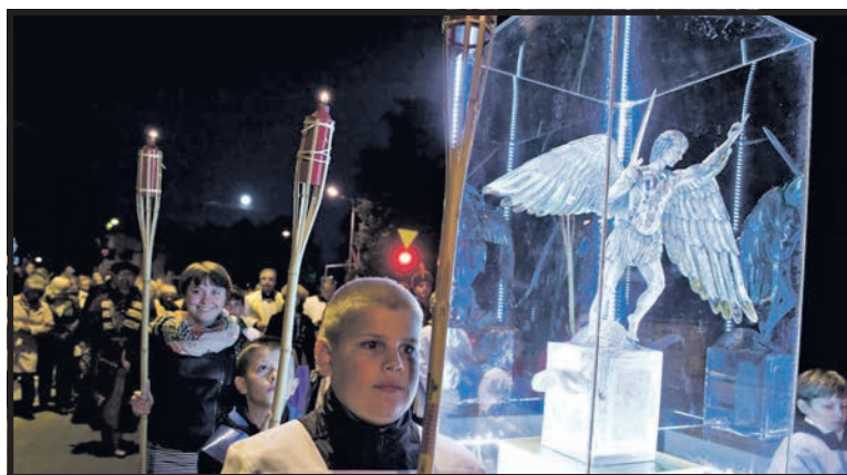
Obchody wrześniowego oficjalnego święta Białej Podlaskiej, zwłaszcza w 490. rocznicę narodzin miasta nie mogły się obyć bez złożenia na hołdu patronowi św. Michałowi Archaniołowi