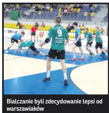
Białczanie byli zdecydowanie lepsi od warszawiaków

Trójka – AZS UW 24:30 Czarni – Szczypiorniak 22:20 Wieluń – Pabiks 33:23 Mazur – CHKS 31:19 Anilana – Włóknierz 29:15 AZS UMCS – Uniwersytet 31:38