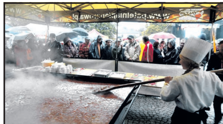
Do spróbowania gorącego forsmażku podawanego wprost z gigantycznej patelni ustawia się na Placu Wolności długa kolejka chętnych. Ufundowaną przez SKEF potrawę, którą przyrządziła trójka kucharzy, nasycili się wszyscy chętni