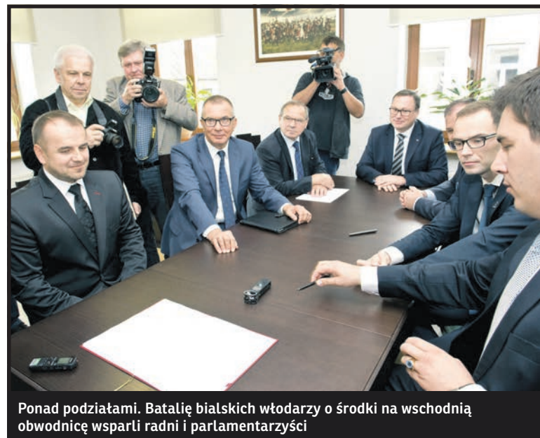
Ponad podziałami. Batalię białskich władarzy o środki na wschodnią obwodnicę wsparli radni i parlamentarzyści