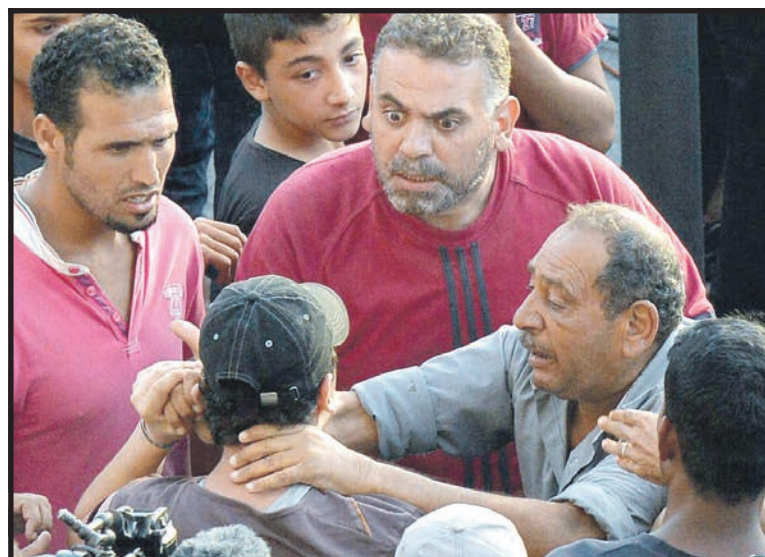
Mieszkańcy regionu obawiają się fali imigrantów i zagrożeń z tym związanych