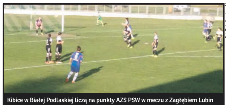
Kibice w Białej Podlaskiej liczą na punkty AZS PSW w meczu z Zagłębiem Lubin