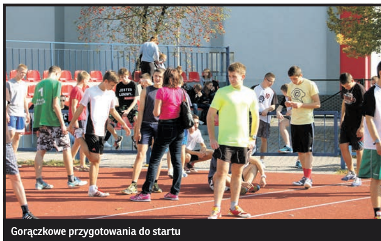
Gorączkowe przygotowania do startu

nież białskim IV LO, miejsce trzecie wywalczyli uczniowie ZS Małaszewicze. Wśród dziewcząt także na dwóch czołowych miejscach uplasowały drużyny I oraz II LO z Białej Podlaskiej, na trzecim zaś uplasowała się ekipa LO Wisznice.