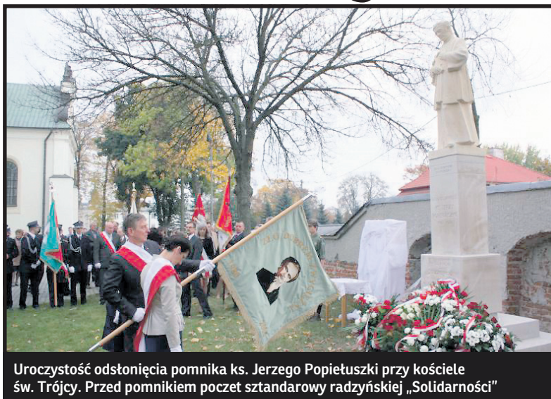
Uroczystość odślonięcia pomnika ks. Jerzego Popiełuszki przy kościele św. Trójcy. Przed pomnikiem poczet sztandarowy radzyńskiej „Solidarności”

By uczcić 30 rocznicę męczeńskiej śmierci bł. ks. Jerzego Popiełuszki Fundacja „Kocham Podlasie” Grzegorza Biereckiego oraz NSZZ „Solidarność” o. Białą Podlaską zapraszają na pokaz filmu „Popiełuszko. Wolność jest w nas”. Pokaz odbędzie się w niedzielę, 19 października, w kościele pw. Wniebowzięcia NMP przy ul. Długiej po mszy św. o godz. 18. Po filmie dyskusja z udziałem wyjątkowych gości.