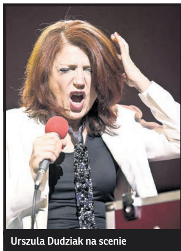
Urszula Dudziak na scenie