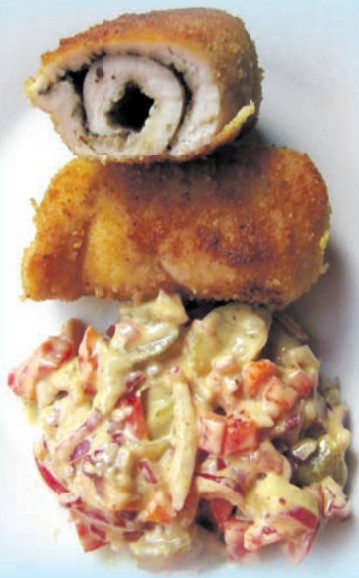
MG (TEKST I FOTO)

Paprykę kroję na kawałki, cebulę w piórka, ogórek w plasterki, które dzielę na pół. Musztardę mieszam z przyprawami oraz oliwą. Sosem polewam warzywa. Sałatka najlepiej smakuje po około dwóch godzinach, kiedy wszystkie smaki „przegryzą się”.