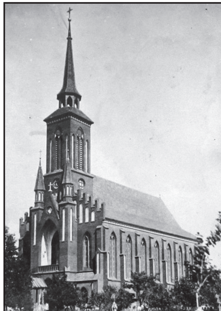
Pierwszy kościół katolicki w Konstantynowie gromadzący wiernych od 1909 roku

Miasto staje się ośrodkiem gospodarczym dla okolicznych folwarków. Właściciel sprowadza Żydów, zajmujących się handlem oraz rzemieślników. Wznosi barokową rezydencję oraz zakłada okalającą ją park. Innowacją w skali ówczesnej Polski były powstające w okolicy zakłady przemysłowe, przetwarzające nie tylko produkty rolne, ale i kopaliny.