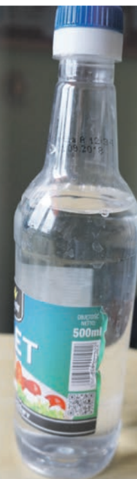
MAŁGORZATA TYMOSZUK (TEKST I FOTO)

Tani i skuteczny wybielacz – do garnka wlewamy 1 szklanke octu i 1 ½ wody. Gotujemy, zdejmujemy z ognia i wkładamy do środka bawełniane tekstylia, np. skarpetki, na całą noc. Potem pierzemy jak zwykle.