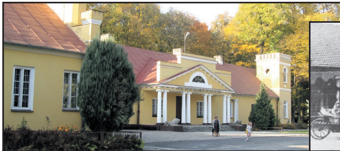
Fronton konstantynowskiego pałacu obecnie...