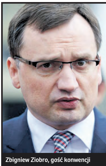
Zbigniew Ziobro, gość konwencji

W środowiskowej konwencji weźmie udział senator Grzegorz Bierecki, ubiegający się o reelekcję z okręgu nr 17 (Biała Podlaska, powiat bialski, powiat parczewski i radzyński). – Cieszę się na spotkanie z moimi przyjaciółmi z Prawa i Sprawiedliwości, doskonałymi parlamentarzystami i kandydatami na parlamentarzystów. Chcemy dokończyć to, co w naszym regionie zostało zapoczątkowane zwycięskimi wyborami samorządowymi. Idziemy do wyborów z programem dobrej zmiany. Ta zmiana należy się Pola-