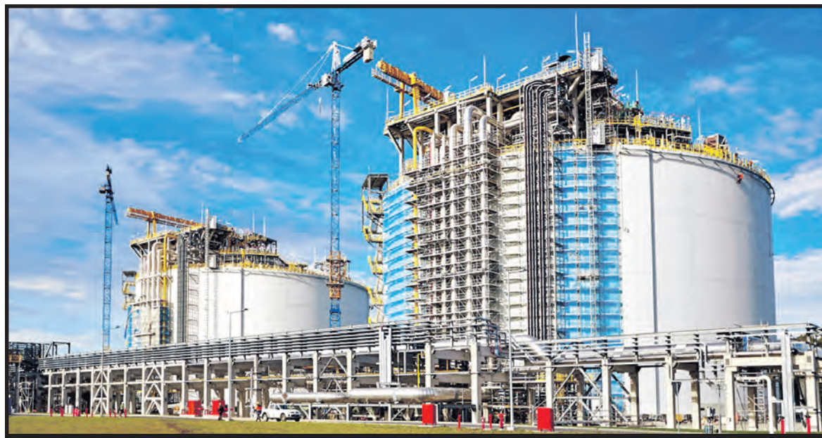
Terminal do odbioru skroplonego gazu ziemnego (LNG) to jedna z największych polskich inwestycji ostatnich lat. Umożliwi odbiór gazu ziemnego drogą morską praktycznie z każdego kraju świata

systemów gazoportu planowane jest dopiero na grudzień 2015 r., więc nie ma mowy o tym, że obiekt jest gotowy. Termin grudniowy jest zresztą efektem sprawdzenia stanu obiektu, jaki wykonał dostawca gazu z Kataru. Znamienne jest, że Katarczyści sami wymogli na stronie polskiej opóźnienia i rezygnację z wcześniejszego październikowo-listopadowego terminu.