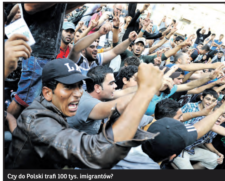
Czy do Polski trafi 100 tys. imigrantów?

Funduje nam bombę z opóźnionym zapłonem, czego dowodem jest sytuacja w Białej Podlaskiej i w całym naszym regionie. Czas to przerwać, jestem przekonany, że nowy rząd uporządkuje ten chaos i zapewni Polakom bezpieczeństwo – mówi Bierecki.