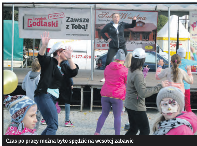
Czas po pracy można było spędzić na wesołej zabawie