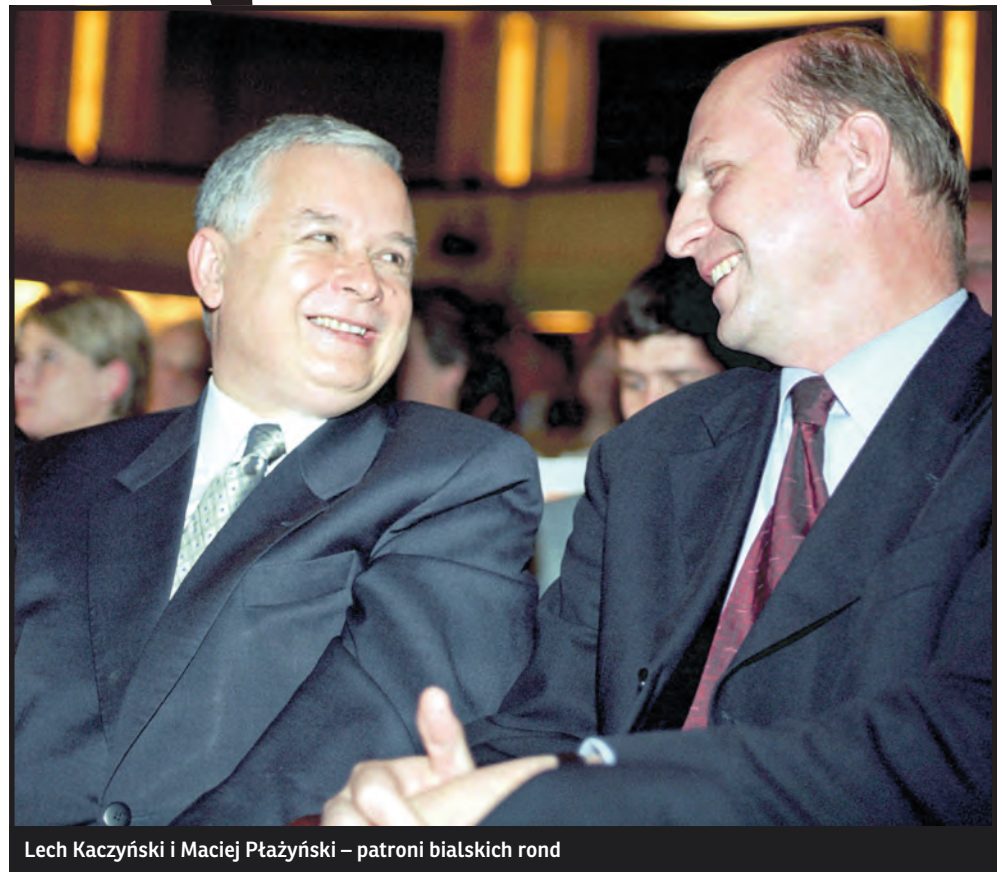
Lech Kaczyński i Maciej Płażyński – patroni białskich rond