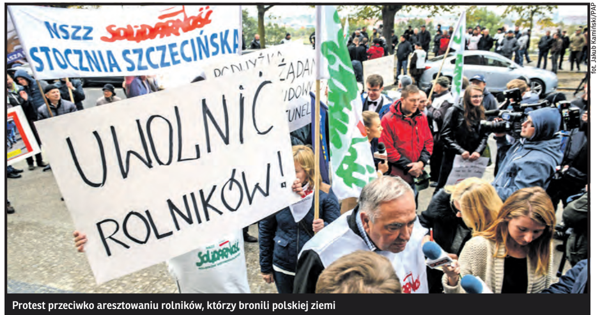
Protest przeciwko aresztowaniu rolników, którzy bronili polskiej ziemi