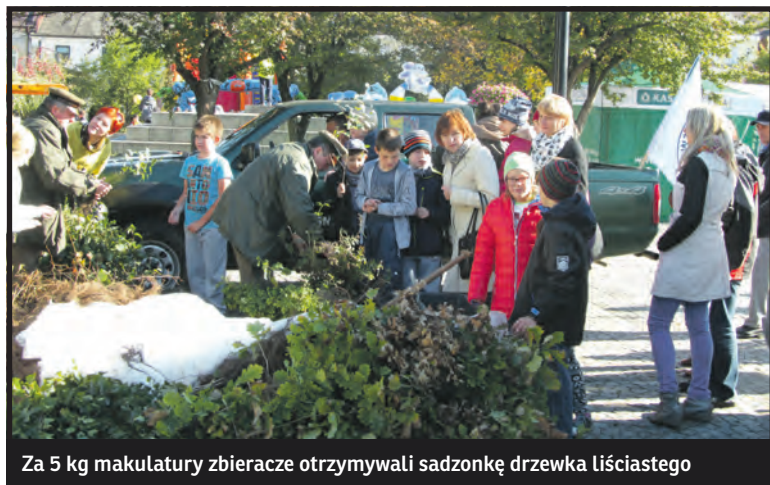
Za 5 kg makulatury zbieracze otrzymywali sadzonkę drzewka liściastego

Największym jednak sukcesem tej i wcześniejszych akcji „Tygodnika Podlaskiego” jest kształtowanie obywatelskich postaw już od najmłodszych lat. Polskie lasy – któ-