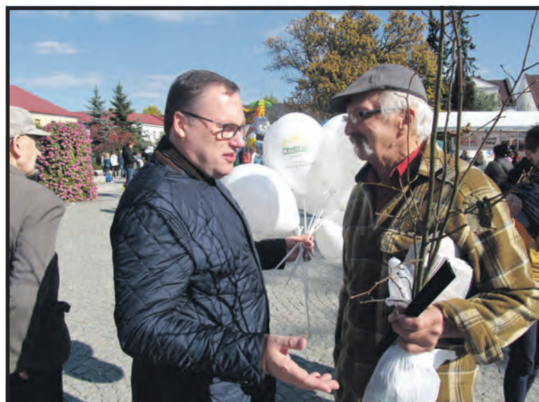
Senator Grzegorz w rozmowie z artystą-malarzem Maciejem Falkiewiczem

REKLAMA: reklama@tygodnikpodlaski.pl kpszowski@tygodnikpodlaski.pl, tel. 695 353 321