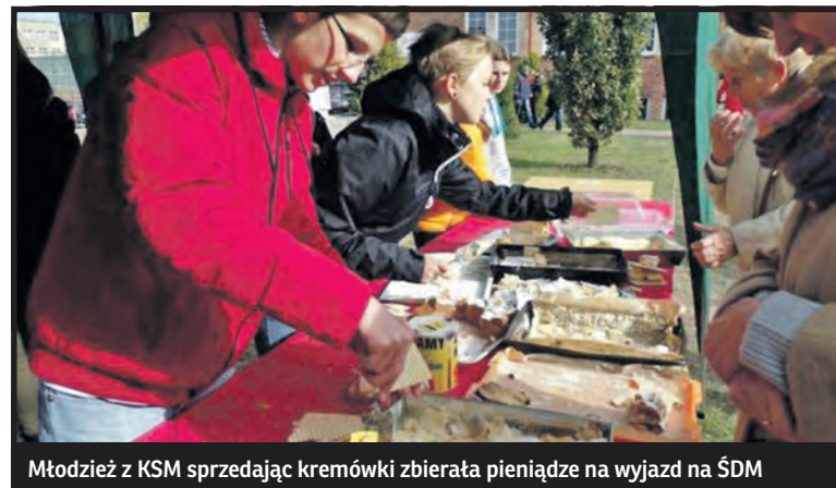
Młodzież z KSM sprzedając kremówki zbierała pieniądze na wyjazd na ŚDM