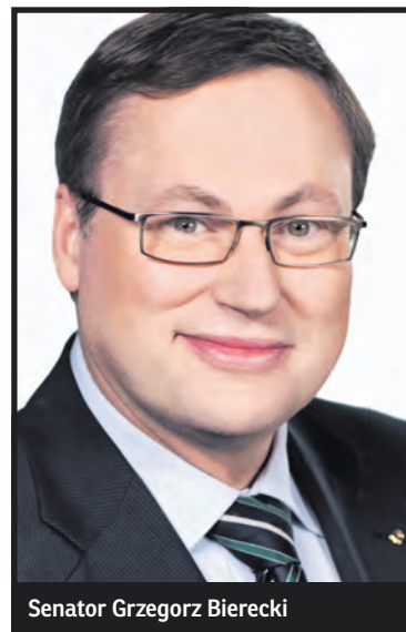
Senator Grzegorz Bierecki