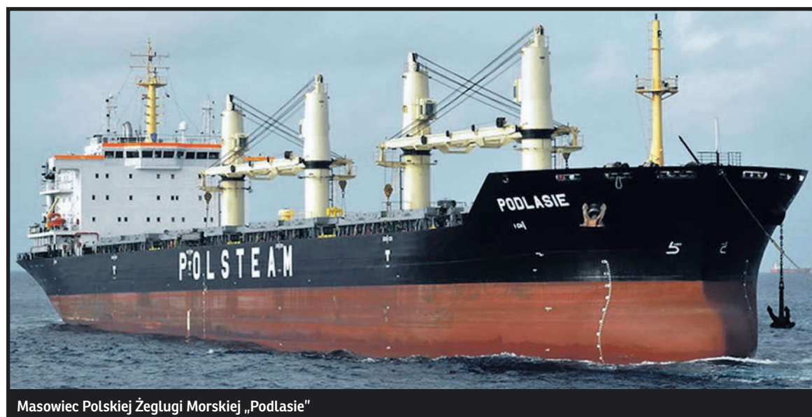
Masowiec Polskiej Żeglugi Morskiej „Podlasie”

Statek należał wcześniej do Towarzystwa Dalekomorskich Połowów „Pomorze”, spółki z mieszanym kapitałem polskim, angielskim i gdańskim. Był to trawler, zbudowany w 1919 r. w br tytyjskiej stoczni Cochrane & Sons Ltd. w Selby, i noszący wcześniej nazwy „Thomas Maloney” oraz „St. Neots”. Napędzany maszyną parową o mocy 600 KM kadłub długości 44,8, szerokości 7,2, zanurzeniu 3,2 m, mieszczący w ładowni tysiąc znormalizowanych beczek, wymagał zatrudnienia 16-osobowej załogi.