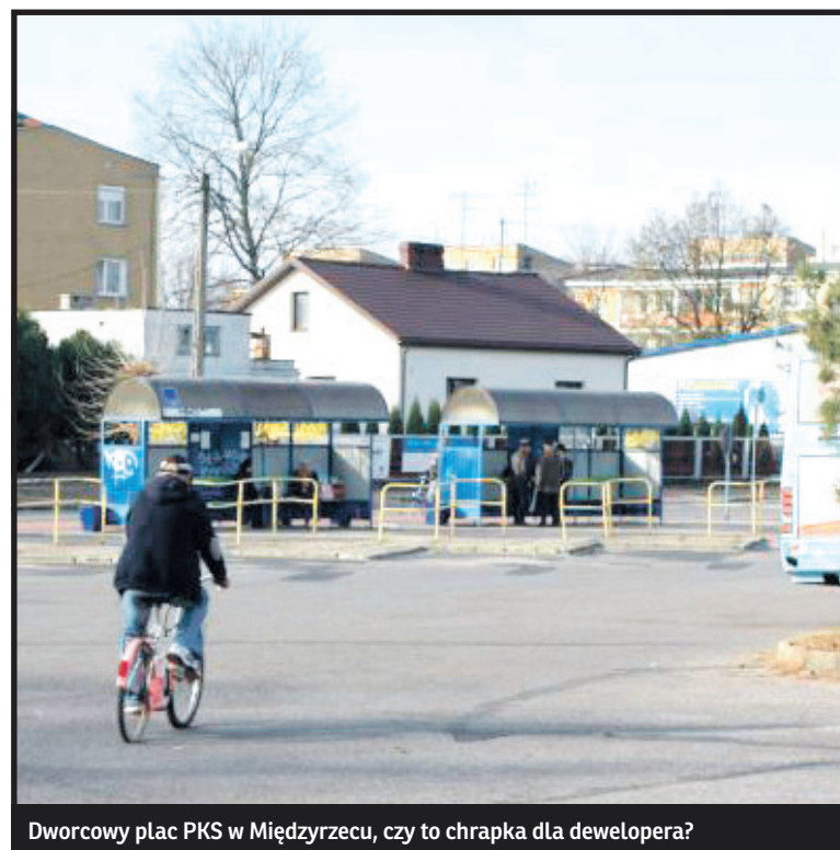
Dworcowy plac PKS w Międzyrzeczu, czy to chrapka dla dewelopera?