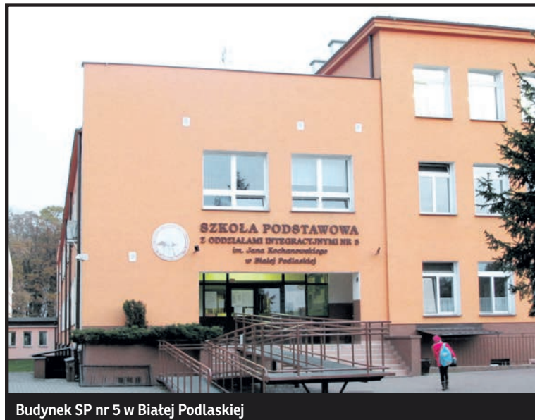
Budynek SP nr 5 w Białej Podlaskiej