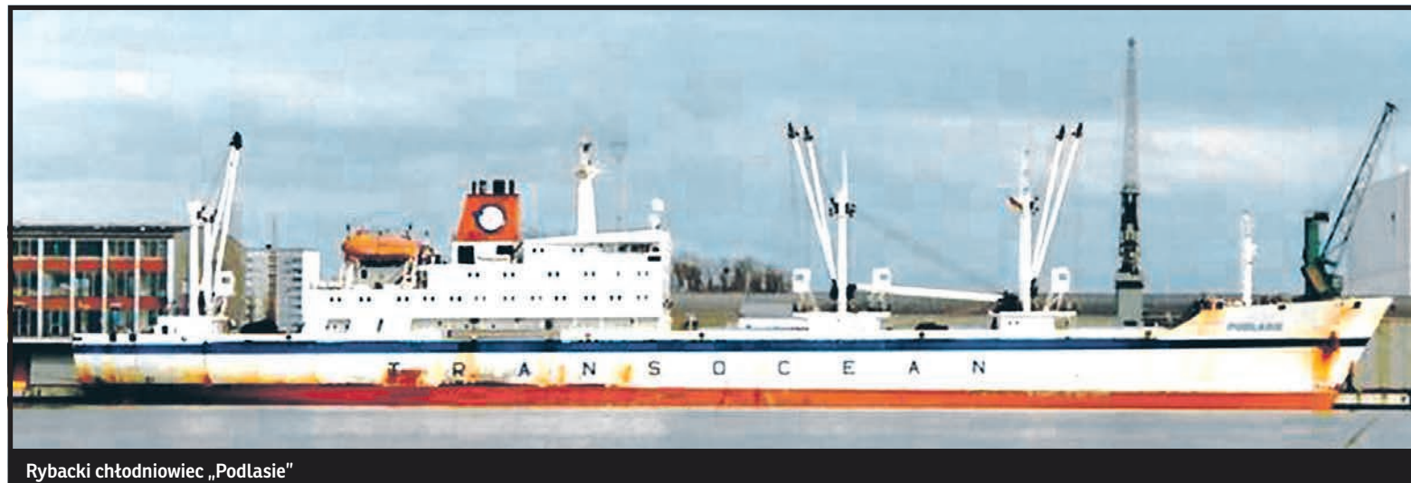
Rybacki chłodniowiec „Podlasie”

Ze względów finansowych masowiec („Podlasie”, przeznaczone do przewożenia ładunków sypkich względnie wielkogabarytowych, zaliczane jest do klasy masowców) nie nosi biało-czerwonej bandery, zarejestrowany bowiem został na Wyspach Bahama: jako jego port macierzysty figuruje więc w dokumentach nie Szczecin, gdzie ma siedzibę armator, lecz Nassau. Jego właścicielem rejestrowym pozostaje spółka zależna PŻM o nazwie Ares One Shipping Ltd. Pierwsza podróż „Podlasia” wiodła ze stoczni, w której zostało zbudowane, do portu Zhangjiagang w Chinach – załadowane tam wyroby stalowe statek zawiózł do Monfalcone we Włoszech. Jak wynika z zapisków armatorskich, w ciągu pierwszych dwóch lat służby tramp trzykrotnie przebył sztormową Cieśninę Magellana, pływał po rzekach Orinoko, Amazonka i Missisipi. Po raz pierwszy odwiedził Szczecin w listopadzie 2009 r., kiedy przywiózł dla polskiego odbiorcy zboże z Argentyny. M/s „Podlasie”, klasyfikowany jako handysize (czyli poręczny), może przewieźć w pięciu ładowniach do 38 056 ton towarów. Kadłub ma 189,97 m długości, 28,5 szerokości i 10,4 zanurzenia. Za – i wy-