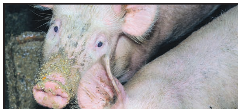
ASF stał się jednym z pretekstów do rosyjskiego embarga na polską wieprzowinę

Tymczasem pierwotna przyczyna problemów, czyli epidemia afrykańskiego pomoru świń ani myśli ustąpić. Właśnie odnotowano 18 przypadek tej choroby w Polsce – podała w komunikacie Główny Lekarz Weterynarii. Tym razem znale-