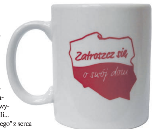
Kubek – symbol naszej akcji „Zatroszcz się o swój dom”

Redakcja „Tygodnika Podlaskiego” z serca dziękuje wszystkim, którzy wzięli udział w głosowaniu. Południowe Podlasie to nasz dom! Zachęcamy mieszkańców do zatroszczenia się o to, jak on będzie wyglądał. Także i tych, którzy nie udali się do urn wyborczych i na dziś nie planują udziału w głosowaniu: nie tylko 30 listopada, ale i w każdych kolejnych wyborach. „Ojczyzna to wielki zbiorowy obo-