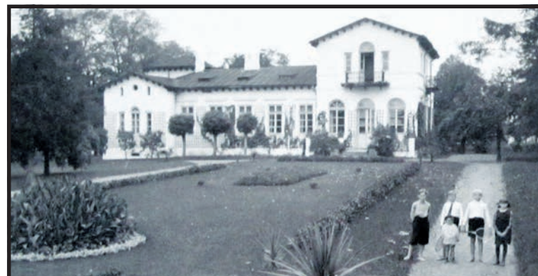
Dwór w Koroszczynie 1934 r.