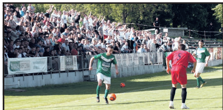
Czy dobre występy Podlasia w dwóch ostatnich meczach przyciągną kibiców na stadion przy Artyleryjskiej?