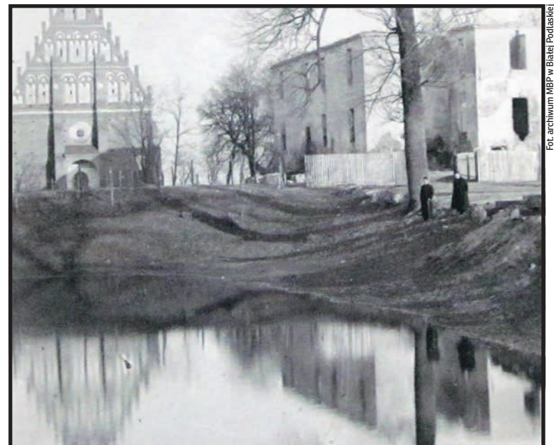
Kodeń, kościół oraz ruiny zamku (1936)

Z racji zróżnicowanego poziomu wody w rzece splaw odbywał się w miesiącach wiosennych, przy wysokim stanie wód, wtedy po Bugu pływały ze zbożem tzw. galary, czyli rzeczne statki wiosłowe, używane do jednorazowego transportu towarów w dół rzeki. To był okres szczególnie ożywionego ruchu, bo ceny zboża były wyższe od tych, które uzyskiwało się bezpośrednio po zbiorach. Ta istotna rola komunikacyjna sprawiła, że według konstytu-