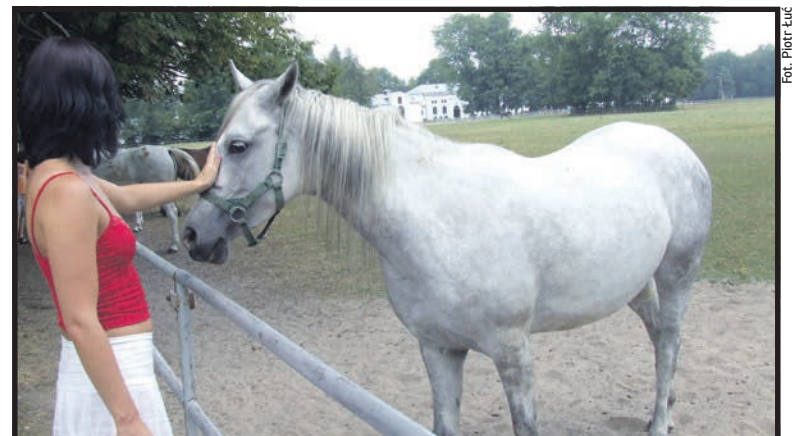
Konie z janowskiej stadniny cieszą się w świecie znakomitą marką

Stadnina w Janowie ma uznaną markę na świecie. Na odbywających się co roku