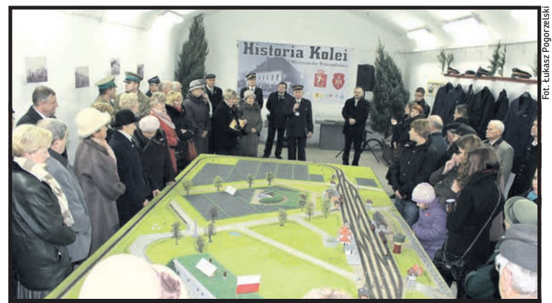
Wystawa kolejnictwa w Prochowni

Efektom warsztatów było powstanie dwóch profesjonalnych filmów o najciekawszych zakątkach miasta. Pierwszy z nich p.t. „Prochownia” to historia