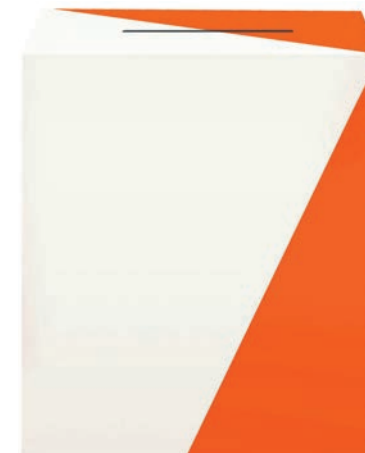
Fot. Krzysztof Stanisławski

W urnie radzyńskiej komisji nr 6 znaleziono 61 nieostemplowanych kart do głosowania. Jak się tam znalazły?