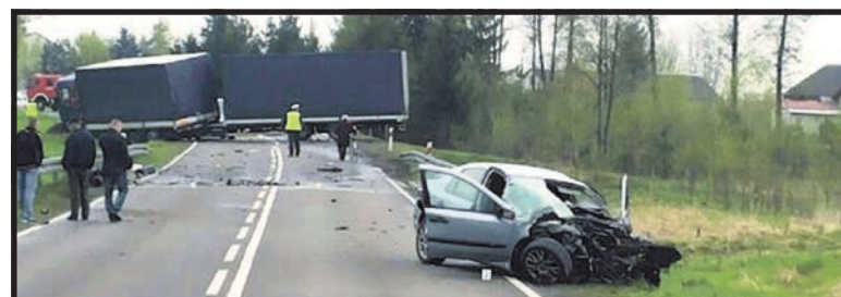
Via Carpatia oznaczałaby także zdecydowaną poprawę bezpieczeństwa na zattoczonym odcinku S-19 w powiatach radzyńskim i międzyrzeckim. Na zdjęciu: wypadek na S-19 w okolicach Kąkolewnicy (wiosna 2014)

– Via Carpatia pozwoliłaby na wyrównanie różnic, jakie istnieją między Polską a krajami tzw. starej Unii w dziedzinie transportu drogowego. To jest też kwestia strategicznych interesów Unii Europejskiej, żeby jej wschodnia flanką była lepiej skomunikowana i zasobniejsza, co na pewno prze-