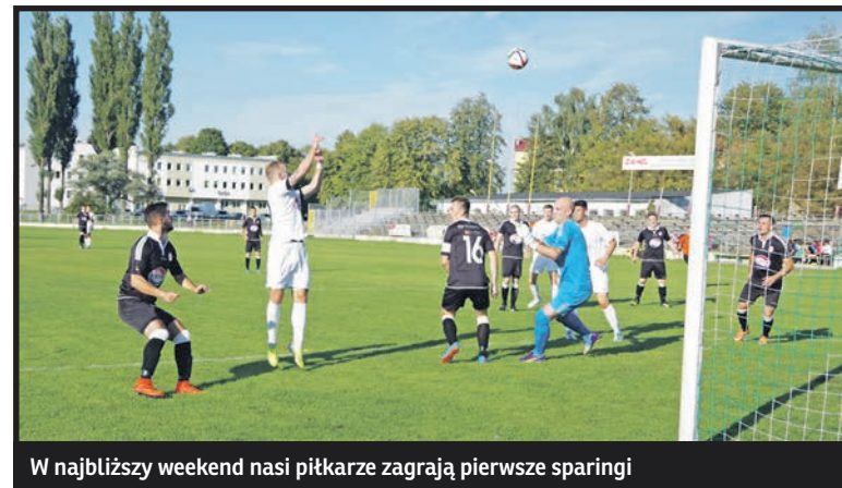
W najbliższy weekend nasi piłkarze zagrają pierwsze sparingi

do jego dyspozycji. Podlasie pracuje na własnych obiektach, a na dniach zajęcia wznowi Lutnia Piszczac.