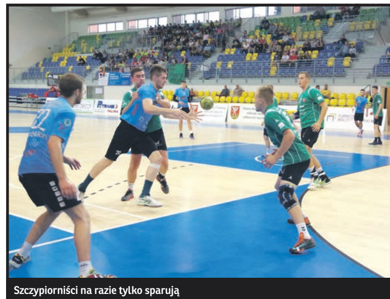
Szczyptorniści na razie tylko sparują