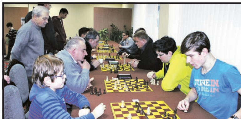
Szachowej rywalizacji w Terespolu patronowała Fundacja Grzegorza Biereckiego „Kocham Podlasie”

Zawodnicy z Węgrowa, Łomaz, Konstantynowa, Białej Podlaskiej, Międzyrzeca, Grabanowa oraz Terespoła uczestniczyli w turnieju szachowym zorganizowanym pod patronatem senatora Grzegorza Biereckiego.