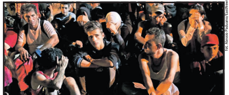
Zdecydowana większość imigrantów wskazuje jako swój cel Niemcy i inne bogate kraje, Polska to dla nich tylko przystanek

– Dla parafian był to wielki szok i smutek. Nawet nie myślałem, że to aż tak głęboko nam wszystkim zapadło w serca. Czuliśmy się trochę oszukani, bo nigdy nie myślałem, że może dojść do takiej sytuacji. Myśmymy przecież zaofiarowali im pomoc, niczego nie oczekując w zamian. Ale tak po ludzku było nam smutno, że oni byli, że cieszyliśmy się, że możemy im pomóc, że mogliśmy się włą-