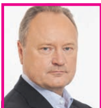
JANUSZ SZEWCZAK Poseł PiS