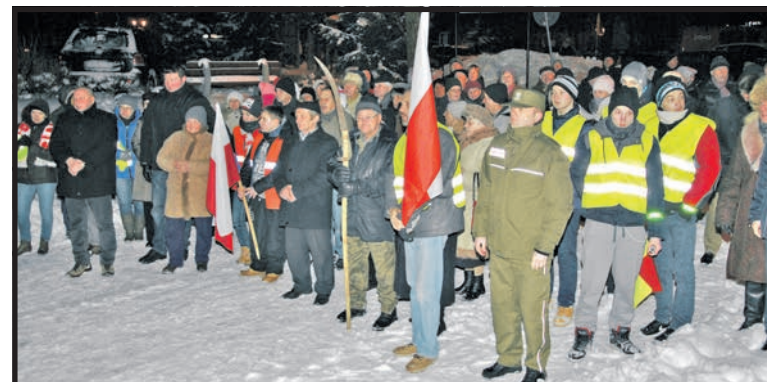
Kodeński marsz śladem powstańców styczniowych

Przy pamiątkowym kamieniu obok kościoła św. Anny zebrani odśpiewali hymn narodowy, w imieniu społeczeństwa Kodnia wieniec na pamiątkowej płycie