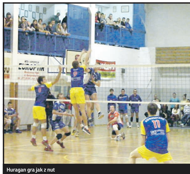
Huragan gra jak z nut