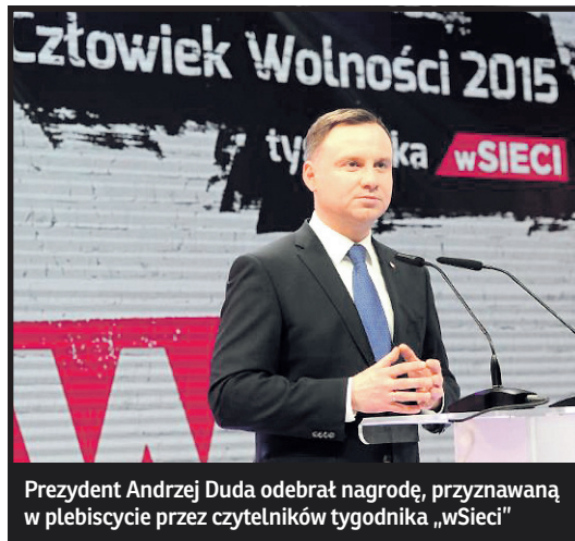
Prezydent Andrzej Duda odebrał nagrodę, przyznaną w plebiscywie przez czytelników tygodnika „wSieci”

Prezydent Andrzej Duda otrzymał nagrodę Człowiek Wolności 2015 tygodnika „wSieci”. Uroczysta gala odbyła się w Warszawie, gromadząc wybitne osobistości ze świata polityki, kultury i gospodarki.