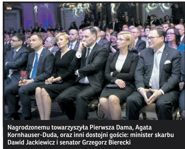
Nagrodzonemu towarzyszyła Pierwsza Dama, Agata Kornhauser-Duda, oraz inni dostojni goście: minister skarbu Dawid Jackiewicz i senator Grzegorz Bierecki