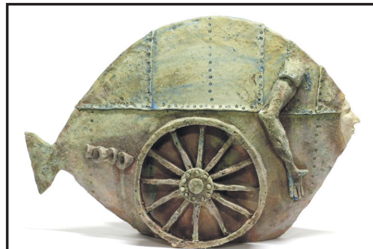
Jedna z prac Artura Szweda; nie przez przypadek nazywa się go „poetą ceramiki”

Swoje gliniane rzeźby Arkadiusz Szwed prezentuje na stronach internetowych. Biorąc pod uwagę ilość osób odwiedzają-