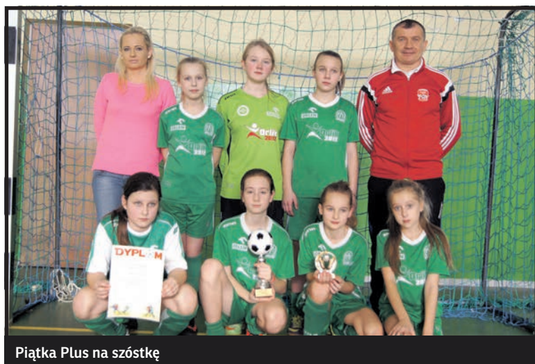
Piątka Plus na szóstkę

W półfinałowym spotkaniu z Gaudium Zamość padł remis: 2:2. Karne jednak celniej strzelały białczanki. W meczu finałowym nasze dziewczyny spotkały się z Orłem Harasiuki, mistrzem województwa podkarpackiego, gościnnie występującym w tym turnieju. W regulaminowym czasie gry padł bezbramkowy remis.