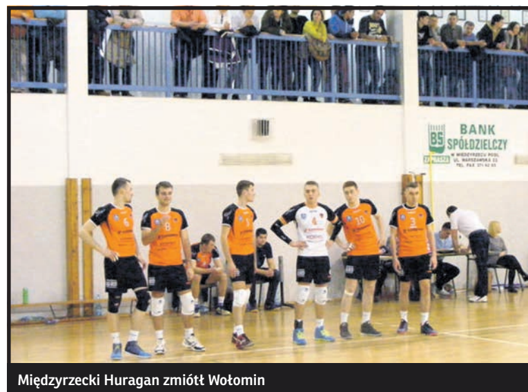
Międzyrzecki Huragan zmiotł Wołomin