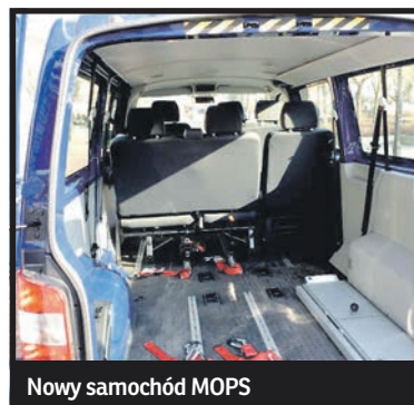
Nowy samochód MOPS

Miejski Ośrodek Pomocy Społecznej otrzymał nowy samochód do przewożenia dzieci niepełnosprawnych do szkół. Nowy volkswagen transporter zastąpił dziesięcioletni wysłużony pojazd. Samochód kosztował 140 tysięcy złotych, z czego 50 proc. wyłożył Urząd Miasta i tyleż samo Państwowy Fundusz Rehabilitacji Osób Niepełnosprawnych. Auto przystosowane jest do przewozu dwóch osób na wózkach, poprzednie umożliwiała przewóz tylko jednej osoby. Obecnie MOPS zapewnia bezpłatny transport dla jedenastu uczniów, z których sześciu