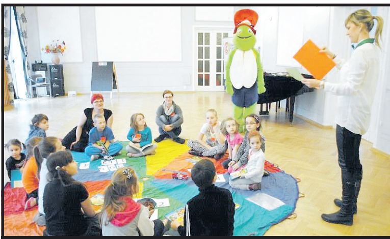
Akcja edukacyjna Fundacji Grzegorza Biereckiego „Kocham Podlasie”