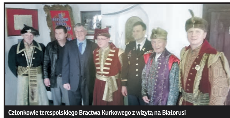
Członkowie terespolskiego Bractwa Kurkowego z wizytą na Białorusi