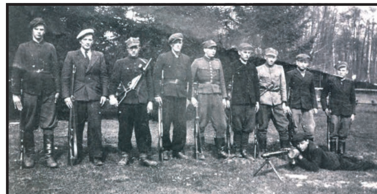
Żołnierze podlaskiego oddziału WiN