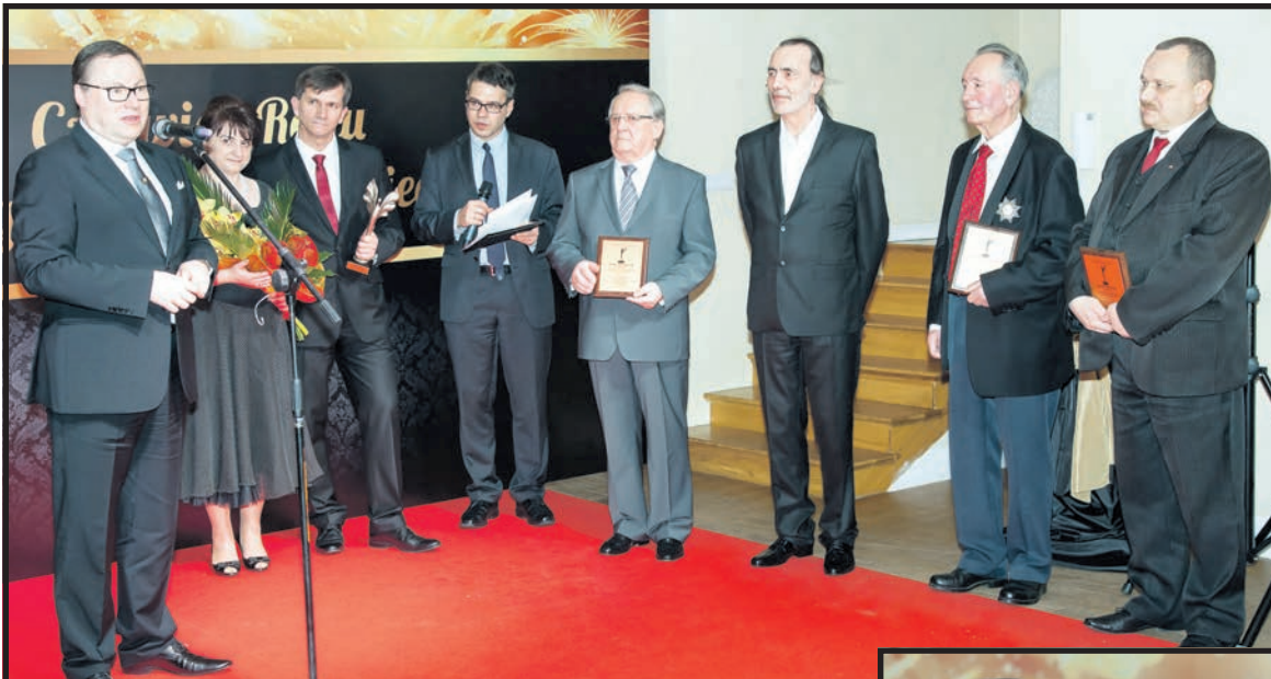
Senator Grzegorz Bierecki gratuluje nominowanym do nagrody „Człowieka Roku”