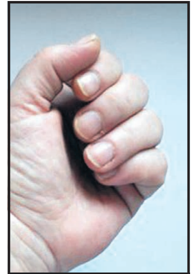
Na stan naszych paznokci zbawienny wpływ ma dieta bogata w witaminę B

Jednym z najszybszych sposobów na poprawienie stanu naszych paznokci jest postużenie się zwykłą oliwą. Wystarczy ok. 2/3 szklanki tego tłuszczu. Oliwę trzeba lekko podgrzać i wymieszać z sokiem z połówki cytryny. W takiej ciepłej kąpielii moczymy palce od 10 do 15 minut. Po osuszeniu rąk nie wylewamy zawartości miseczki, postużymy nam ona jeszcze nie raz, bowiem zabieg powinniśmy stosować dwa razy w tygodniu. Miksturę przechowujemy w szczelnie zamkniętym słoiczku, w ciemnym miejscu. Przed kolejnym zabiegiem wystarczy ją ponownie podgrzać. Innym świetnym sposobem na piękne paznokcie jest codziennie wcieranie w całą płytkę paznokcia zawartości z kapsułki witaminy A i E. Możemy również w podobny sposób wykorzystać w naszym domowym Spa olejek rycynowy, który kosztuje niespełna 3 złote (w zależności od pojemności) i jest dostępny w każdej aptece. Nie zapominajmy również i o tym, że na wygląd naszych paznokci duży wpływ ma dieta. Spożywajmy zatem jak najwięcej produktów, które są bogate w witaminy z grupy B. Gdzie je znajdziemy? W produktach pochodzenia roślinnego i zwierzęcego,