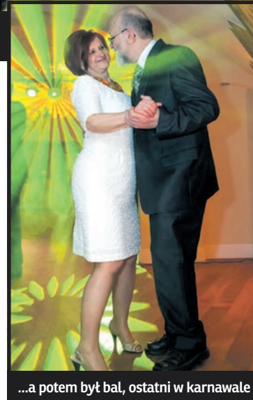
...a potem był bal, ostatni w karnawale