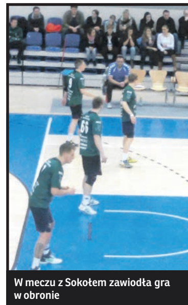
W meczu z Sokółem zawiodła gra w obronie

parkiecie Sokołowi Kościerzyna 23:30. Było to w wykonaniu bialczan wyjątkowo słabe spotkanie. W najbliższą sobotę do Białej zawita lider rozgrywek –