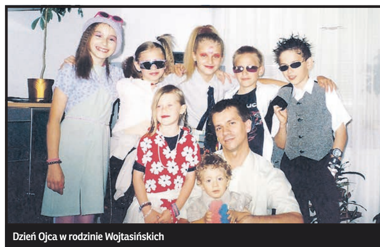
Dzień Ojca w rodzinie Wojtasińskich