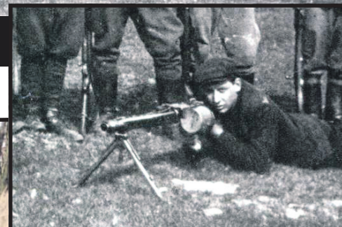
Partyzancki kaemista z MG-34 w 1947 roku...