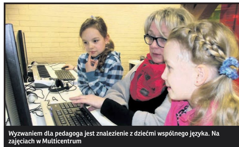
Wyzwaniem dla pedagoga jest znalezienie z dziećmi wspólnego języka. Na zajęciach w Multicentrum

– Moim zadaniem jest zachęcenie młodych ludzi do twórczości, która nie tylko pobudza wyobraźnię, ale i uczy plano-