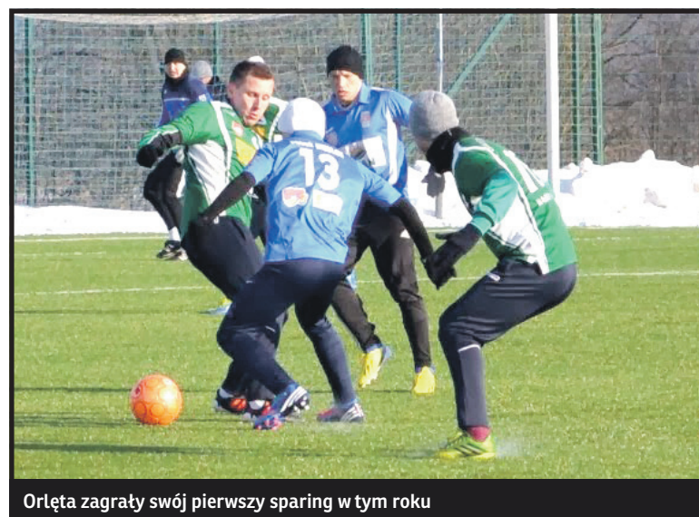
Orłęta zagrały swój pierwszy sparing w tym roku