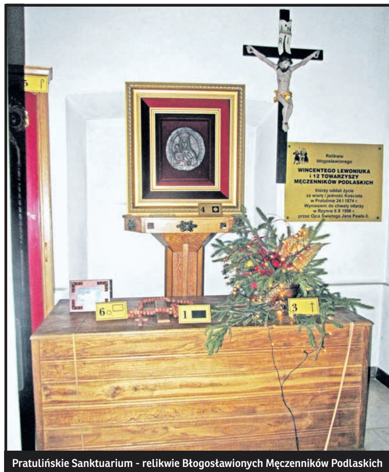
Pratulińskie Sanktuarium - relikwie Błogosławionych Męczenników Podlaskich

Pytanie wydaje się proste i łatwe, jednak odpowiedź nie jest tak oczywista. Skąd u nich ta silna wiara i jakie znaczenie miał dla nich ich kościół? Ci, w zdecydowanej większości prości ludzie, często nieposiadający umiejętności pisania i czytania, nie pozostawili po sobie zbyt wiele przekazów pisemnych. Nie dochowały się również źródła z tamtego okresu. Jednym z nielicznych są przechowywane w Archiwum Państwowym w Lublinie zeznania składane przez Unitów władzom carskim. Przyczyną rozłamów w chrześcijaństwie były często różne interpretacje teologiczne czy też spory hierarchiczne. Powstało wiele kościołów. Obok jednak tej tendencji istniało coś zgoła przeciwnego – próby przywrócenia jedności, przy zachowaniu autonomii w liturgii. Jednym z większych rozłamów była Schizma Wschodnia w 1054 r z podziałem na Kościół Rzymskokatolicki i Prawosławny.