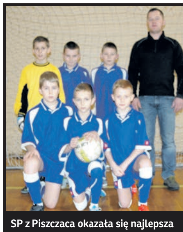
SP z Piszczaca okazała się najlepsza