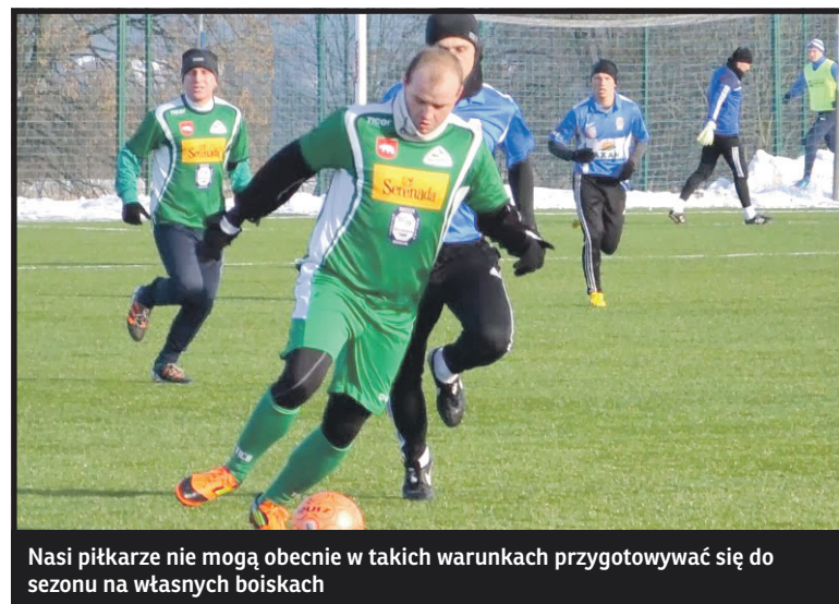
Nasi piłkarze nie mogą obecnie w takich warunkach przygotowywać się do sezonu na własnych boiskach