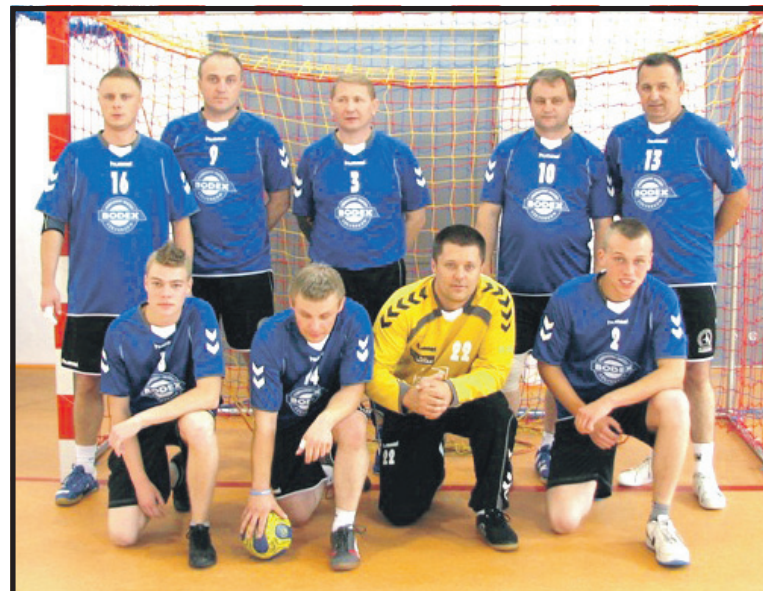
MKS Wieluń sobotę zawita do Białej Podlaskiej