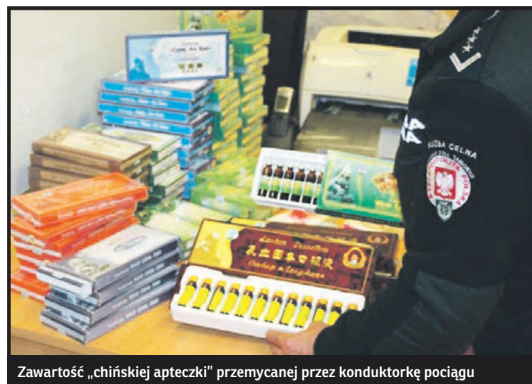
Zawartość „chińskiej apteczki” przemycanej przez konduktorkę pociągu