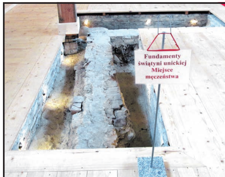
Kościół ze Stanina ustawiony na miejscu starej świątyni, przed którą dokonano się Męczeństwo Unitów Podlaskich

Rozstrzelanie w trakcie modlitwy 13 Unitów stało się symbolem ponad czterdziestoletnich prześladowań ludzi