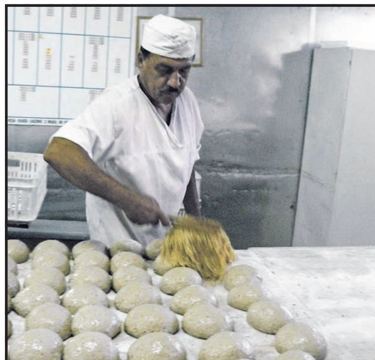
Na Podlasiu trudno o pracę, liczba ofert jest wielokrotnie mniejsza od osób poszukujących zajęcia. Białski PUP dodał w styczniu do swojej listy tylko 60 ofert

– Znam firmę, która oszukała wielu ludzi. Na pytanie, kiedy będą pobory, jej szef odpowiada: zapłacę, gdy będę miał pieniądze. Czekam już ponad rok, z tego co wiem inni czekają dłużej. A on nadal zatrudnia młodych, żerując na ich nie-