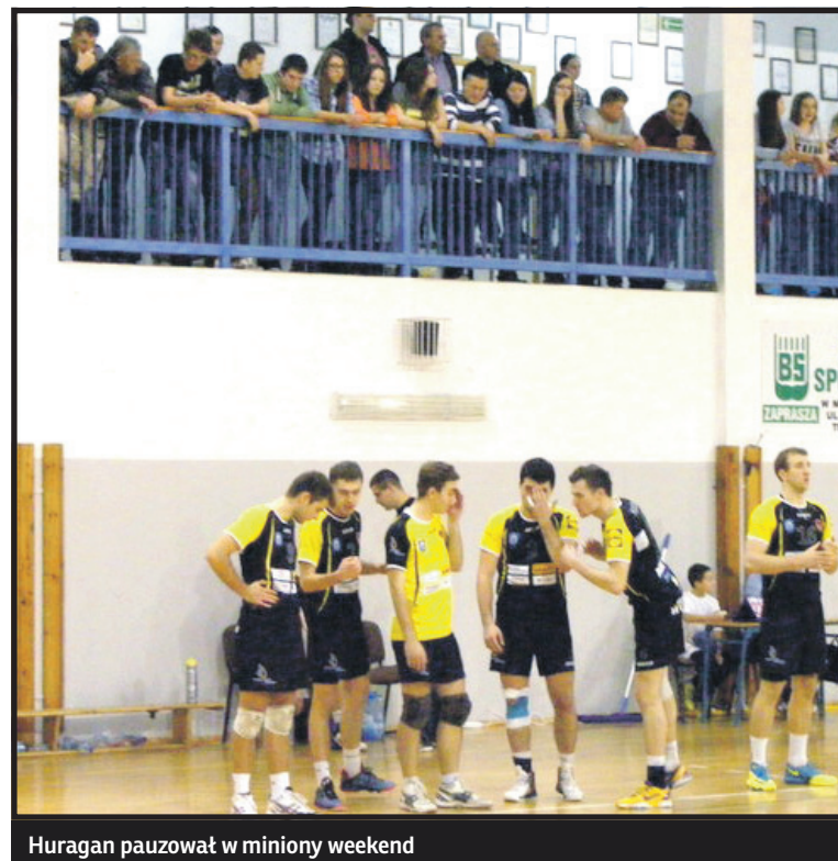
Huragan pauzował w miniony weekend

18. kolejka Centrum – Stoczniovec 3:2 Wola – Huragan W. 3:1