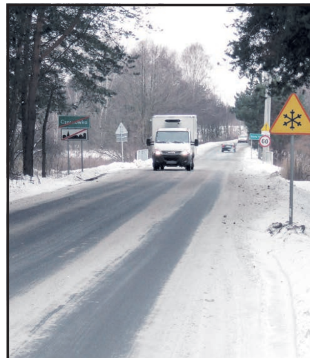
Budowa drogi Biała Podlaska – Ogrodniki – Piszczac najprawdopodobniej w tym roku nie będzie kontynuowana