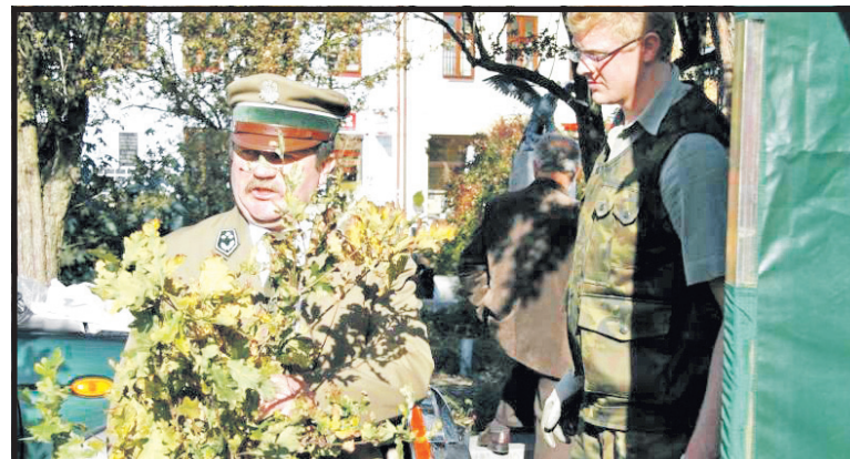
Co roku Tygodnik Podlaski wspólnie z Regionalną Dyрекcją Lasów Państwowych organizuje bardzo popularną akcję rozdawania drzewek za makulaturę... Czy wkrótce będzie komu je rozdawać?

A przecież środki te można wykorzystać inaczej, choćby na zatrudnienie absolwentów techników i wydziałów leśnych polskich uczelni. Obecnie rzadko znajdują oni zatrudnienie w wyuczonym zawodzie – na jedno miejsce kandyduje niekiedy kilkudziesięciu chętnych. Za inwestowanie w zatrudnianie młodych ludzi przyniosłoby pożytek ogólnopolski: pielęgnację i monitoring lasów, powstanie ścieżek rekreacyjnych, miejsc parkingowych, zatrzymanie w kraju fachowców, nie mogących tu znaleźć pracy. Mimo, iż Związek Leśników Polskich