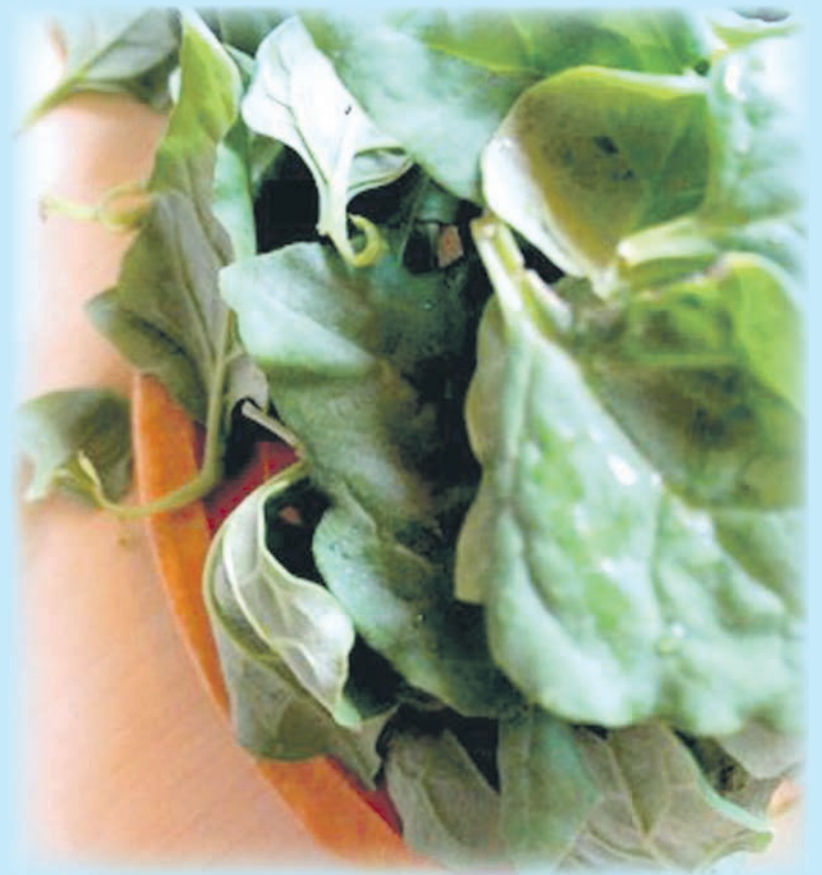
TEKST I FOTO MAŁGORZATA TYMOSZUK

Na suchej patelni wystarczy uprażyć orzechy na brązowy kolor. Następnie wymieszać liście szpinaku z kawałkami pomarańczy oraz cebulą, posypać uprażonymi orzechami i polać sosem. Wierzch garnirujemy sezamem, który – wedle upodobań – również może być wcześniej uprażony.