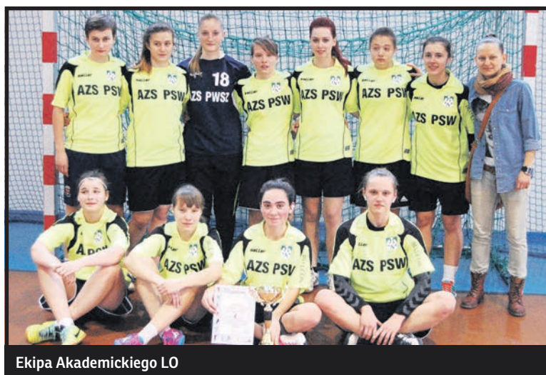
Ekipa Akademickiego LO