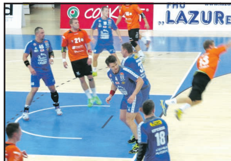
Lider był dla białczan zbyt mocny