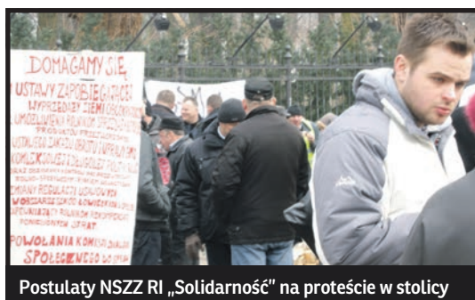
Postulaty NSZZ RI „Solidarność” na proteście w stolicy

„Żądamy dymisji ministra rolnictwa Marka Sawickiego” – oświadczył rolniczy OPZZ, którego nie usatysfakcjonowały deklaracje ministra, że większość postulatów rolników: dopłaty do produkcji wieprzowiny, rozłożenie na raty kar za nadprodukcję mleka i odszkodowania za szkody dzików, jest już załatwiona. Rusza akcja zbierania 100 tys. podpisów pod petycją do prezydenta o dymisję Sawickiego. Jednocześnie od środy wznowione były protesty na drogach, m.in. koło Parczewa. W czwartek rolnicy blokowali w naszym rejonie skrzyżowanie dróg 63 i 813 w okolicy Komarówki Podlaskiej. W Warszawie do soboty 28 lutego legalnie będzie działać miasteczko namiotowe przed Kancelarią Premiera, gdzie NSZZ Solidarność Rolników Indywidualnych m.in. domaga się ochrony prawnej dla polskiej ziemi rolnej. Nie jest jasne, czy protestujący dostaną pozwolenie od policji i władz stolicy na dalszą obecność. Sejm na posiedzeniu zacznącym się 3 marca ma debatować nad sytuacją w rolnictwie.