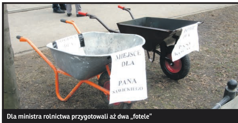
Dla ministra rolnictwa przygotowali aż dwa „fotele”

Nie mamy możliwości, by przechowywać mięso. Te pieniądze przechwycą zakłady przetwórcze i niektórzy z dużych producentów, często to ludzie związani z PSL, którzy mają odpowiednią bazę chłodni i magazynów. Zresztą, to o czym mówimy, to sprawa techniczna. Zasadniczej kwestii zabójczego dla nas importu mięsa z Niemiec, Danii, Belgii, a eksportu najlepszych gatunków polskiego mięsa np. do Japonii nie próbuje pan minister nawet ruszyć”.