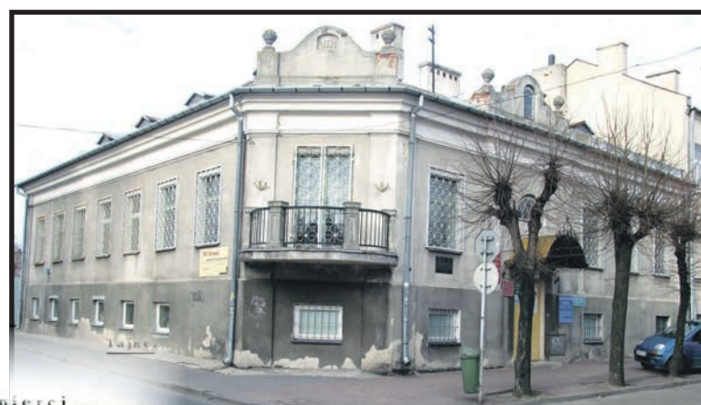
Budynek na rogu ul. Krótkiej i Budkiewicza – tu w latach 1944-56 miał siedzibę Powiatowy Urząd Bezpieczeństwa Publicznego