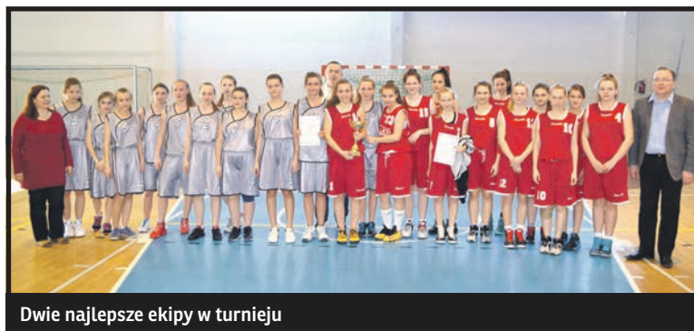
Dwie najlepsze ekipy w turnieju