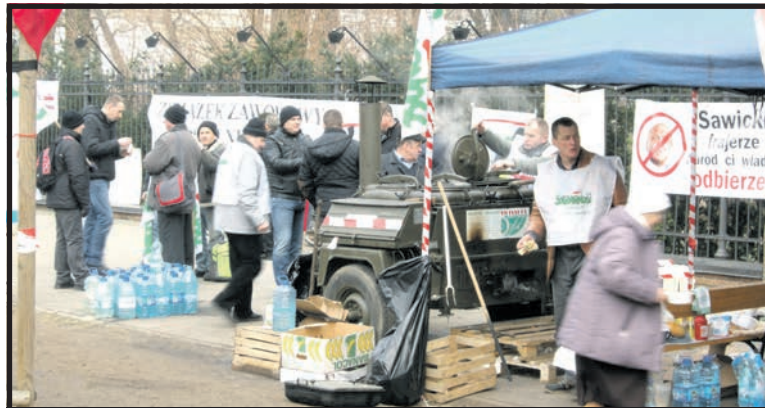
Rolnicy tłumaczyli mieszkańcom stolicy cel protestów...

Hodowca trzody chlewnej z powiatu radzyńskiego aż unosi się gniewem, gdy prosimy o komentarz do informacji ministra. „Rolnik hodowca nawet grosza z tych pieniędzy w rzeczywistości nie zobaczy.