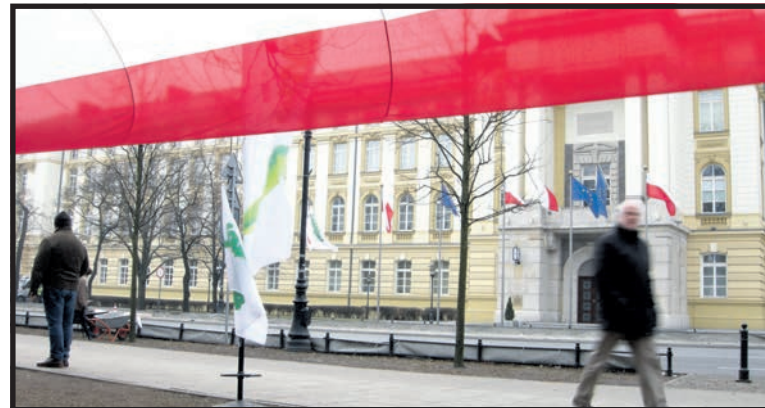
...Nie znaleźli słuchaczy wśród pracowników RM

Minister podtrzymał jednocześnie koncepcję, że osobnych rozmów z protestującymi NSZZ „Solidarność” RI i OPZZ nie będzie. Mają się przyłączyć do prac zespołów roboczych urzędników i niektó-