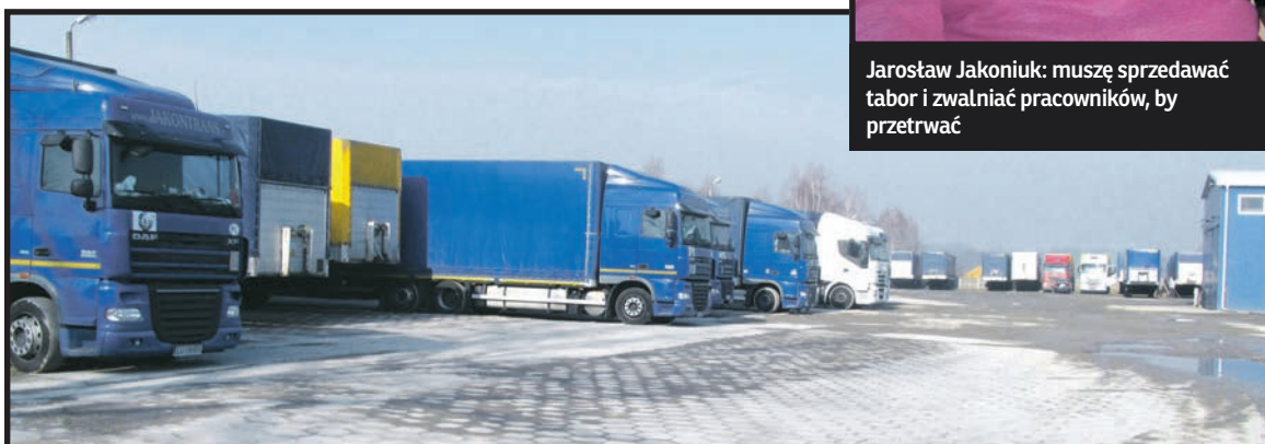
Firma z Białej Podlaskiej zmniejszy tabor o 10 ciężarówek

Tak krytyczna sytuacja dotyka wszystkich przewoźników. Firmy przewozowe jedy-