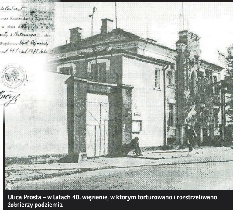
Ulica Prosta – w latach 40. więzienie, w którym torturowano i rozstrzeliwano żołnierzy podziemia

konano dopiero po wywiezieniu patriotów z więzienia w okoliczne lasy.