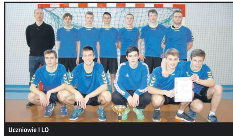
Uczniowie I LO