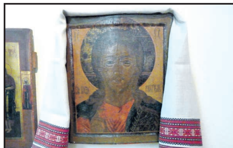
Najpiękniejsze płótno zdobiło w domu święte obrazy