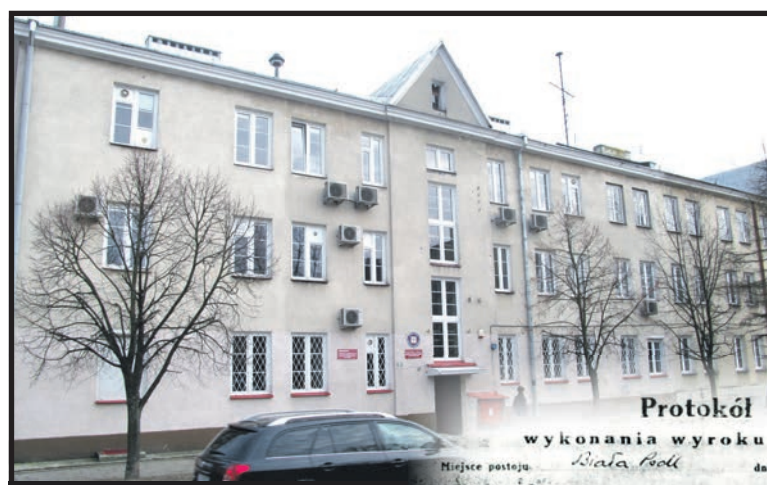
Ulica Kopernika – w latach 1946-49 siedziba i więzienie Informacji Wojskowej (kontrwywiadu) 47 pułku piechoty LWP