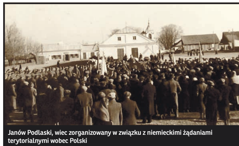
Janów Podlaski, wiec zorganizowany w związku z niemieckimi żądaniem terytorialnymi wobec Polski

Po wojnie władza komunistyczna sama sobie fundowała pomniki w Łomazach, Janowie i Piszczacu. Najbardziej jednak szokującym wśród nich była pierwotnie mogiła, a po ekshumacji: pomnik z czerwoną komunistyczną gwiazdą, która całkiem niedawno zniknęła z obelisku, znajdujący się na rynku ko-