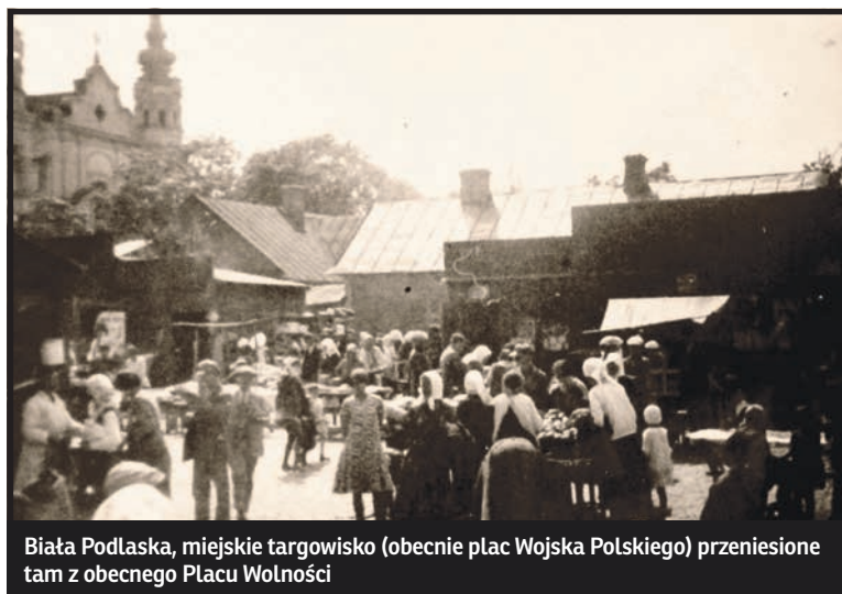
Białka Podlaska, miejskie targowisko (obecnie plac Wojska Polskiego) przeniesione tam z obecnego Placu Wolności

Przy każdym rynku znajdował się ratusz i – z reguły – kościół. Należy jednak pamiętać, że najstarsze świątynie na naszym terenie były orientowane, czyli budowane według zasady: na wschodzie – ołtarz, a na zachodzie – wejście. Taki układ spotykamy w Białej Podlaskiej (kościół św. Anny), w Międzyrzeczu (kościół św. Mikołaja) i w Radzynie (kościół św. Trójcy).