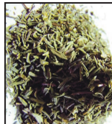
Tymianek cieszy nas jako świeże listki i jako suszone zioło

Przepis na domowy syrop z tymianku. Oczywiście najbardziej pożądanym jest tymianek świeży, ale możemy również sięgnąć po suszony. Potrzebujemy 3/4 szklanki suszonego tymianku lub 1/4 świeżego, 30 dkg cukru i pół litra wody. Tymianek zalewamy niewielką ilością wrzątku i zapa-