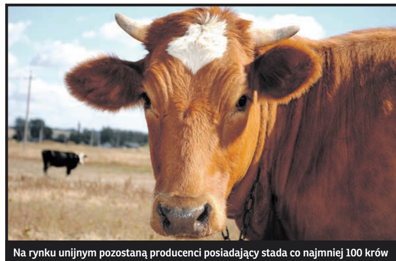
Na rynku unijnym pozostaną producenci posiadający stada co najmniej 100 krów

Za producentami z Zachodu stoi też bardzo mocne wsparcie finansowe, jakie otrzymują w postaci państwowych dopłat