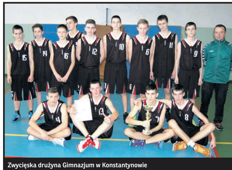
Zwycięska drużyna Gimnazjum w Konstantynowie