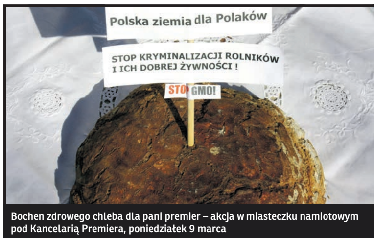
Bochen zdrowego chleba dla pani premier – akcja w miasteczku namiotowym pod Kancelarią Premiera, poniedziałek 9 marca

„Już się wydawało, że zmierzamy do szczęśliwego końca, a odpowiednie formuły w rozporządzeniach będą gotowe, gdy nastąpił nieoczekiwany i bulwersu-