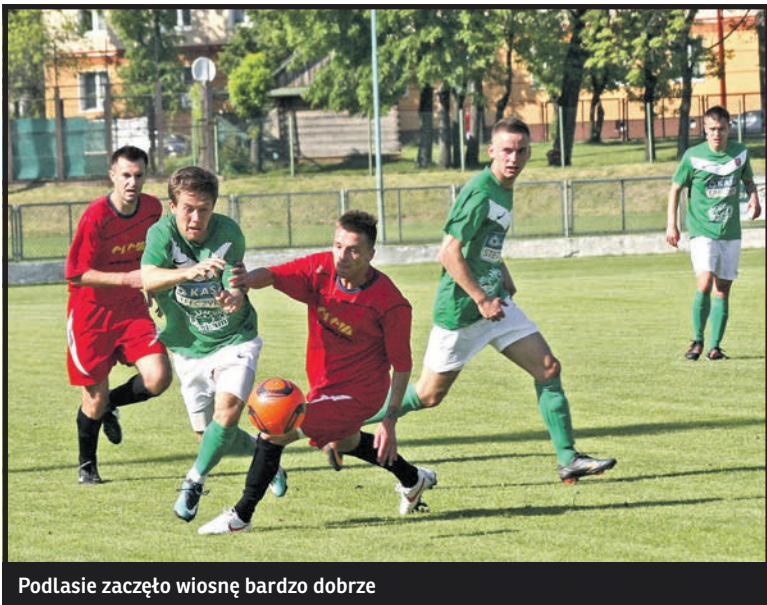
Podlasie zaczęło wiosnę bardzo dobrze