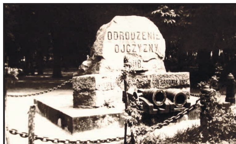
Białka Podlaska, nieistniejący pomnik Odzyskania Niepodległości w listopadzie 1918 roku wzniesiony na Placu Wolności