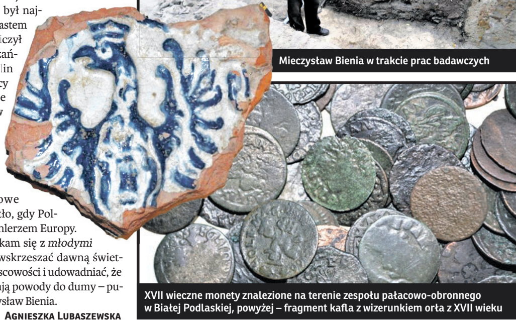
XVII wieczne monety znalezione na terenie zespołu pałacowo-obronnego w Białej Podlaskiej, powyżej – fragment kafla z wizerunkiem orła z XVII wieku