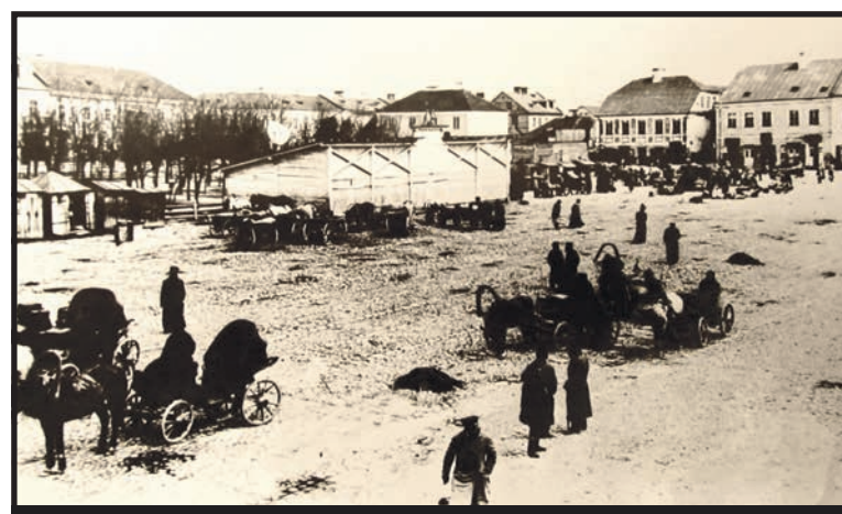
Białka Podlaska, obecny Plac Wolności na początku XX w. był targowiskiem

deńskim, naprzeciwko bazyliki, obok figury Matki Boskiej. Czasami najbardziej trwałymi elementami pomników są te, które najmniej rzucają się w oczy. Słupki stojące obecnie przy miejscu straceń na białskim Placu Wolności, umieszczone zostały w latach 90. XIX wieku przy pomniku