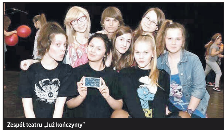
Zespół teatru „Już kończymy”