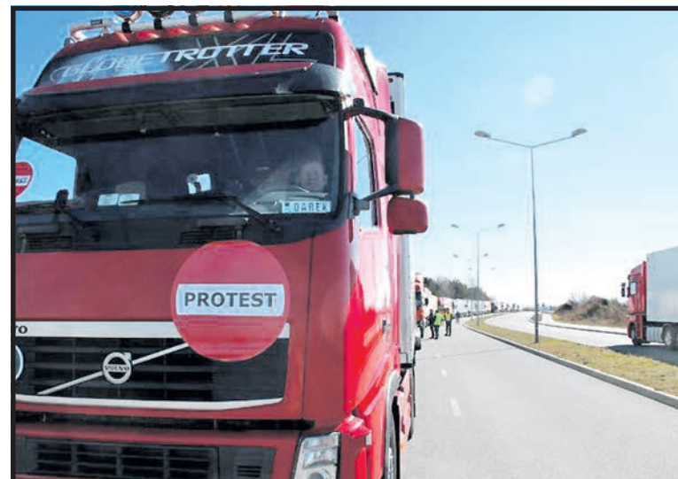
W drogowym proteście przy przejściu granicznym w Koroszczynie wzięto udział 250 tirów blokując wjazd na terminal odpraw dla samochodów ciężarowych

– Naszym firmom grozi bankructwo, ludzie są zdesperowani. Boją się, że przy następnym proteście jego przebieg może wymknąć się spod kontroli. Wiele osób nie zamierzało ukończyć protestu o wyznaczonym czasie. Mówili: »możemy