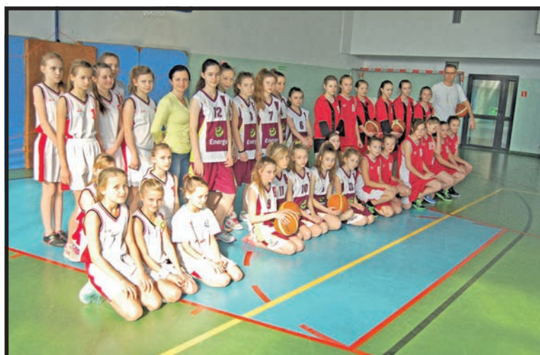
Uczestniczki finału dziewcząt (zdjęcie powyżej) i ekipa SP nr 9 z Białej Podlaskiej

Na kolejnych miejscach uplasowały się SP Okrzeja i SP 3 Biała Podlaska.