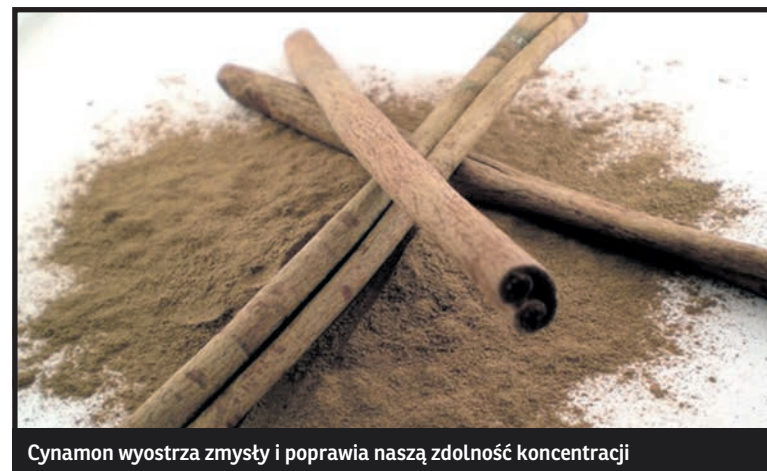
Cynamon wyostrza zmysły i poprawia naszą zdolność koncentracji