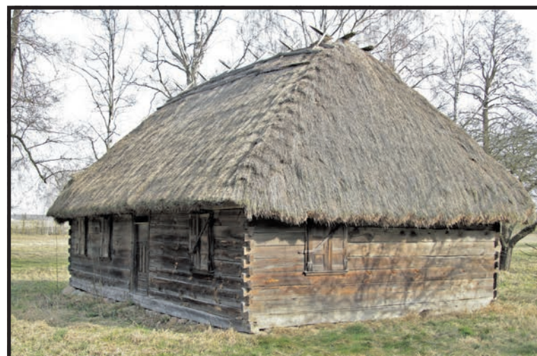
Dawny dom mieszkalny

nerała i naczelnego kapelana Powstania Styczniowego, ujętego i zamordowanego przez Rosjan w 1865 roku. Walka unitów, choć nie tak spektakularna, była bardzo długa. Gdy w 1905 roku pozwolono wybrać unitom na wybór religii między katolicyzmem a prawosławiem, większość wybrała katolicyzm. Nie dotyczyło to jednak mieszkańców Dokudowa. Ich upór trwał dalej.