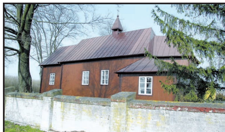
Kościół pw. św. Praksedy to jedyna pamiątka po dawnych neounickich mieszkańcach Dokudowa

Ten stan rzeczy przetrwał do czasów Unii Brzeskiej, gdy wszystkie cerkwie na naszym terenie przeszły do Kościoła Unickiego. W 1875 gdy Rosjanie zlikwidowali kościół unicki, a wiernym nakazali przejść na prawosławie. Unicy nie dali tak łatwo za wygraną. Przez 40 lat prześladowani wytrwali w wierze przodków. Mieli swoisty wzorzec w postaci krajana, urodzonego w Dokudowie. ks. Stanisława Brzóska, ge-