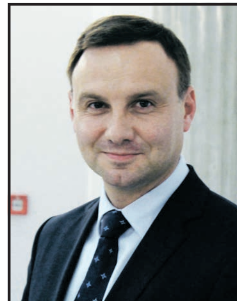
Andrzej Duda: głowa państwa musi „chronić interesy polskich rolników i polską ziemię” oraz wspierać rodzinne gospodarstwa rolne

Zdaniem Andrzeja Dudy, polscy rolnicy nie potrze-