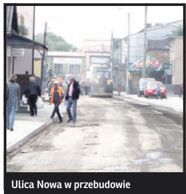
Ulica Nowa w przebudowie

Po rewitalizacji ulic Nowej i Krótkiej przyszedł czas na remont kolejnej czę-