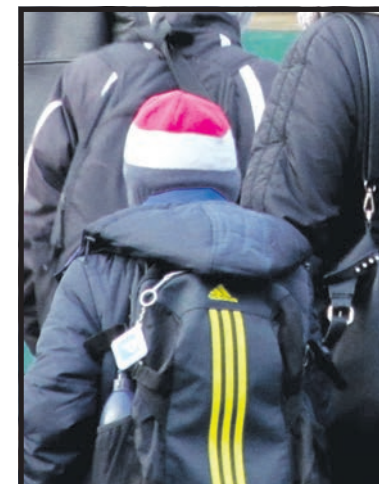
Wyprawka szkolna jest coraz kosztowniejsza

– Wszyscy mówią jedynie o kosztach podręczników, chociaż nie są one obojętne. Warto zwrócić uwagę na jakość obuwi sportowego, odzieży i plecaków. Gdy ja chodziłam do szkoły tor-