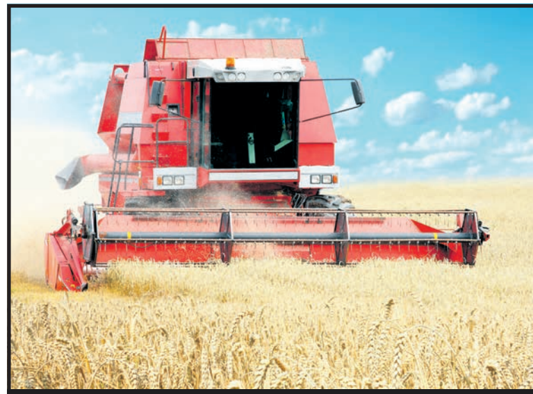
Ceny zbóż są tak niskie, że tegoroczne żniwa nie dadzą zysku - oceniają rolnicy