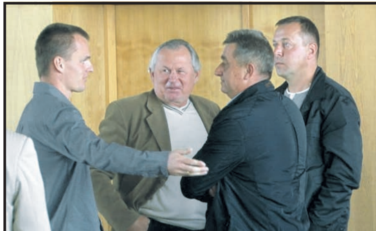
W trakcie spotkania z prezesem Agencji Rynku Rolnego w Lublinie rolnicy nie usłyszeli żadnych konkretów

Ktoś z tłumu dodaje – czy ponownie musimy wyruszyć do Kózek (miejsce ostatniego protestu rolników)?