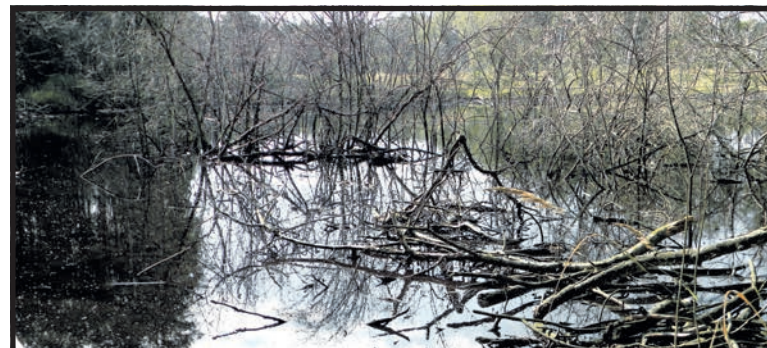
Cuchnące osady lądują w lesie obok biogazowni i fermentują

– Jesteśmy zalewani już praktycznie dookoła osiedla – mówi Bożena Grochoła z Uhnina. – Przy drodze, przy której