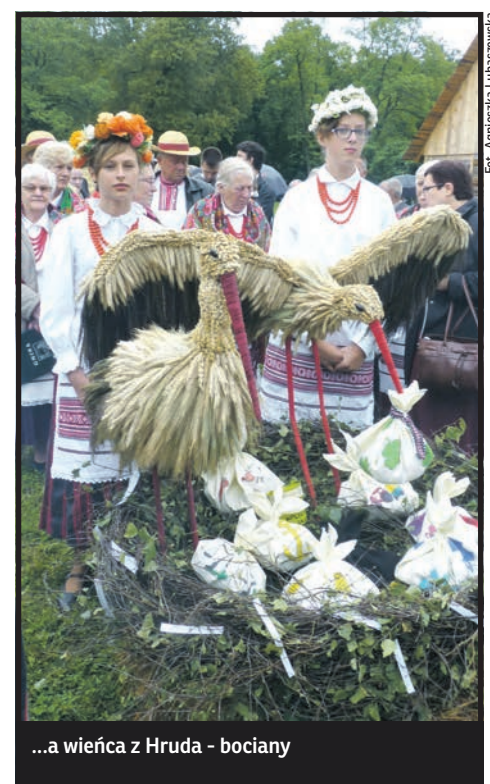
...a wieńca z Hrud - bociany

nia seniorka, upiekła chleb według receptury swojej mamy.