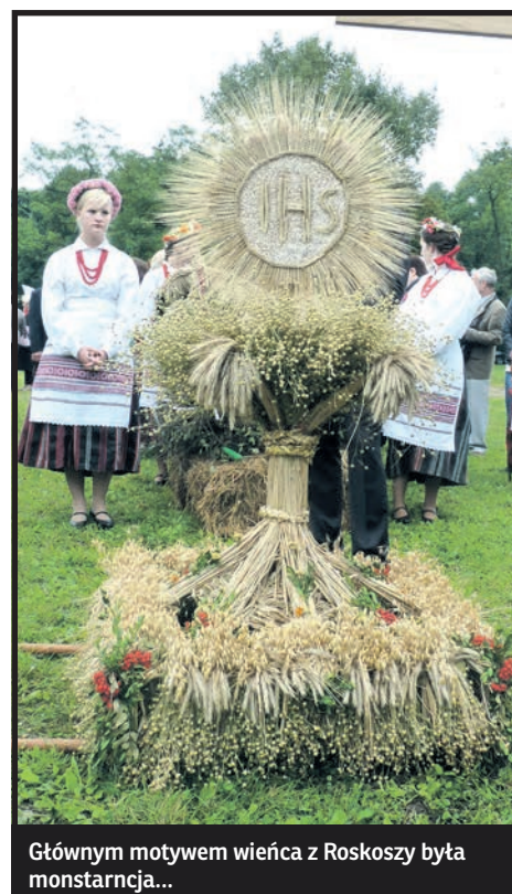
Głównym motywem wieńca z Roskoszy była monstancja...