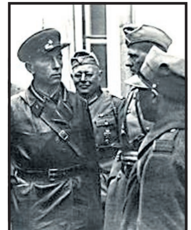
Oficerowie niemieccy i sowieccy ustalają warunki oddania Brześcia Rosjanom

28 września nastąpiła zmiana strefy wpływów. Sowietnicy mieli wycofać się na linię Bugu. Pierwsza okupacja sowiecka ziem Południowego Podlasia trwała do 12 października 1939 roku. W tym czasie Rosjanie zdążyli wywieźć cały sprzęt Podlaskiej Wytwórni Samolotów z Białej Podlaskiej oraz zapasy wojenne zboża z elewatora "Vinieta". Ludność