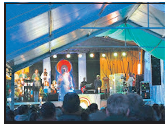
800 młodych ludzi uczestniczyło w serpelicckim spotkaniu

Golgota Młodych skupiła ludzi poszukujących wartości chrześcijańskich. Młodzi ludzie, niczym wędrowcy, podążali przez kilka dni w głąb własnego życia – do świtu. Tegoroczna Gulgota przebiegła w pięciu etapach – wody, wina, słowa, światła i chleba. Serpelicke spotkanie rozpoczęła uroczysta Droga Krzyżowa, odprawiona na Kalwarii Podlaskiej. W kolejnych dniach młodzi ludzie uczestniczyli w codziennych kateche-