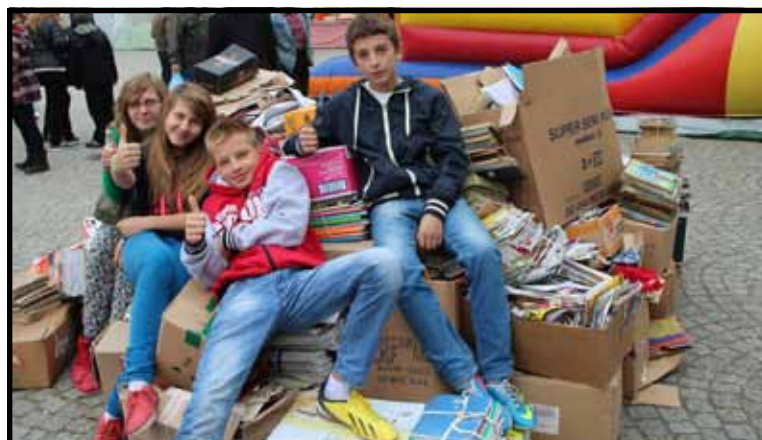
Dzieci ze szkoły nr 5 w czasie ubiegłorocznej zbiórki makulatury