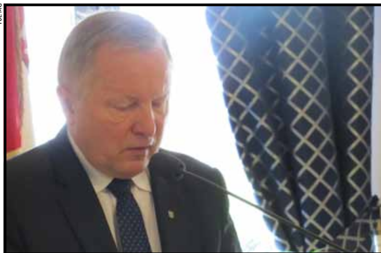
Andrzej Czapski nie informuje, kiedy umowy miasta będą publicznie

Prezydent Białej Podlaskiej Andrzej Czapski nie chce zdradzić, kiedy zostaną ujawnione wszystkie umowy zawierane przez magistrat. Przyzwoitość nakazuje, by stało się to przed wyborami, by każdy wyborca mógł sam ocenić, czy obecne władze dobrze prowadzą interesy miasta.