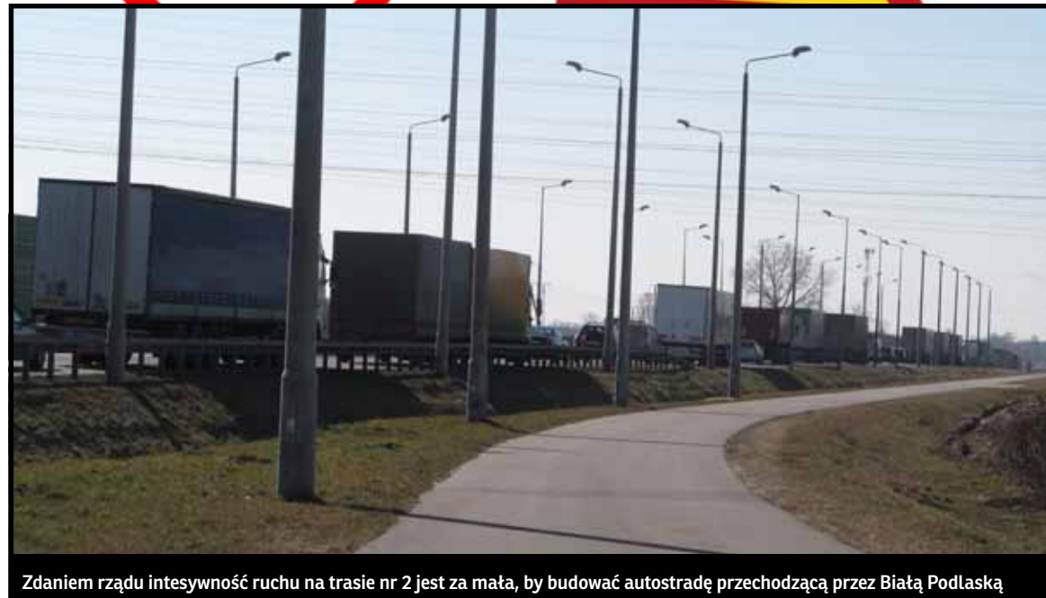
Zdaniem rządu intensywność ruchu na trasie nr 2 jest za mała, by budować autostradę przechodzącą przez Białą Podlaską