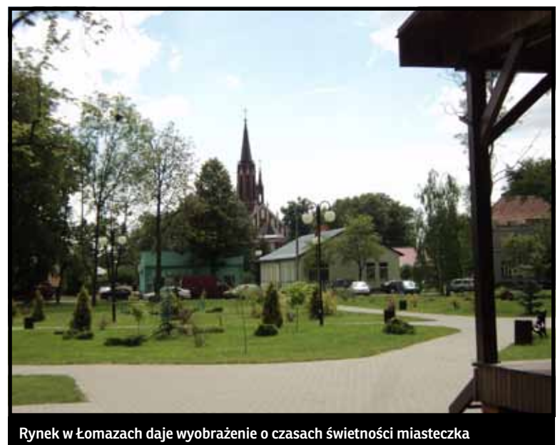
Rynek w Łomazach daje wyobrażenie o czasach świetności miasteczka

rynki w Parczewie, Łomazach i Piszczacu, które do dzisiaj zadziwiają swoimi rozmiarami.