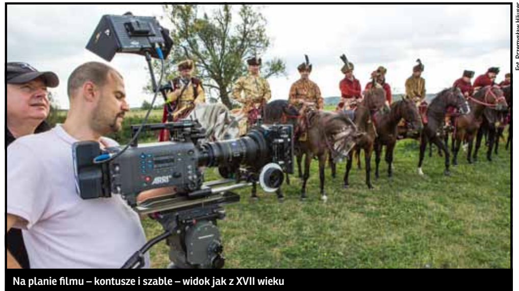
Na planie filmu – kontusze i szable – widok jak z XVII wieku