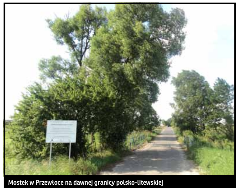
Mostek w Przewłocie na dawnej granicy polsko-litewskiej

Po przeniesieniu w 1611 roku stolicy Polski z Krakowa do Warszawy Trakt Jagielloński stał się lokalnym szlakiem handlowym. Niegdyś duże i bogate miasta zaczęły podupadać, a dowodem ich świetnej przeszłości pozostały tylko założenia urbanizacyjne: