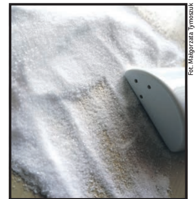
Fot. Małgorzata Tymoszuik