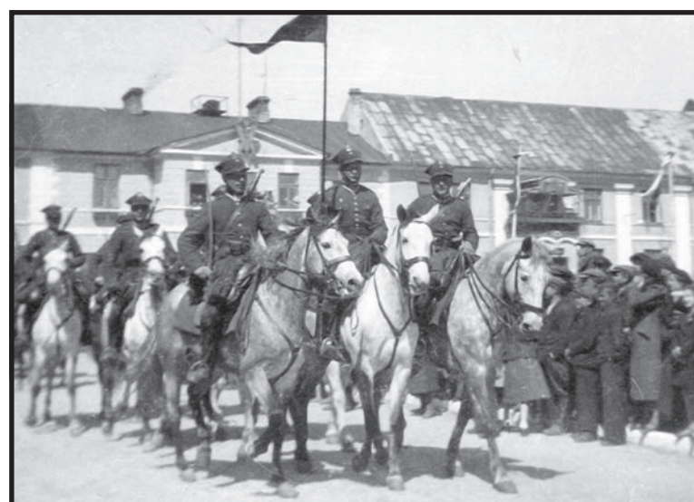
Pluton zwiadu konnego 34 Pułku Piechoty, Biała Podlaska, 3 maja 1939 roku