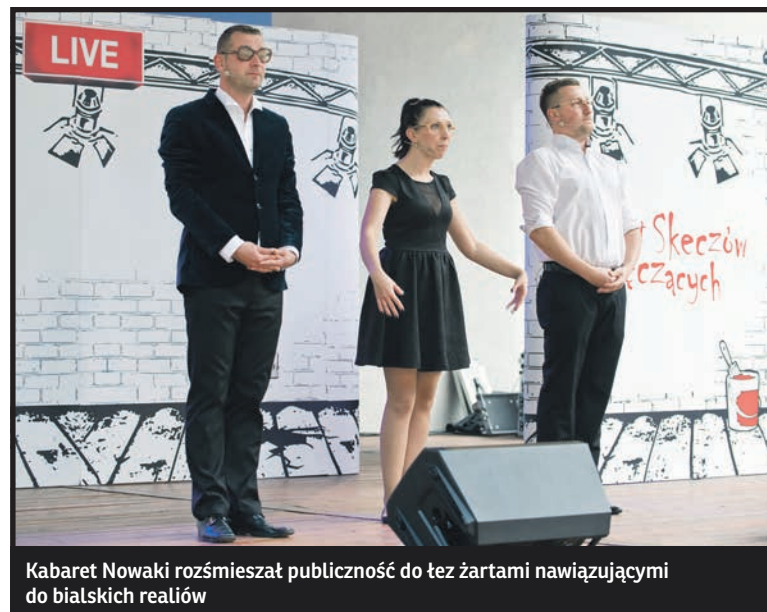
Kabaret Nowaki rozśmieszał publiczność do łez żartami nawiązującymi do białskich realiów

Podczas przyjmowanych z wielkim entuzjazmem występów artyści wykazali się również wiedzą na temat fatalnego stanu białskiego stadionu miejskiego, nazywanego przez mieszkańców „ruiną”. Kabareciarze współczuli również widzom, że zasiadając w niezadaszonym amfiteatrze muszą wciąż zastanawiać się, czy za chwilę przypadkiem nie lunie deszcz. Na szczęście podczas Kabaretu aura dopisała a publiczność bawiła się doskonale. Nie brakowało