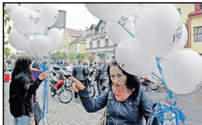
Plac Wolności: wolontariuszki PiS rozdają dzieciom baloniki

zachęcając licznie zgromadzonych wiernych, aby kroczyli drogą wiary.