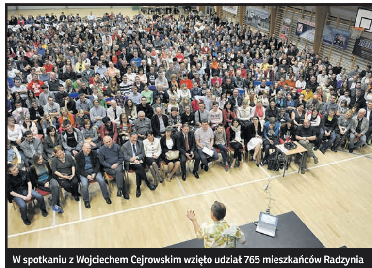
W spotkaniu z Wojciechem Cejrowskim wzięło udział 765 mieszkańców Radzyna